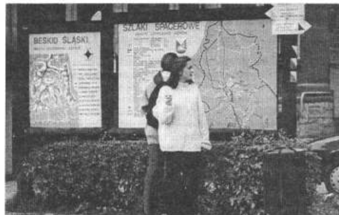
Gdzie ten przewodnik?