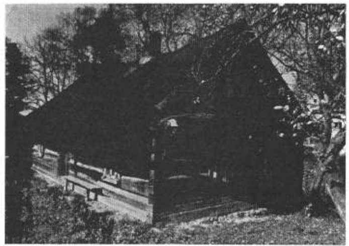
Dawne budownictwo już niedługo pozostanie tylko na fotografiach.

Kierownik Przychodni Rejonowej w Ustroniu lek. med. Marek Wiecha