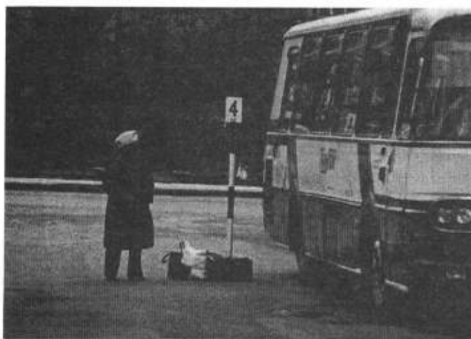
Gdzie ten pospieszny

KINO NOCNE 7.11.96 — 22.00 REAKCJA ŁAŃCUCHOWA