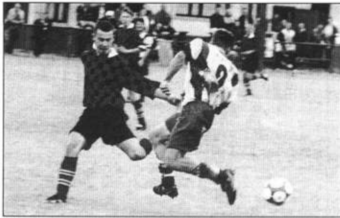
Piłkarze z Nierodzimia wolą suche boiska.