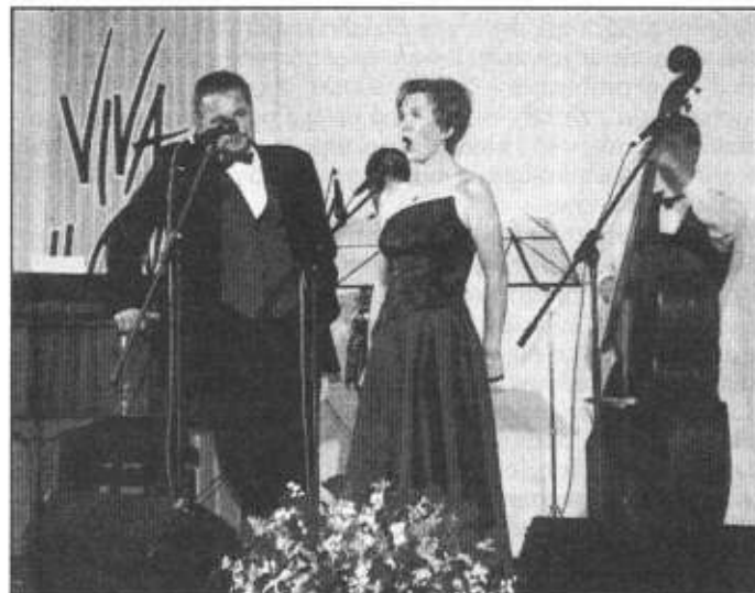
W tym roku po raz pierwszy festiwal „Viva il Canto” odbywał się także w Ustroniu. Więcej na str. 6.