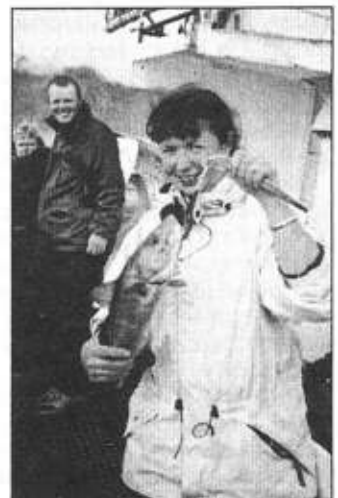
Autorka ze złowioną samodzielnie rybą.