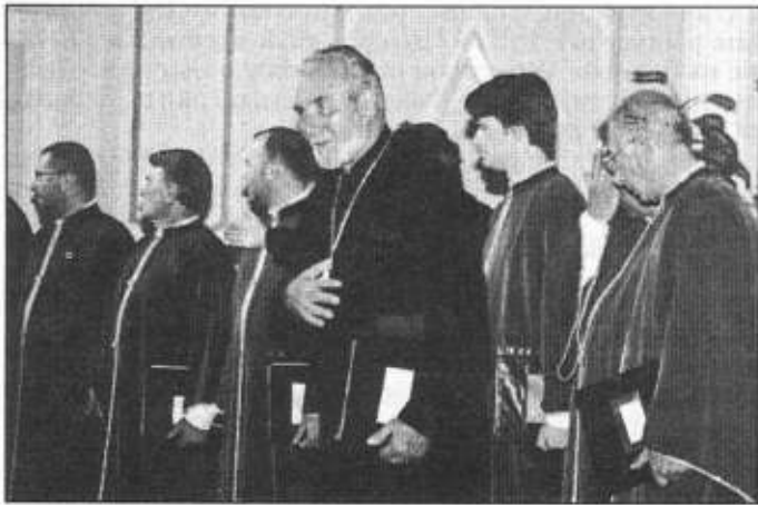
W ramach ustronńskiej części „Viva il Canto” w kościele Apostoła Jakuba wystąpił Chór Kameralny pod wezwaniem Cyryla i Metodego z Sofii pod dyrekcją K. Popowa.