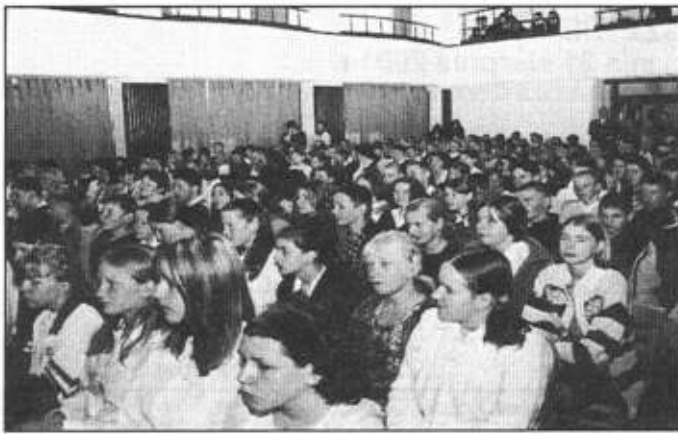
Jak będzie wyglądać matura tych gimnazjalistów?