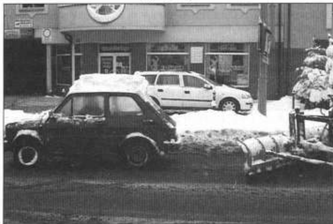
Nawet po bitych opadach z odśnieżaniem dróg nie ma problemów, gorzej z niektórymi samochodami.

Urząd Miasta w Ustroniu informuje, że został wywieszony na tablicy ogłoszeń wykaz zbywanych nieruchomości w drodze bezprzetargowej położonych przy ul. Skoczowskiej.