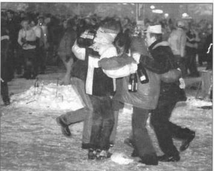
... i z szampanami.

ul. Skoczowska 137 (budynek SKR nad pocztą)