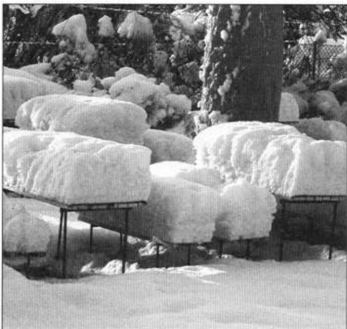
Na taką zimę czekaliśmy.