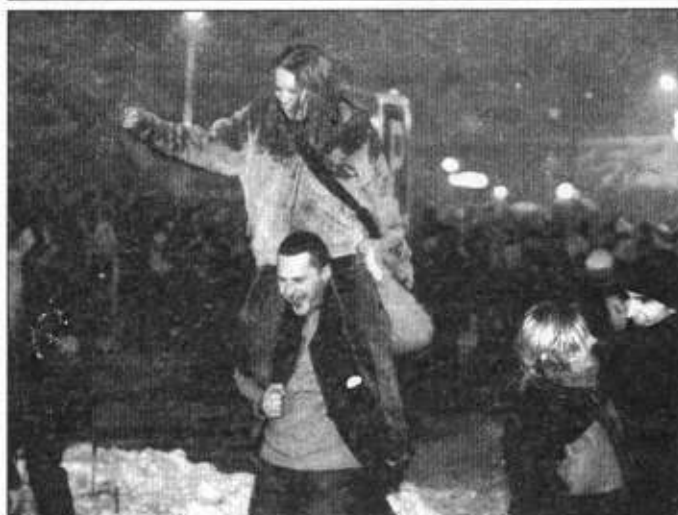
Sylwestrowa zabawa na rynku.

Zamawiający nie dopuszcza składania oferty wariantowej