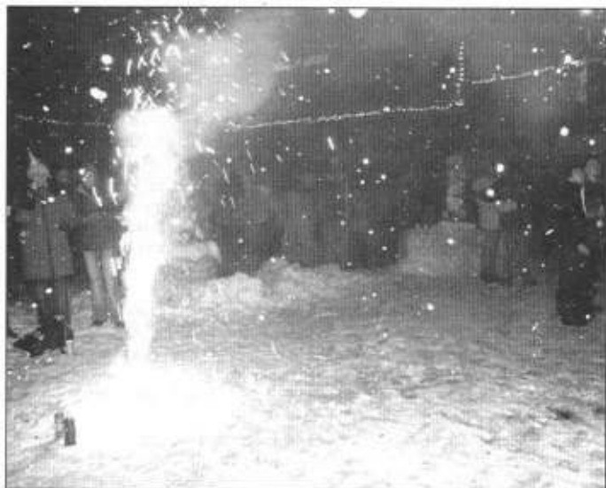
Bawiono się fajerwerkami...