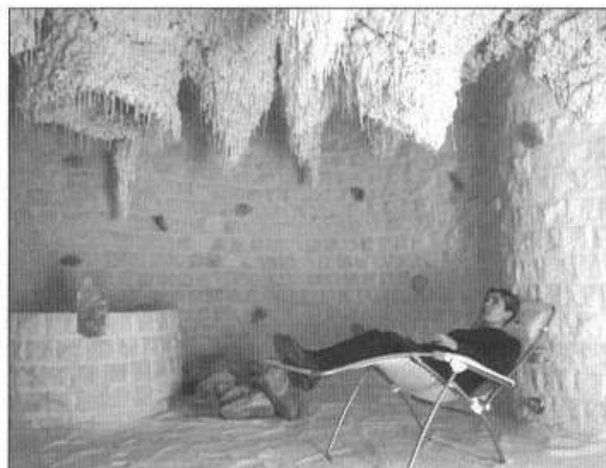
Relaks w grocie.

Uchwała wchodzi w życie z dniem 1 lutego 2004 r