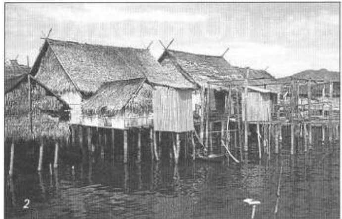
Wodna wioska na palach.

Nocne safari rozpoczyna się o godz. 22.00 w całkowitych ciemnościach. Przejście z latarkami około jednego kilometra przez las tropikalny do przystani nad rzeką było mocnym przeżyciem. Po raz pierwszy widziałam jak piękne, barwne ptaki siedzą na gałę-