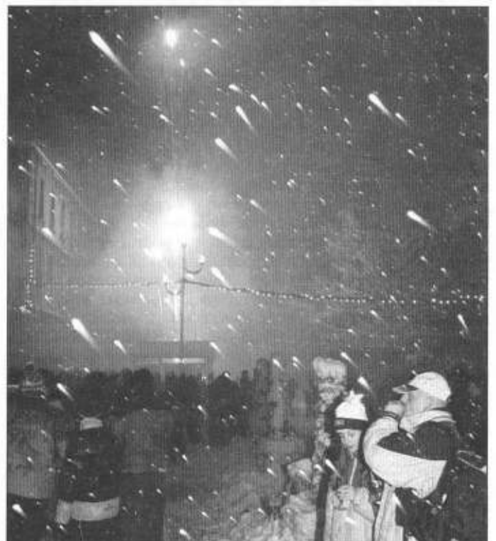
W Sylwestra sypnął śnieg.