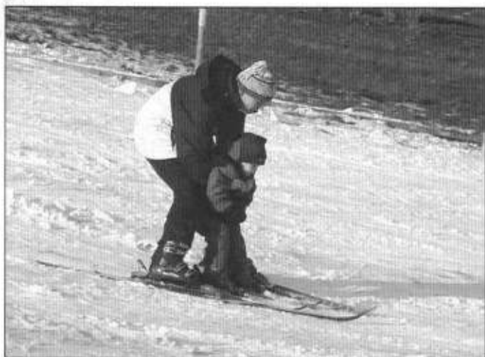
Trening przed zawodami.