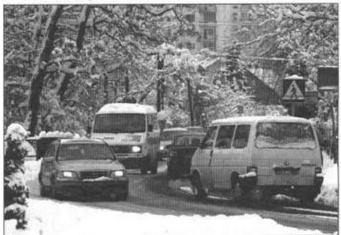
Dziś jeździmy samochodami i narzekamy na tłok.