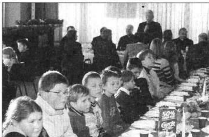
Wigilijka w Fontanie.