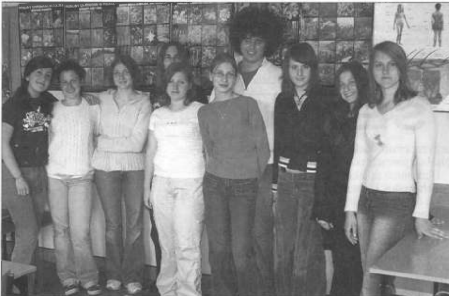
Drużyna z nadwiślańskiego gimnazjum w Ustroniu.