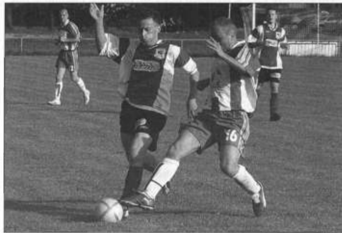
Zawodnicy się szanowali.