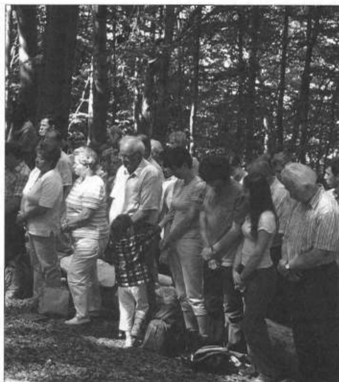
Modlitwa w leśnej świątyni.