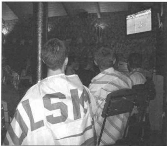
W wielu ustrońskich lokalach kibice wspólnie oglądali mecze Mistrzostw Świata 2006. Telewizor w pubie, to nie rzadkość, ale na Mundial część właścicieli zainwestowała w duże, wysokiej jakości odbiorniki, tak, żeby nawet z końca sali można było oglądać rywalizację piłkarzy. Szczególnie na mecze Polaków kibice przychodzili tłumnie, ubrani w biało-czerwone koszulki, z szalikami zawieszonymi na szyjach i z flagami narodowymi na plecach. Trzeba podkreślić, że mimo iż emocje sięgały zenitu, było spokojnie. Nie używano niecenzuralnych słów, a entuzjastyczne okrzyki podgrzewały atmosferę i zagrzewały do boju piłkarzy. Można było poczuć namiastkę emocji, które towarzyszyły widzom na stadionach.

Rynek 4, tel. 854-34-83; kom. 604-55-83-21; z ERY: darmowy 986