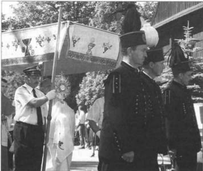
W procesji szła delegacja górników.