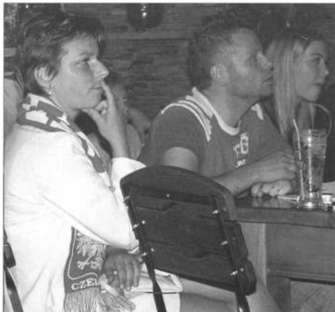
Mecze z wielkim zainteresowaniem oglądały w pubach również panie. Oplakiwać naszą drużynę przychodziły nawet całe rodziny. Było spokojnie.