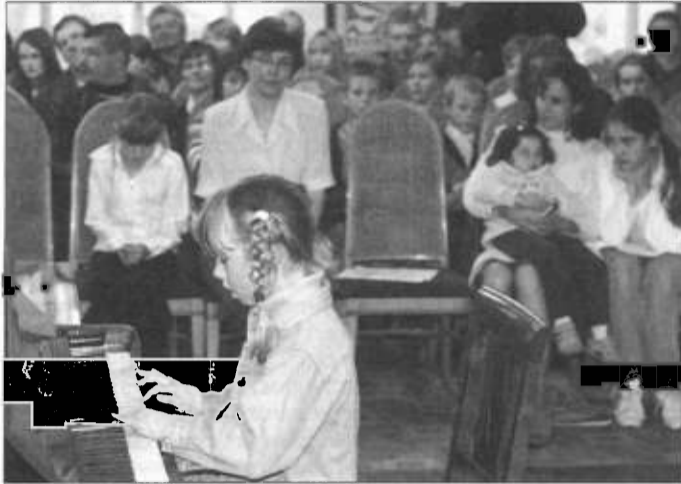
Popis w Muzeum Ustrońskim.