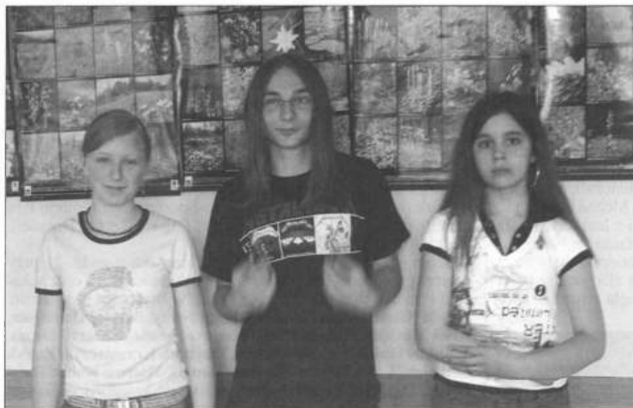
Znawcy parków krajobrazowych.