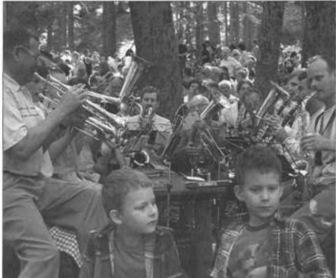
Grała Dęta Orkiestra Diecezjalna.

Kazanie wygłosił ks. T. Szurman, który mówił m.in.: Góry od zawsze były miejscami bożego objawienia i oddawania Bogu chwały przez człowieka. Wyniosłość gór sięgająca nieba głosiła wszak potęgę bożą, a dla ludzi stawała się miejscem odpoczynienia, ale też ucieczki i schronienia. Stąd góry, zwane świętymi, znaczyły najpierw historię narodu wybranego w Starym Testamencie i przybliżały plan bożego zbawienia dla ludu nowego przymierza. (...) Była też Góra Oliwna, na której Jezus wygłosił mowę o końcu świata a u jej podnóża został pojmany, jak przepowiedział prorok Zachariasz. (...) I w końcu ta góra najważniejsza, Golgota, na której Chrystus dokonał zbawienia grzesznego człowieka, a otworzył przed nami bramy Swego Nieba. Ślącycy ewangelicy też mają takie góry święte. Tutaj Przy