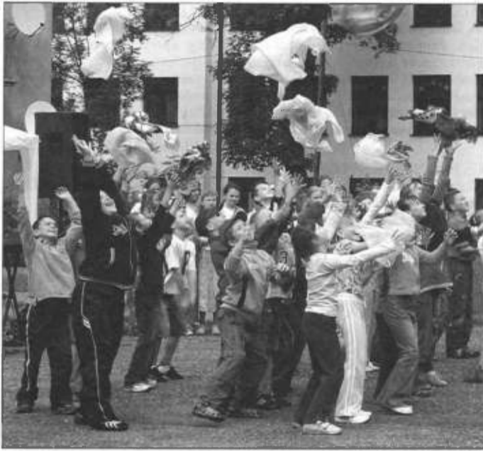
Festyn SP-1. Zabawy górnicze...