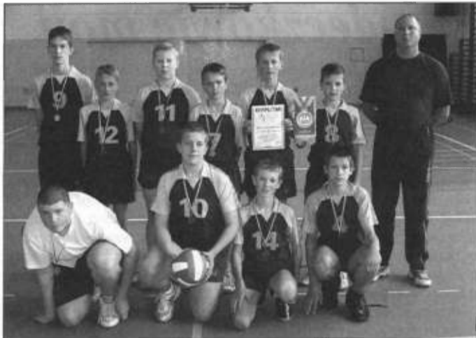
Siatkarze SP-2 z trenerem.