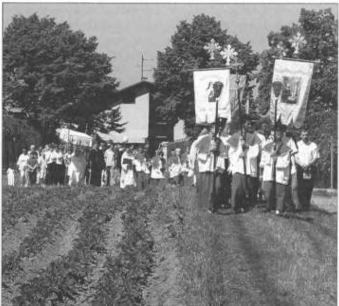
Bardzo liczna procesja parafian z Nierodzimia.