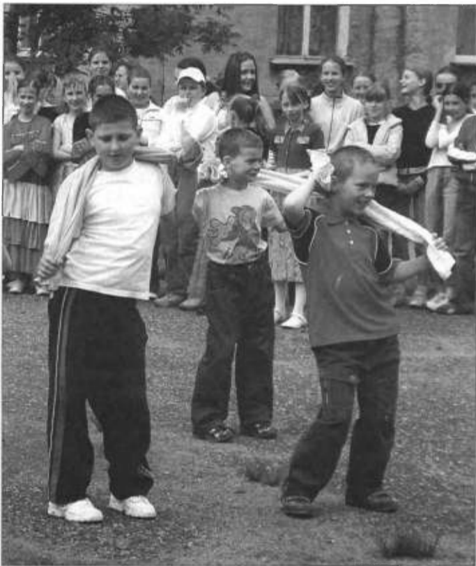
Drugoklasiści śpiewali: Wyginaj ciało śmiało.