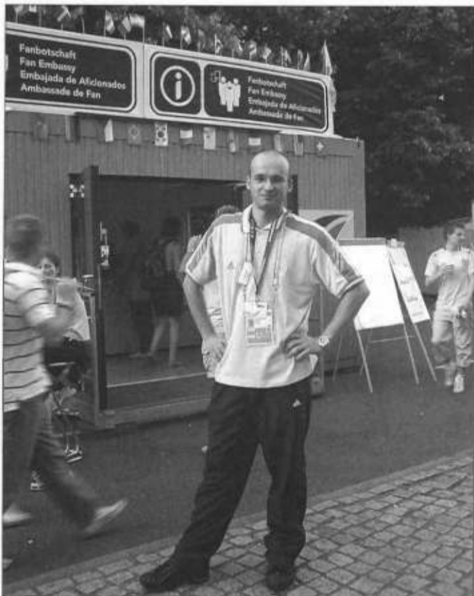
Autor w stroju wolontariusza przed jedną z Fan Embassy (ambasada dla kibiców) w pobliżu Bramy Brandenburskiej.