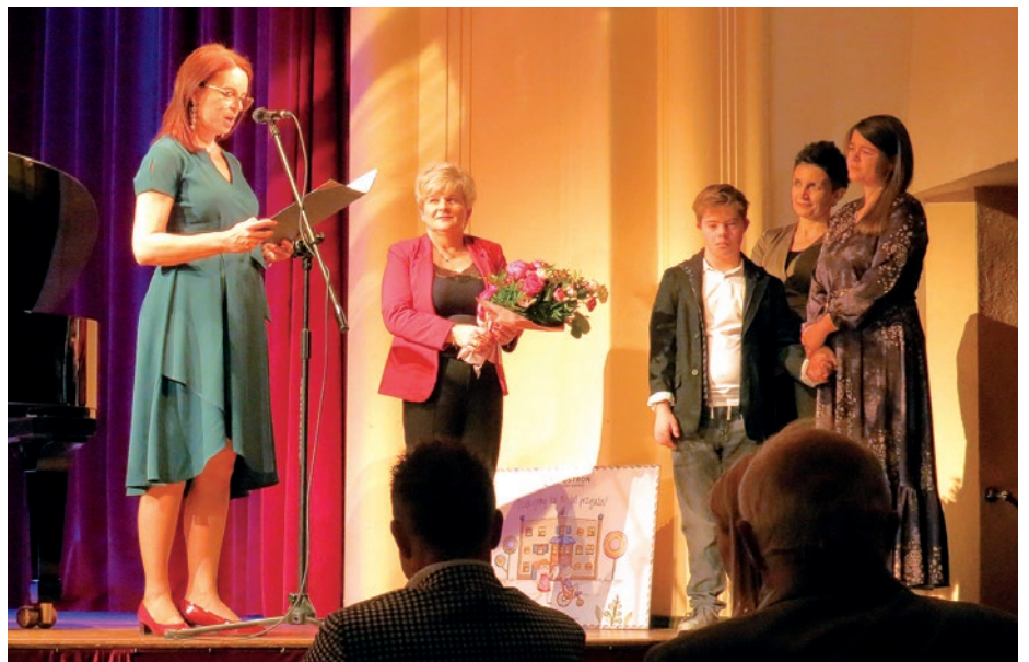
Wychowanek Ośrodka wręczył przedstawicielkom Urzędu Miasta pamiątkową grafikę.