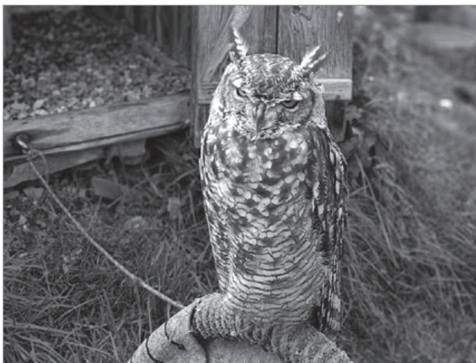
Jak to dopiero 16.00?