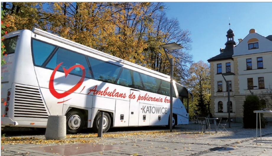
Krwiobus w jesiennej szacie.