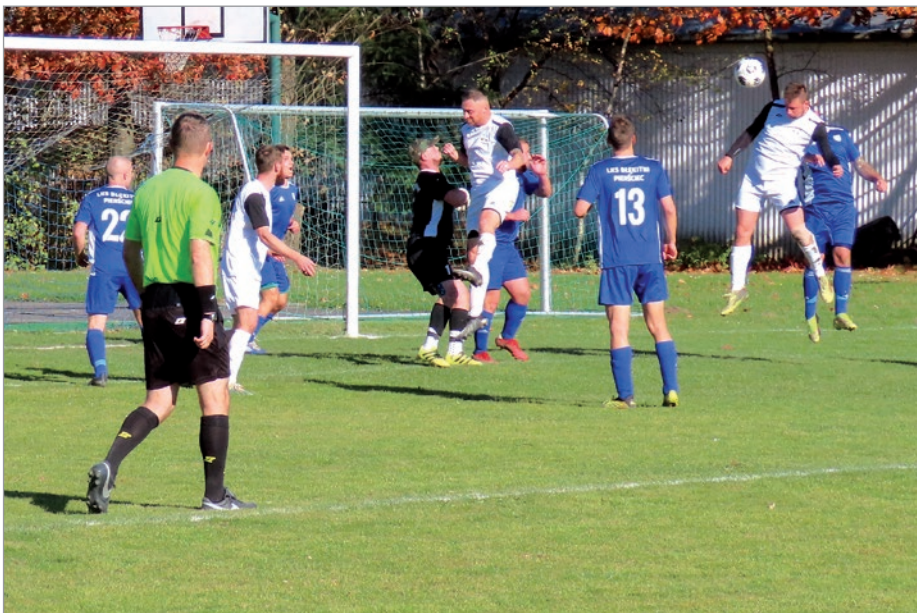
Po tej akcji pada kontrowersyjna bramka.