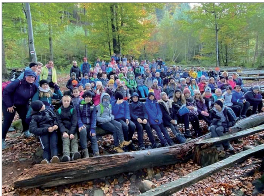
Na szlaku pieszej wędrówki na młodzież czekały koperty z zadaniami do wykonania, a nagrodą dla zwycięzców były słodycze.