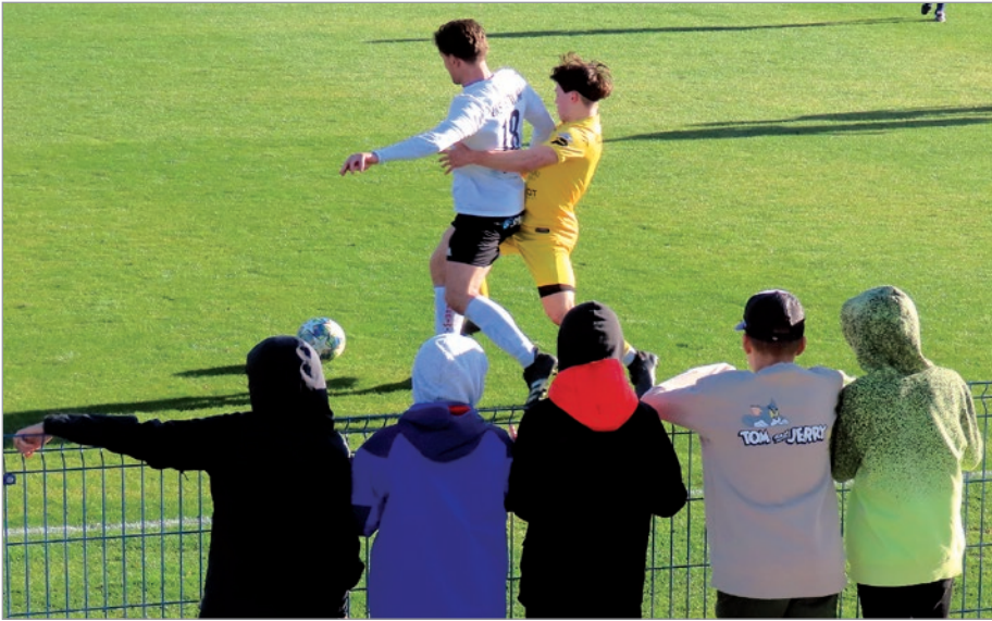
Młodzi Kuźnicy trzymali kciuki do ostatniej minuty.