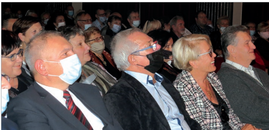
Gościowi wieczoru towarzyszy mąż i dawni przełożeni.