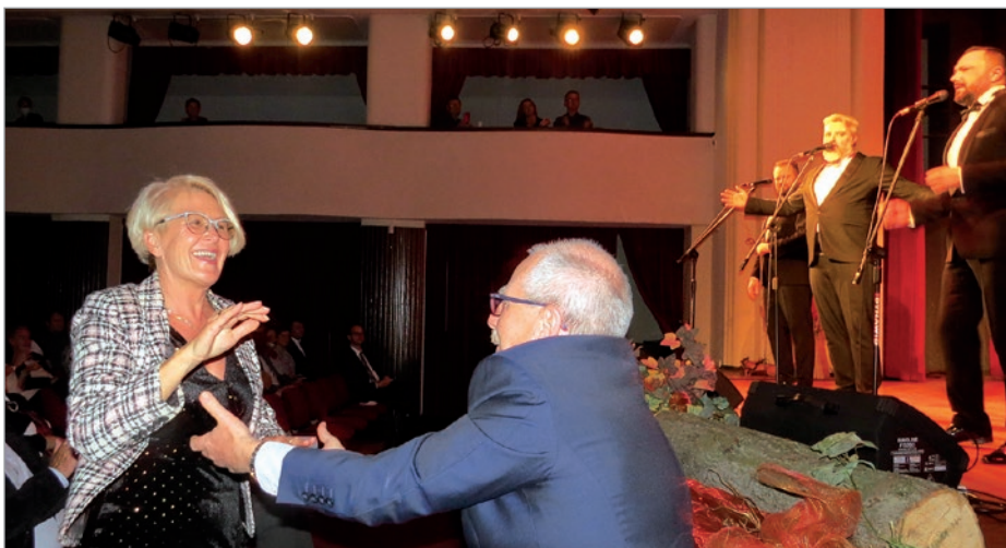
Do tak znakomitej muzyki nogi same rwą się do tańca.