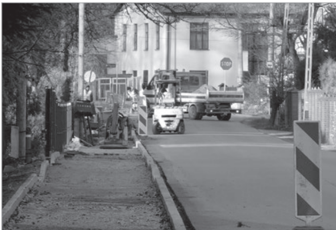
Nie taki dawny Ustroń, 2017 r.

Badanie można wykonać po miesiącu od daty przyjęcia szczepionki. Trzecią dawkę szczepionki można przyjąć po upływie sześciu miesięcy od daty przyjęcia drugiej dawki.