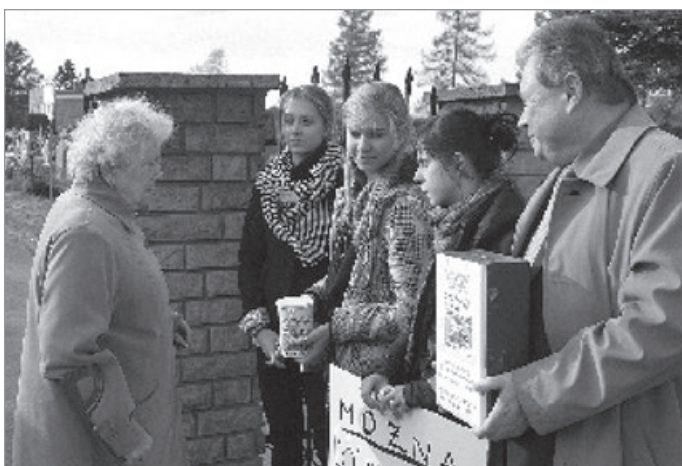
Nie taki dawny Ustron, 2010 r.