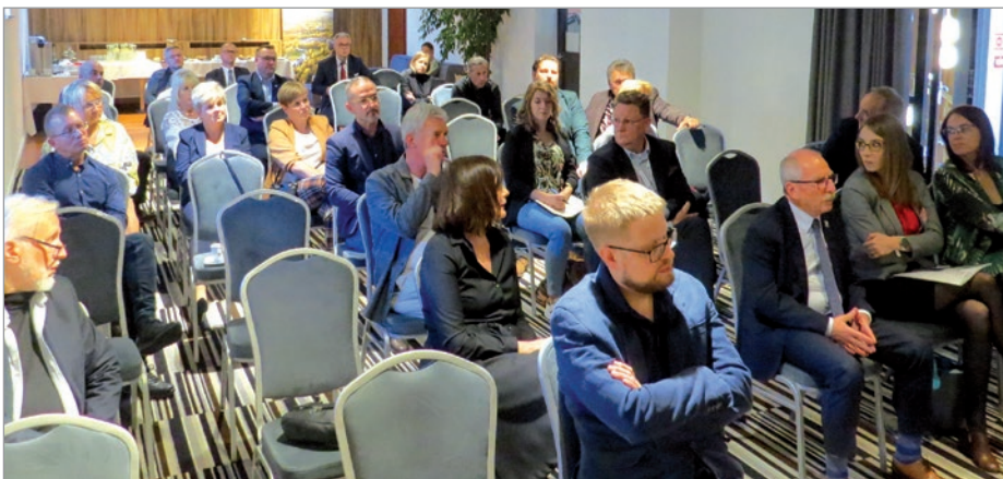
Konferencja naukowa „Dzielnica wczasowa Ustroń Jaszowiec - ochrona dziedzictwa powojennego” odbyła się w Hotelu „Kolejarz”.