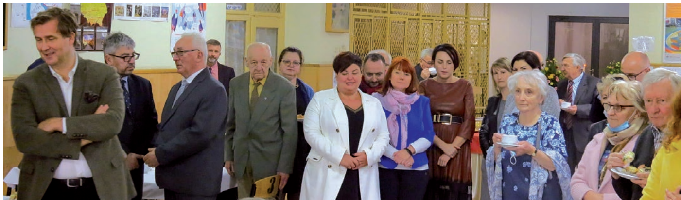
Goście uroczystości zaproszeni zostali do ZST na poczęstunek i zwiedzanie budynku.

W numerze m.in.: Patowa sytuacja - remis w głosowaniu nad planem, Przyznanie Lauru Srebrnej Cieszyńianki, Szołomiaki na szare dni, Wybór proboszcza, Kwestowali 1 listopada, Smalec gęsi przysmakiem i lekarstwem, Zakochany pieśnik, Bieg Legionów, Remis Nierodzimia na koniec, Strzeleckie fatum Kuźni.