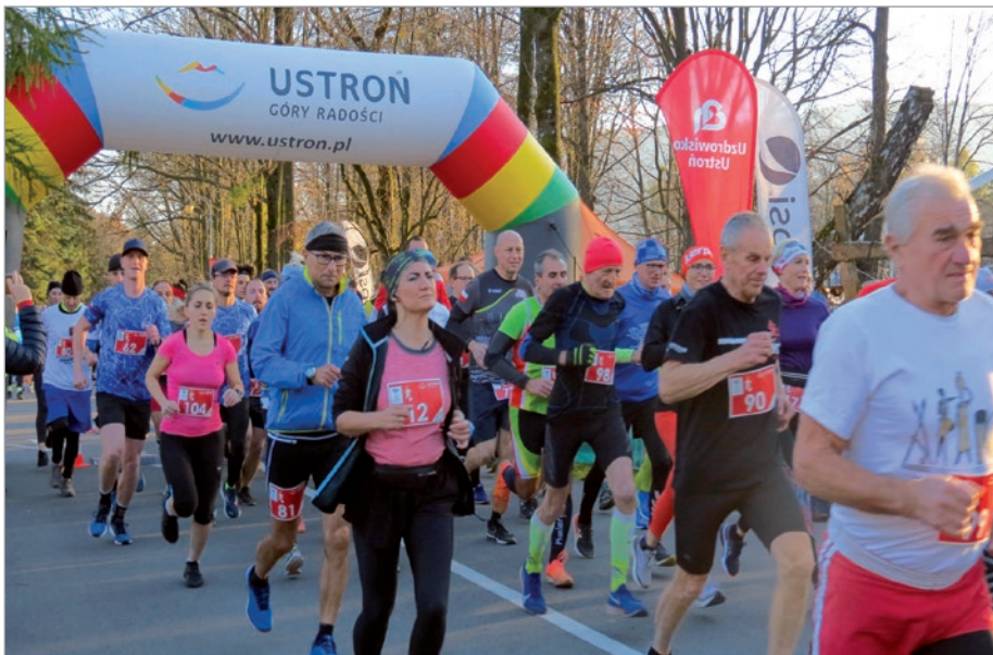
Biegacze ruszyli punktualnie o 15.00.