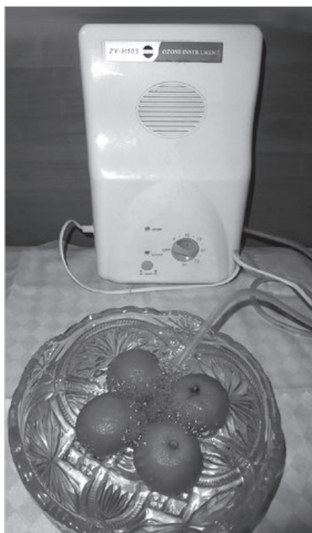
Ozonator żywności.

Systematyczne dbanie o zdrowie powinno być długofalowym zadaniem dla każdego na co dzień. Jego realizacja jest nieraz trudna, jednak jeżeli jesteśmy konsekwentni w działaniu,