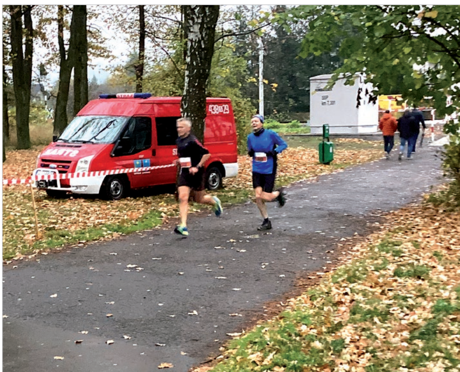
Trasa była dobrze zabezpieczona i oznaczona.

W życiu wielu amatorów biegania następuje taka chwila, w której decydują się na wystartowanie w zawodach. Wcześniej biegają dla rozrywki czy zdrowia, ale z czasem chcą spróbować pobiegać z innymi, aby sprawdzić swoje możliwości. Taką możliwość daje Bieg Legionów w Ustroniu, który już od wielu lat przyciąga na bulwar wiślany rzeszę adeptów tego sportu. Dla jednych było to wielkie święto i zwieńczenie wielu miesięcy, a może i nawet lat przygotowań.