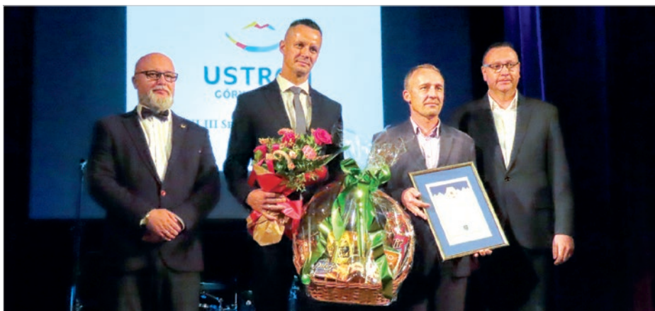
Przedstawiciele Zarządu Kuźni odebrali gratulacje od władz miasta.