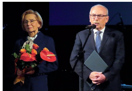
Życzenia od władz powiatowych...