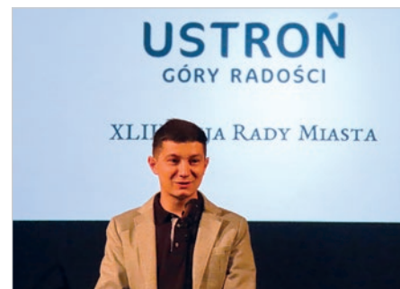
... i od zaprzyjaźnionego KS Nierodzim.