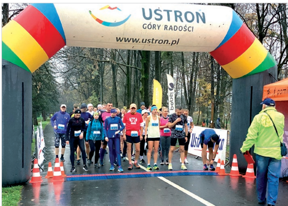
Przed startem na dystansie 5 km.