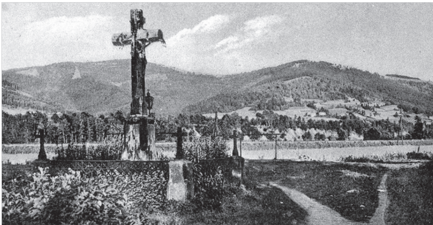
Krzyż przy obecnej ul. Krzywej wzniesiony w 1897 r. nad stawem fabrycznym.