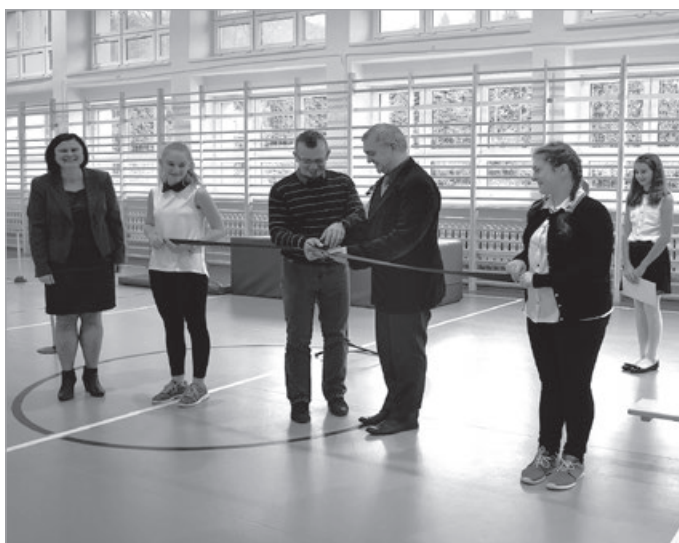
Nie taki dawny Ustron, 2016 r.