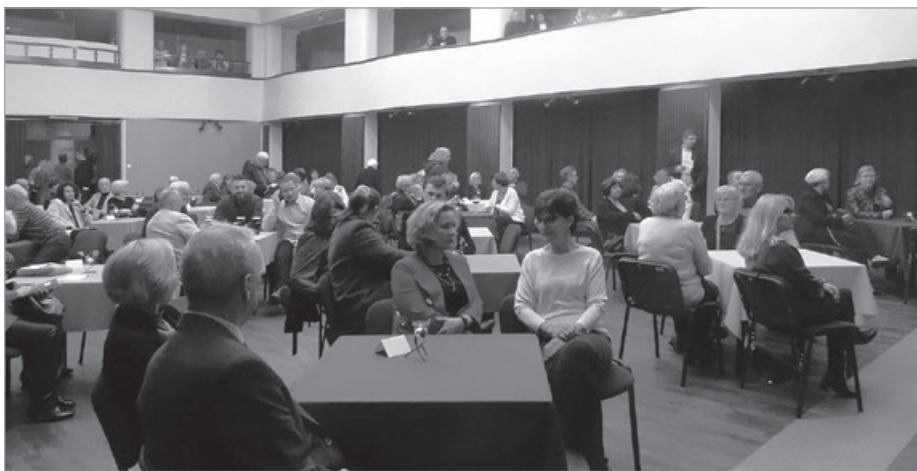
Piosenki o miłości zawsze zachęcają do przybycia na koncert, więc sprzedano wszystkie bilety.