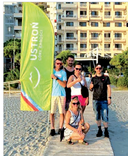
Finał Złombolu - Ustroń w Albanii.