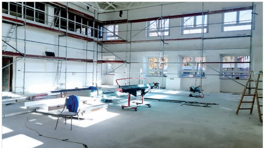
W miejscu dawnych warsztatów powstaje pełnowymiarowa sala sportowa.

Czekamy więc na finał całego remontu zasłużonego dla miasta obiektu. Warto wybrać się na spacer w te okolice, aby samemu zobaczyć widoczne już efekty. Te mogą się już podobać. Mateusz Bielez