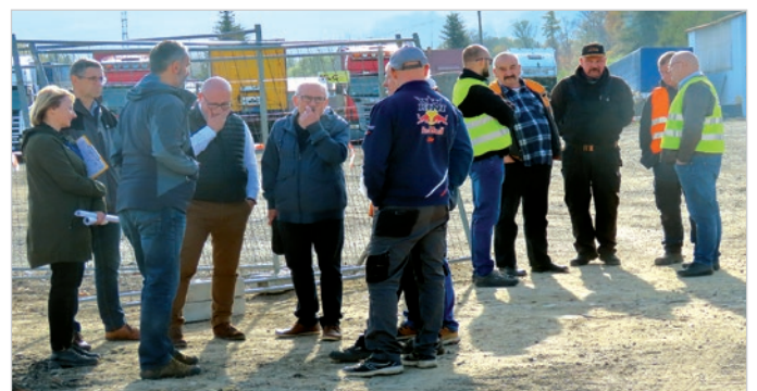
Miasto nie jest stroną, bo to inwestycja ZDW, ale warto rozmawiać.