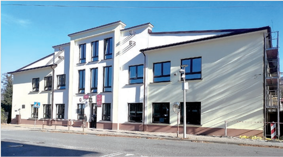
Nowa odsłona ustroniego technikum.