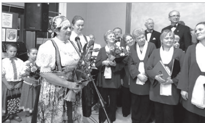
Nie taki dawny Ustron, 2015 r.

W ramach imprezy „5 kroków dla rodziny” 26 listopada (sobota) odbędzie się spacer nordic walking. Weryfikacja uczestników godz. 9.00-9.45, start godz. 10.00 ul. Nadrzeczna 1. Biorąc udział otrzymasz atrakcyjne gadzety oraz pyszne przekąski na doładowanie energii. Zapisy pod adresem: https://www.facebook.com/StowarzyszeniePowerActive .