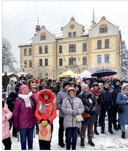
Pomimo syjącego intensywnie śniegu na rynku znalazło się wielu gości.