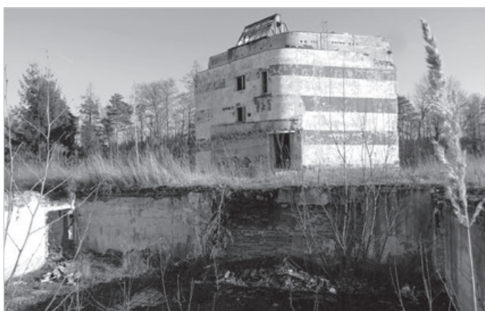
Nie taki dawny Ustroń 2013 r. Nieistniejący już dom wczasowy przy dwupasmówce w Nierodzimiu.

Rozwiązanie z GU nr 48: nie ma rozwiązania, gdyż błąd w zapisie sprawił, że był to mat w jednym ruchu. Niby łatwiej... ale przepraszam trzeba. Wojśław Suchta