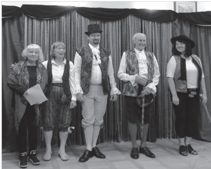
Aktorzy wraz z suflerką.

Jestem 5 miesięcznym kawalerem o imieniu Grześ. Pochodzę z Ustronia gdzie urodziła mnie bezdomna kotka. Dwa miesiące temu As stał się moim tymczasowym domem. Sprawdzę się jako jedynak w nowym domu ale też nie mam nic przeciwko towarzystwu psów i kotów. Bo takich jak ja kotów w domu Asa jest bardzo dużo i żyjemy w zgodzie. Załatwiam się do kuwety. Jestem zaszczepiony, zaczipowany i wykastrowany. Jeżeli dysponujesz wolnym fotelem lub miejscem na kanapie to zadzwoń 606911687.