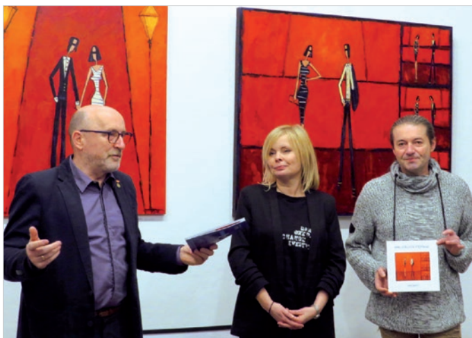
Artystka z organizatorami wystawy na tle obrazów.