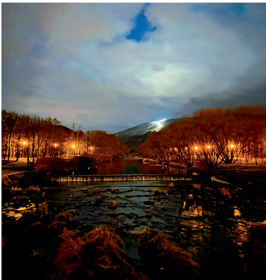
Jasno na czerwonej trasie. Więcej na str. 6.

Nr 50 (1602) • 15 grudnia 2022 r. • 2,50 zł (w tym 5% Vat) • ISSN 1231-9651