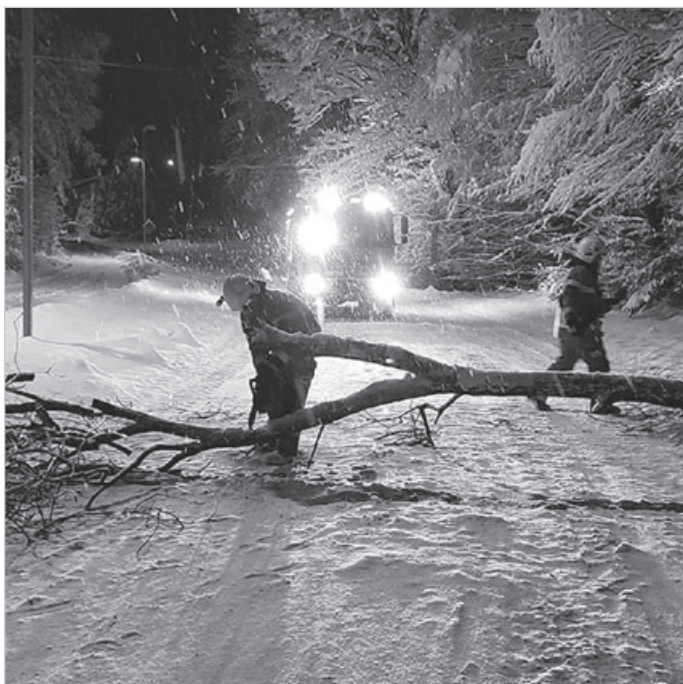
Strażacy znów mają ręce pełne roboty.