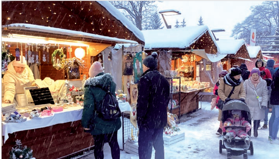
Niepowtarzalny urok i zakupy na świątecznym jarmarku.

Najmłodszych witały zabawne postacie, Michałki i żelkowe Smoki, które nawiązywały do słodyczy znanej marki. Po wejściu do przyczepy można było skorzystać z animowanych gier zręcznościowych,