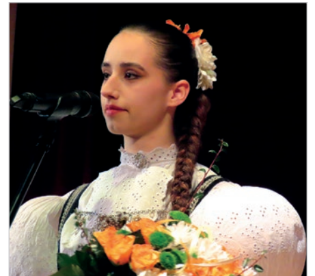
„Tyś mnie mamie nauczyła...”