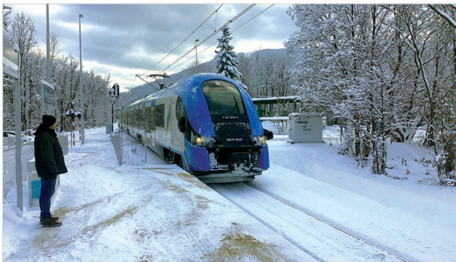
Pociągi ruszyły. Pierwsi podróżni wyczekują pociągu na przystanku Ustroń Brzegi. Więcej na str. 6.