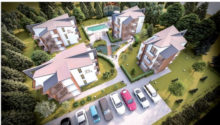
Tak wygląda wizualizacja obiektów, gdzie za m 2 trzeba zapłacić ponad 17 tys. zł.