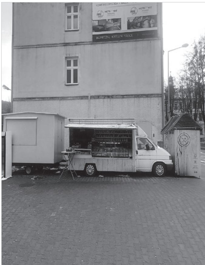
Niebanalna zwarta zabudowa w samym centrum miasta...