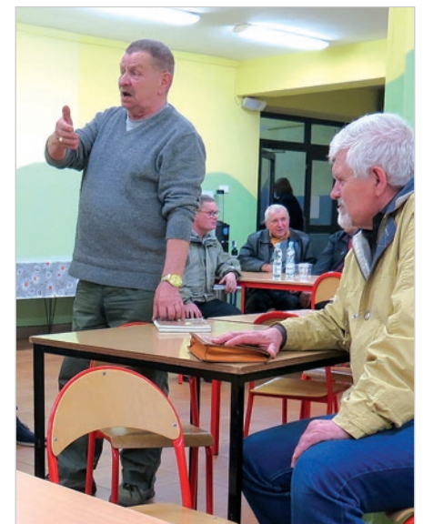
Ponownie gorącym tematem była Młynówka.