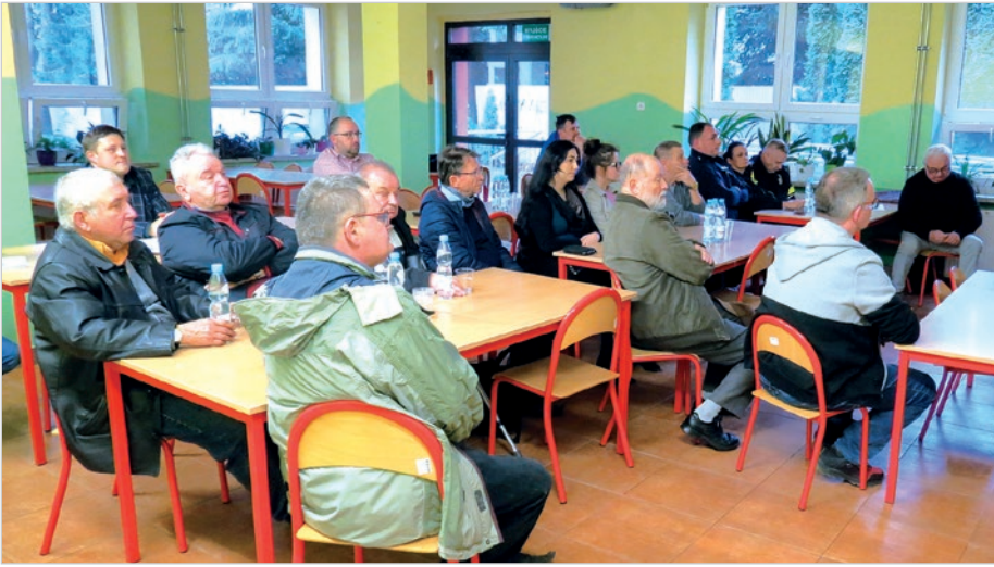
Uczestnicy zapelnili całą salę przeznaczoną na zebranie.