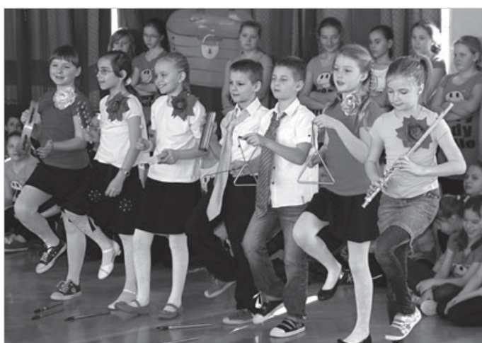
Nie taki dawny Ustroń, 2013 r.