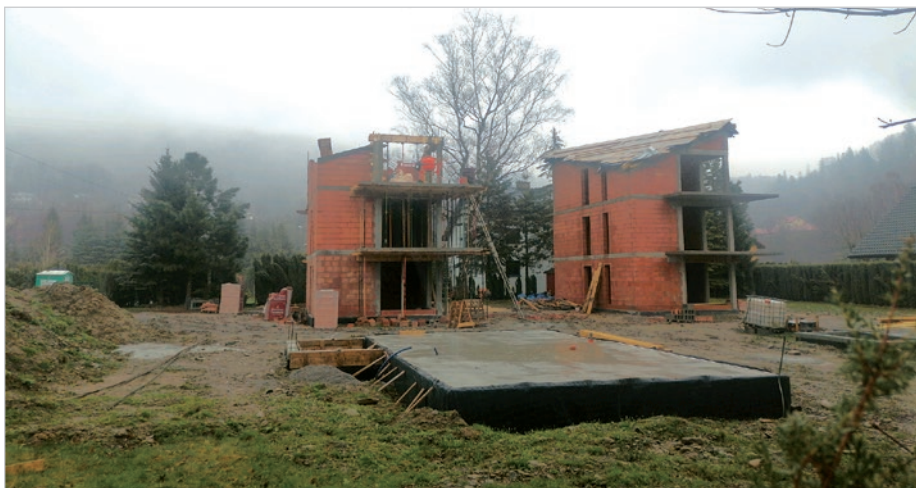
To tu powstają obecnie najdroższe apartamenty w Ustroniu.

Choć tak duże inwestycje na ogromnym obszarze jak budowa Jaszowca, Zawodzia i Manhattanu już się nie powtórzyły, to i tak nie da się nie zauważyć, że w tej chwili buduje się tam, gdzie znajdzie się choć skrawek terenu pod nowy apartamentowiec. Z drugiej strony mieszkańcy miasta mogą cieszyć się z powodu wzrostu wartości własnych czterech kątów w, jak klarownie pokazuje rynek mieszkań, prestiżowym w kraju mieście.