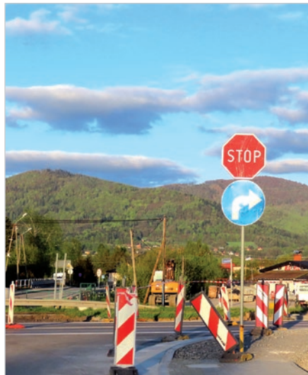
Z ul. Kozakowickiej można jechać tylko do Ustronia.