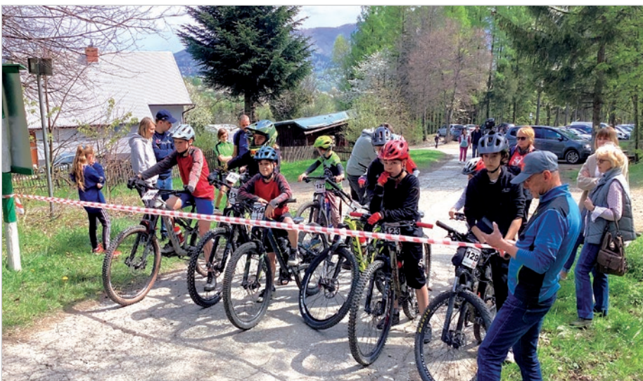
We wtorek na stokach Czantorii pojawili się najmłodszy w zawodach MTB. Być może niebawem będą także uczestniczyć w zawodach downhillowych.

Od 29 kwietnia do 1 maja w Ustroniu przejęli wyczynowi rowerzyści, którzy uczestniczyli w zawodach DOKA Downhill City Tour. Rywalizacja przebiegała w dwóch sceneriach, miejskiej i tradycyjnej górskiej. Frekwencja była dobra, a przybyli na imprezę zawodnicy prezentowali najwyższą klasę. To był dobry pokaz dla kibiców, a ci dopisali, szczególnie w poniedziałek. Chyba dzięki pogodzie, bo wówczas na niebie pojawiło się słońce.