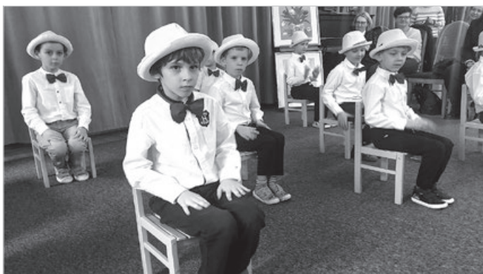
Czasem trzeba być super grzecznym...