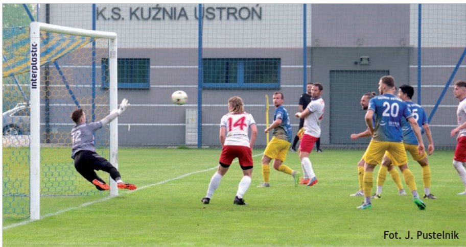
Fot. J. Pustelnik