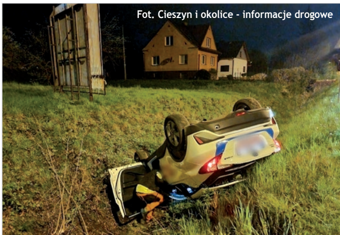
Fot. Cieszyn i okolice - informacje drogowe