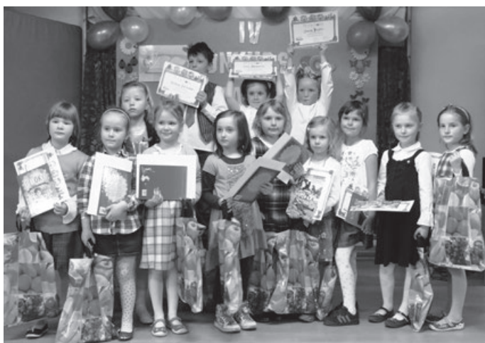
Nie taki dawny Ustroń, 2014 r.