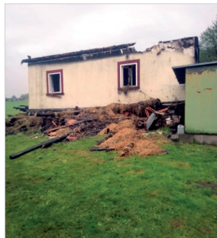
Dom po pożarze.