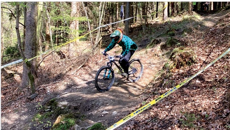
Trasy zawodów są bardzo niebezpieczne i wymagają sporych umiejętności od zawodników.