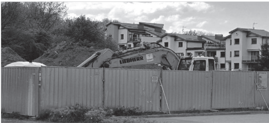
Po drugiej stronie ul. Brody same pawilony i powstaje kolejny.