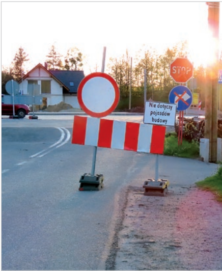
Nie można wjechać na DW941 z ul. Dominikańskiej.