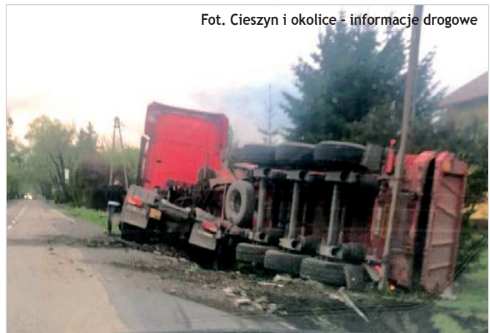
Fot. Cieszyn i okolice - informacje drogowe