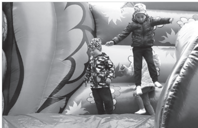
...żeby potem zaszaleć.

APTEKA czynna 24 h znajduje się w Cieszynie na ul. Bobreckiej 27 (obok Kauflandu) „PRIMA”, tel. 33 858-27-65.