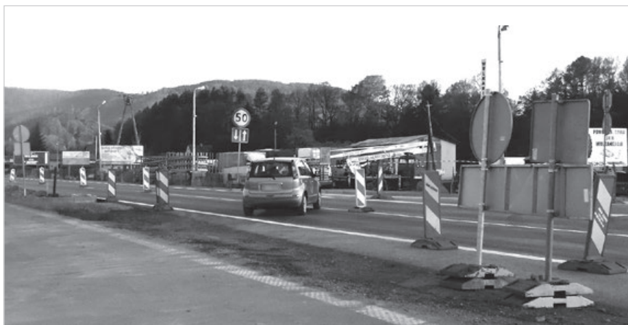
Niektórzy kierowcy jeżdżą między słupkami.