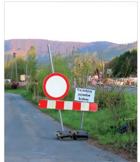
Zamknięta jest ulica biegnąca wzdłuż dwupasmówki.