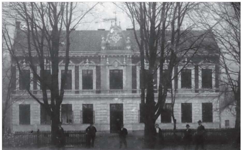
W latach 1902-1908 powstał budynek Szkoły Podstawowej Nr 1 przy Rynku.

W roku 2019, w wyniku reformy edukacji i powrotu do 8-klasowych szkół podstawowych, budynek wybudowany w 1999 r. powrócił do Szkoły Podstawowej nr 1.