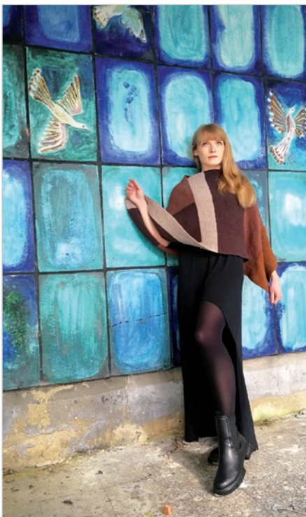
Jaszowiec – autorka na tle unikatowej dekoracji ściennej.

Kompleks wczasowo-wypoczynkowy w Jaszowcu powstał w latach 60. XX wieku. Skala obiektów była uwarunkowana rosnącym zapotrzebowaniem pracowników z Górnego Śląska na odpoczynek w zielonym i zdrowym otoczeniu.