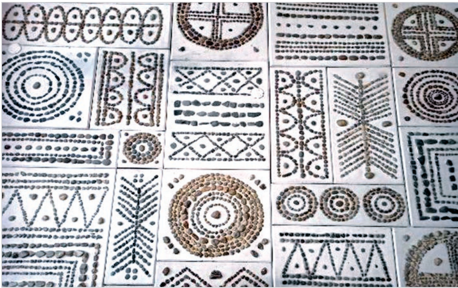
Mozaika wykonana z kamieni mieszcząca się w sali restauracyjnej Mazowsze Medi SPA.