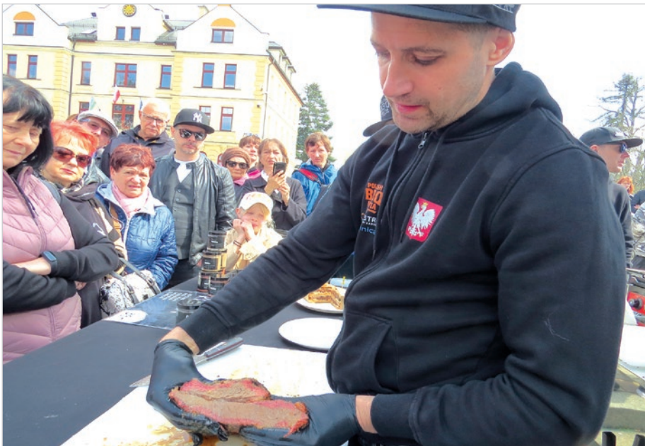
Mistrz BBQ prezentuje wyborny kawałek mięsa, a zgromadzeni w długiej kolejce smakosze nie mogą się już doczekać degustacji.