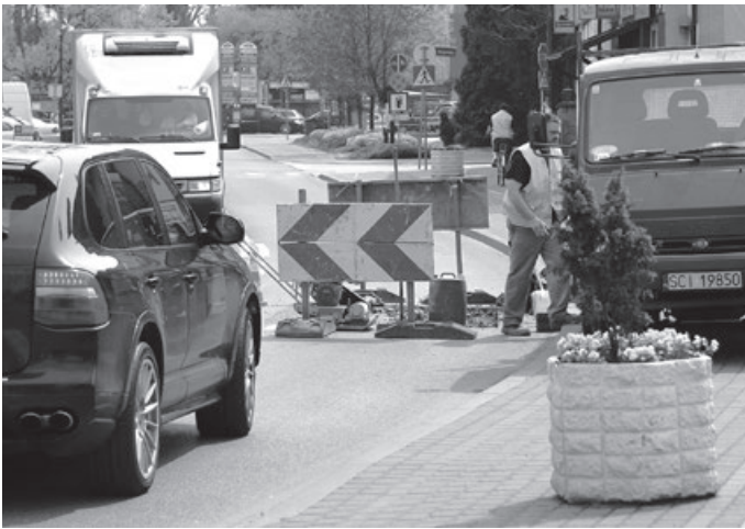
Nie taki dawny Ustroń, 2014 r.

Taxi93 - Ustroń / tel. 512-174-694 www.taxi93-ustron.pl