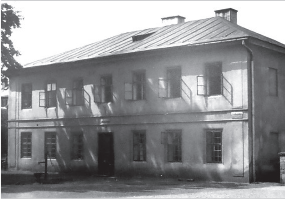
Do budowy nowej siedziby szkoły obok kościoła św. Klemensa przystąpiono w 1870 roku.