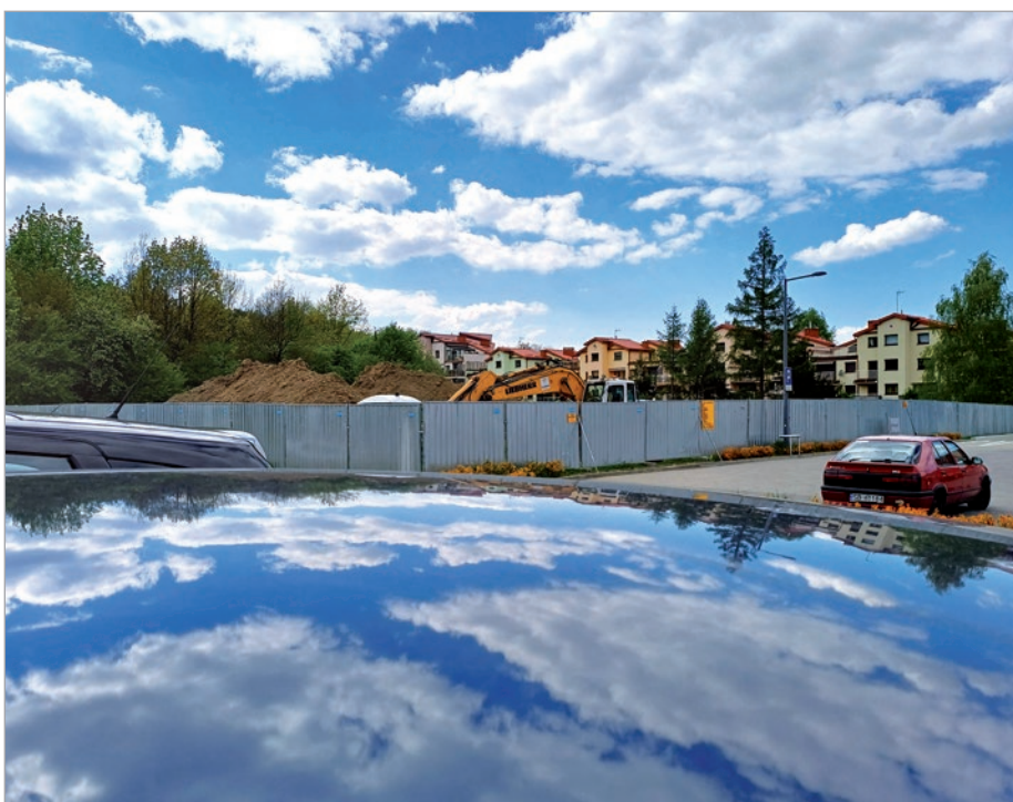
Zimni Ogrodnicy i Zośka za nami, jest szansa, że już od soboty powyżej 20°C.

Nr 19 (1622) • 18 maja 2023 r. • 3,00 zł (w tym 5% Vat) • ISSN 1231-9651