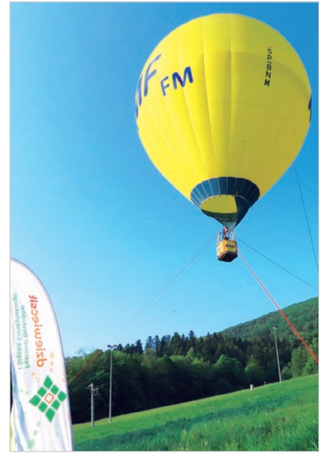
Tylko szczęśliwcy się wznieśli.