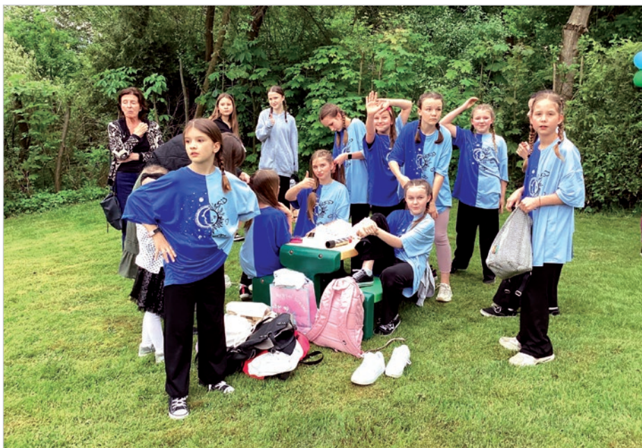
Wystąpił zespół Red Gang z MDK Prażakówka.