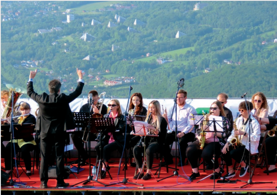
Można było obserwować, jak muzycy wjeżdżają i jak grają na Czantorii.