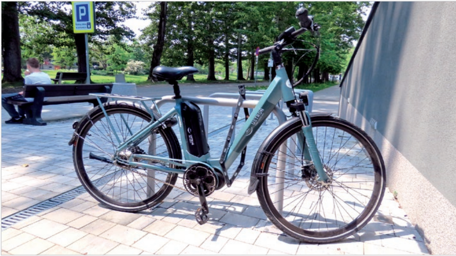
Rowery miejskie czekają na chętnych na ul. Nadrzeczej.