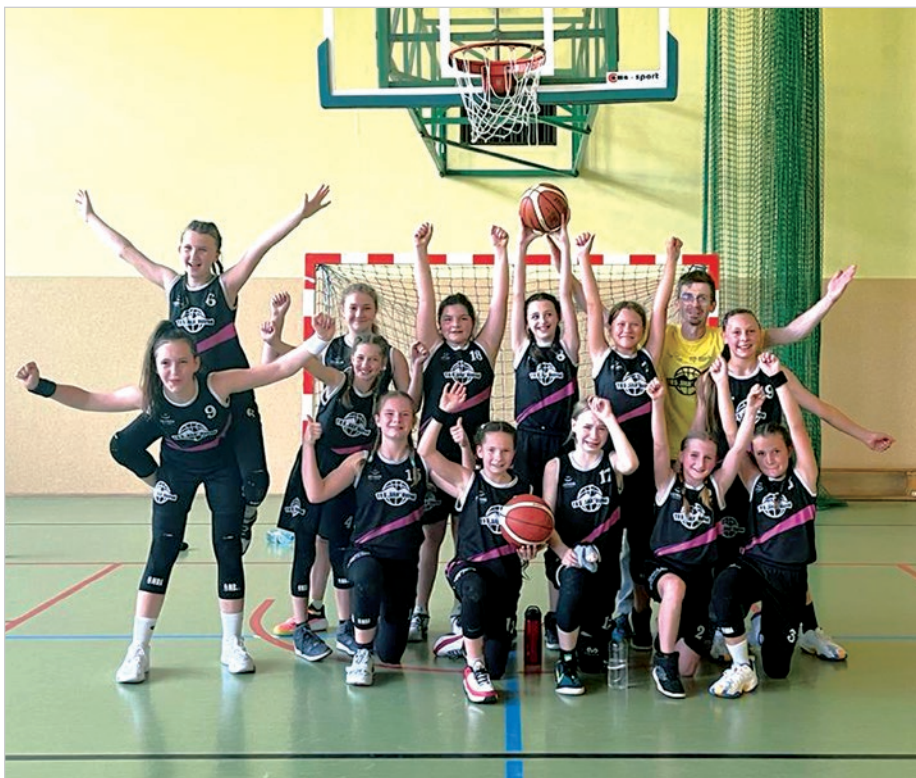
Nasze złote medalistki.