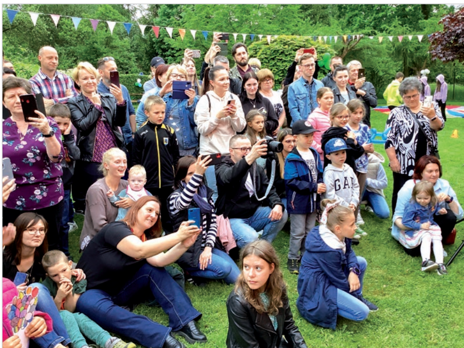
40-lecie Żłobka Miejskiego i najwierniejsza publiczność najmłodszych mieszkańców naszego miasta.

Nr 21 (1624) • 1 czerwca 2023 r. • 3,00 zł (w tym 5% Vat) • ISSN 1231-9651