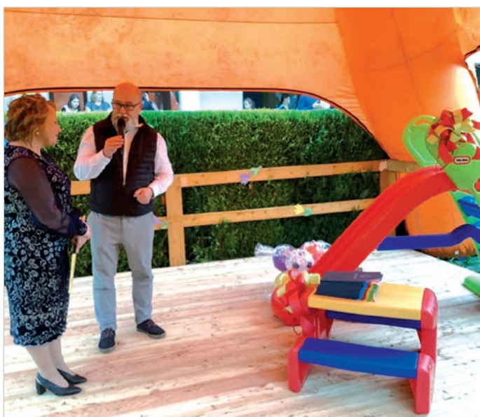
Burmistrz odchodzącej dyrektorki przekazał nowe zabawki dla żłobka.