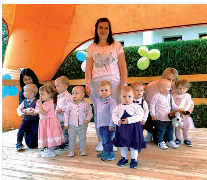
Przed publicznością ochoczo wystąpili najmłodsi.