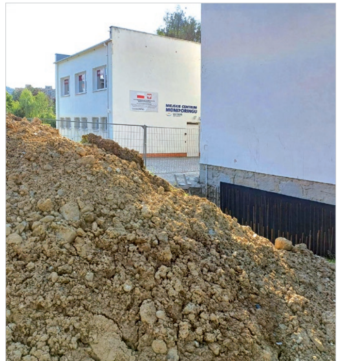
W tym miejscu stanie winda.