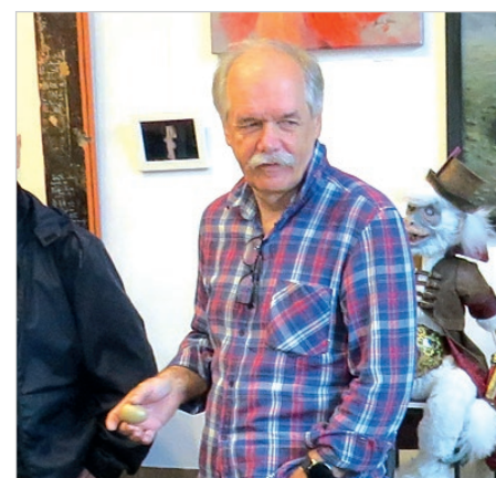
...a większość dokumentacji filmowej z przebiegu spotkań z artystami wykonał Wojciech Piechocki, znany fotografik, który nieraz wspomaga redakcję fotografiami.