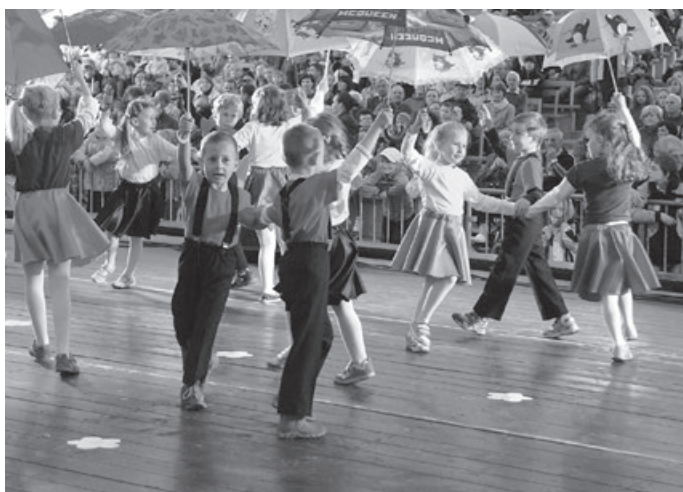
Nie taki dawny Ustroń, 2013 r.