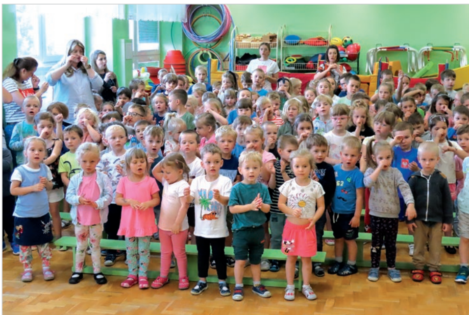
Od 1 do 7 czerwca trwał w naszym kraju XXII Ogólnopolski Tydzień Czytania Dzieciom, zainicjowany przez Fundację ABCXXI „Cała Polska czyta dzieciom”. Słuchały m.in. dzieci z Przedszkola nr 7. Więcej na str. 12.

Nr 24 (1627) • 22 czerwca 2023 r. • 3,00 zł (w tym 5% Vat) • ISSN 1231-9651