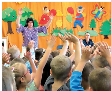
Piosenka o czytaniu.