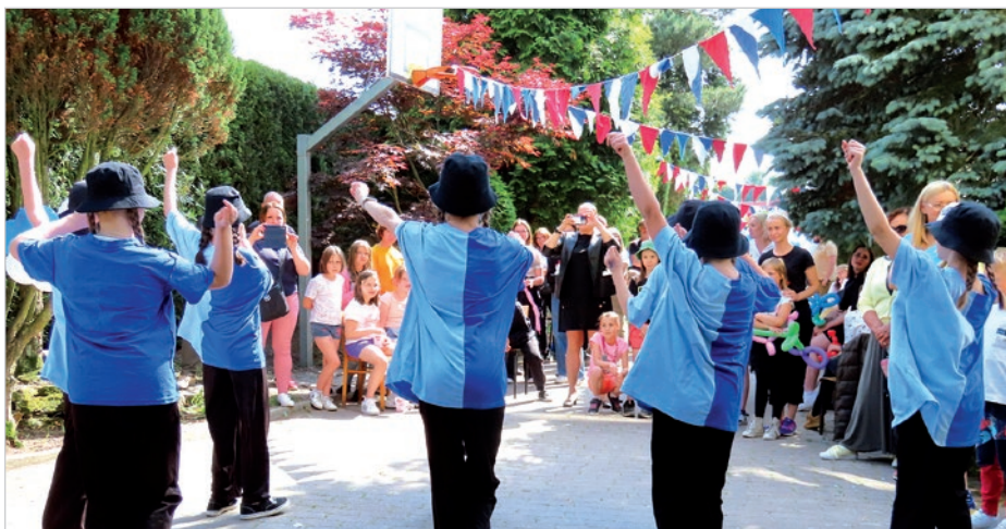
Stowarzyszenie SOS Wioski dziecięce jest obecne w Ustroniu od 18 lat.