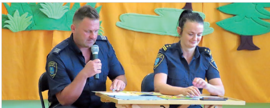
Strażnicy zasłużyli na oklaski.