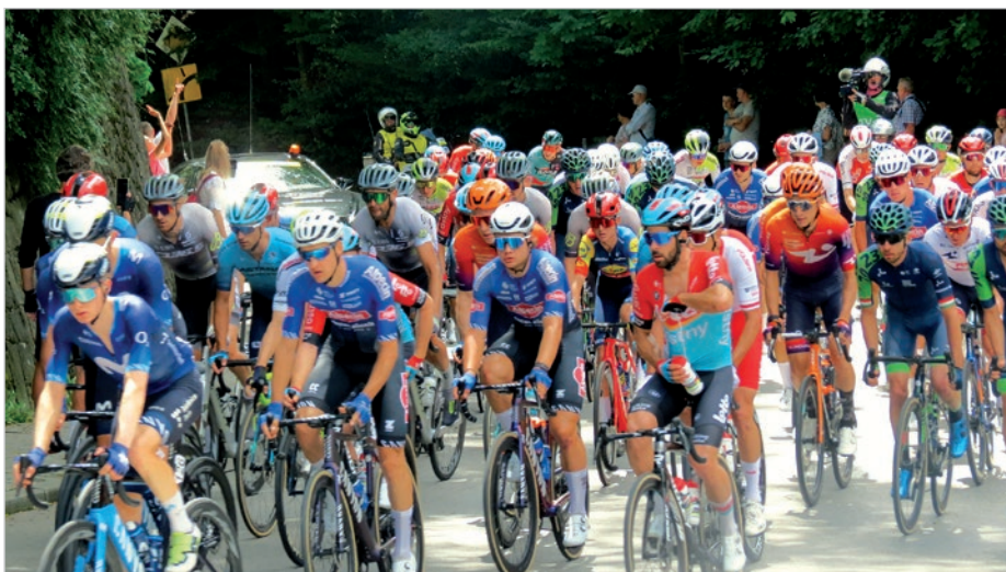
Kibicowali ustroniacy, turyści i kuracjusze. Część z nich przyjechała do Ustronia specjalnie na Tour de Pologne.