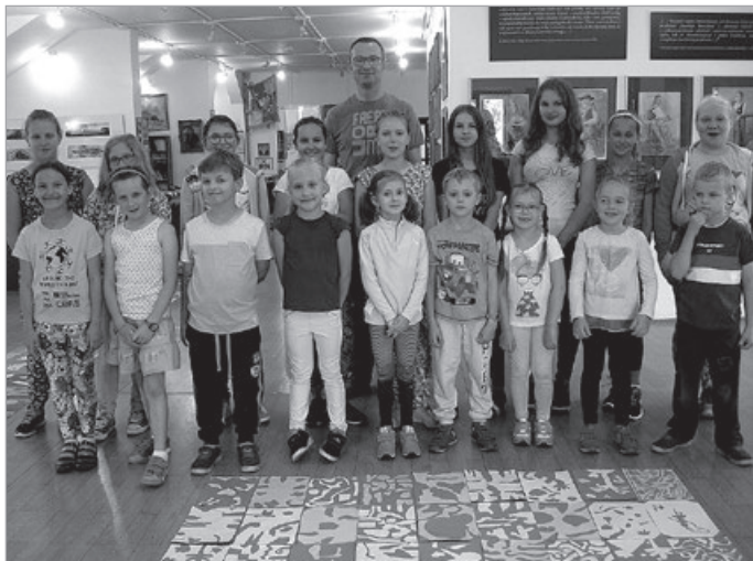
Nie taki dawny Ustroń, 2016 r.