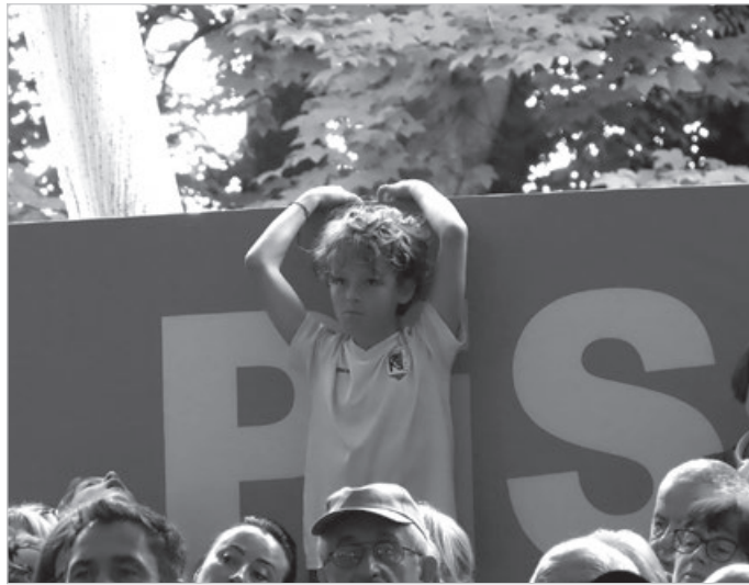
Pomiędzy prawem a sprawiedliwością.