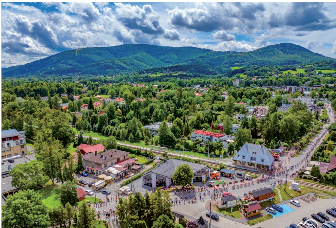
Tour de Pologne na ul. Grażyńskiego.