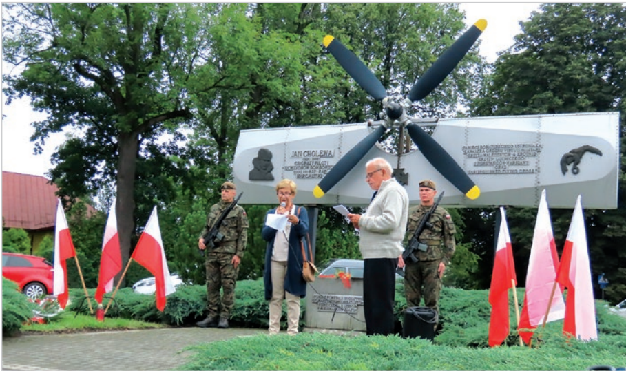
Zbiórkę prowadził Karol Brudny, wiersz przeczytała Krystyna Kukla.