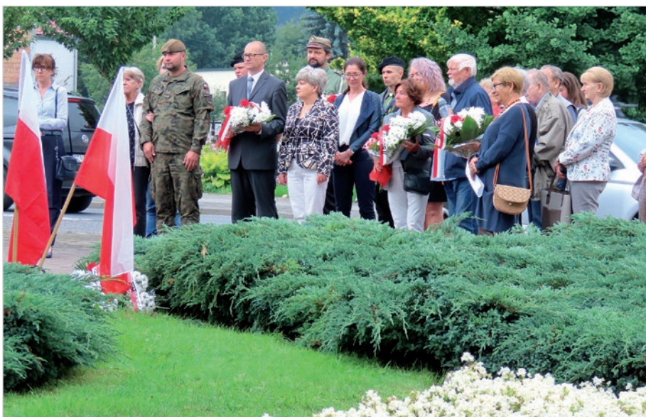
W czasie uroczystości złożono kwiaty pod pomnikiem.