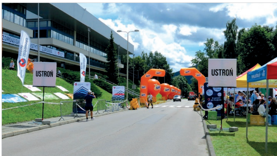
Obok bramy Premii Lotnej powstało miasteczko rowerowe. Dzieci mogły korzystać m.in. z pumtrucku.