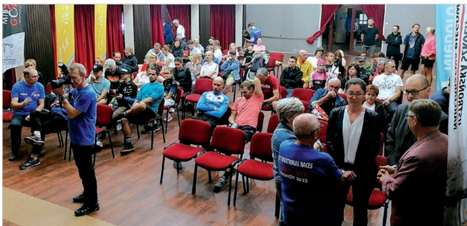
Sportowcy razem z przyjaciółmi zakończyli cykl Uphill MTB Beskidy `2023.