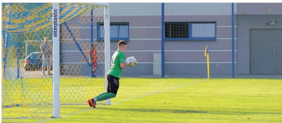
W trzech meczach Kuźnia straciła 6 bramek, ale nie tym razem.