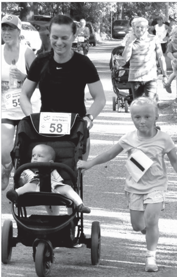
Bieg na trzech kołach.