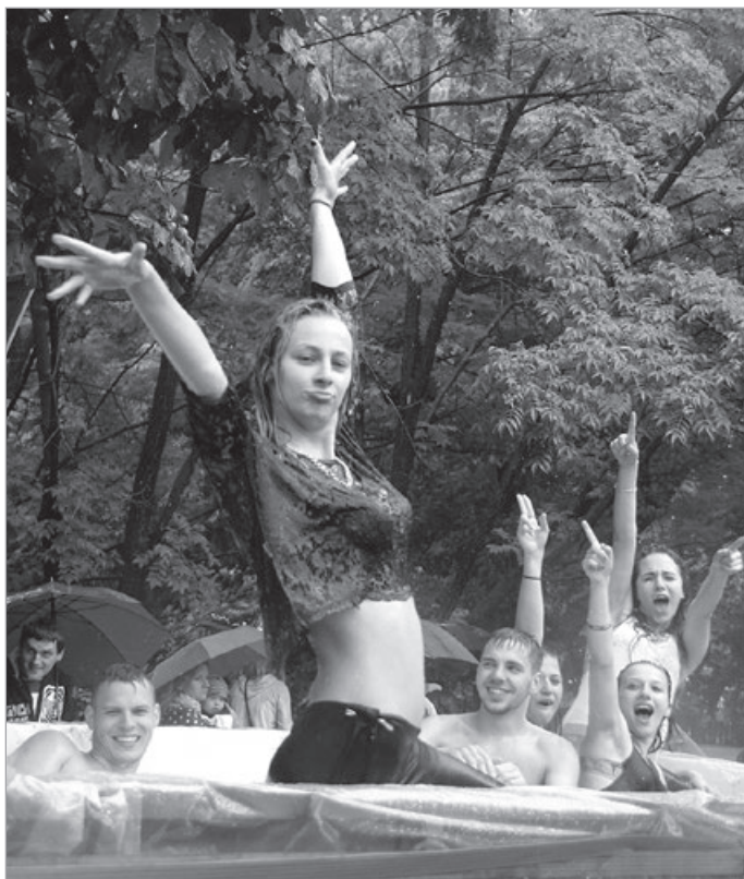
Nie taki dawny Ustroń, 2014 r.