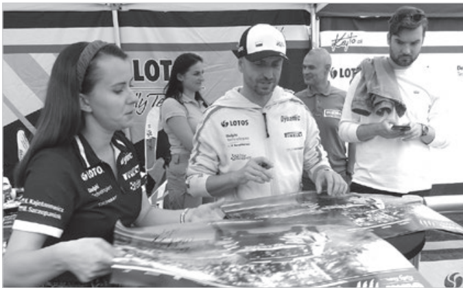
Kajetan Kajetanowicz spotka się ze swoimi fanami.