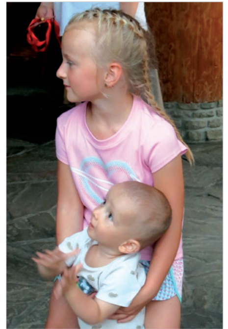
Na wszystkich czekał smaczny posiłek.

Każdy biorący udział w biegu otrzymał pamiątkową koszulkę w kolorze butelkowej zieleni. Oprócz tego wręczono nagrody dla najmłodszej, najstarszej, najszybszej pary. Skromna ceremonia odbyła się w Karczmie Wrzos. Tam można było posilić się zupą pomidorową bądź gulaszową, a starsi mogli posmakować piwa z miejscowego browaru.