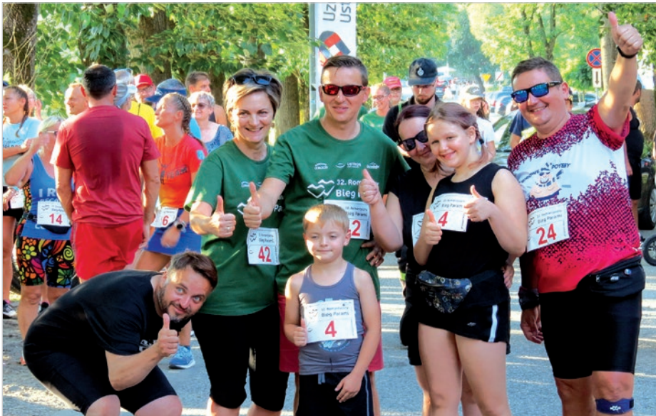
Nie tylko szachy łączą pokolenia.