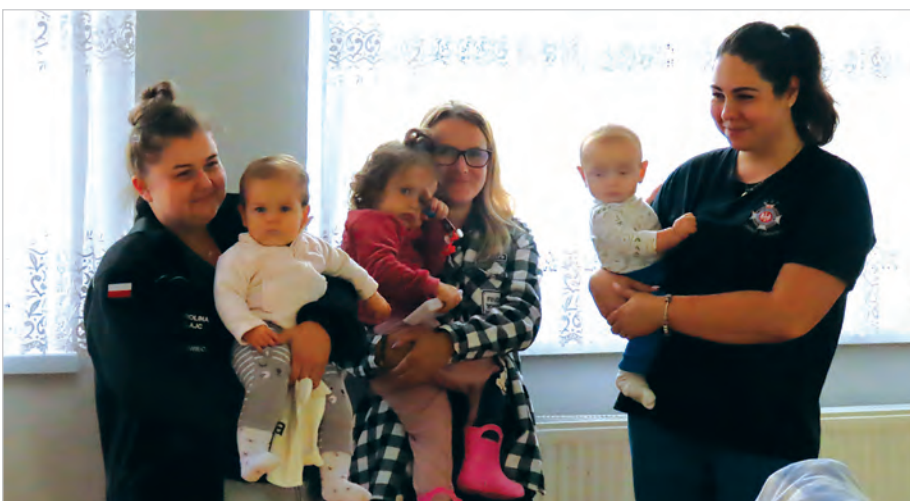
Żeby spełnić swój obywatelski obowiązek, na zebranie przyszły nawet mamy z dziećmi.

Miasta. Po takiej akcji burmistrz zwoła zebranie wyborcze, trzeba jednak pamiętać, że na nim też musi się pojawić 3% mieszkańców. Są w naszym mieście dzielnice, w których nie ma zarządów – Ustronń Górny, Ustronń Dolny, Ustronń Centrum, z czego można wnioskować, że ich mieszkańcom wystarczy działalność radnych.