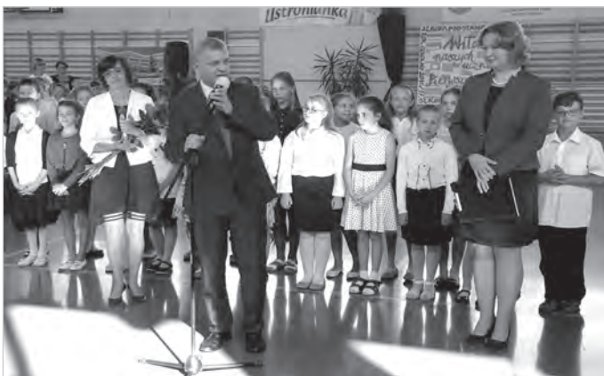
Nie taki dawny Ustroń, 2016 r.

Zapraszamy do zakupu cyfrowego wydania Gazety Ustrońskiej, które kosztuje 2 zł za numer. Czytelnicy, którzy zdecydowali się na tę formę lektury, znajdują kolejne numery w swojej skrzynce mailowej w czwartek z samego rana. E-gazeta może być też świetnym prezentem dla kogoś bliskiego, kto wyjechał za granicę np. do pracy. Aby kupić cyfrową Gazetę Ustrońską (10 numerów za 20 zł) wystarczy wysłać maila do redakcji: gazeta@ustron.pl