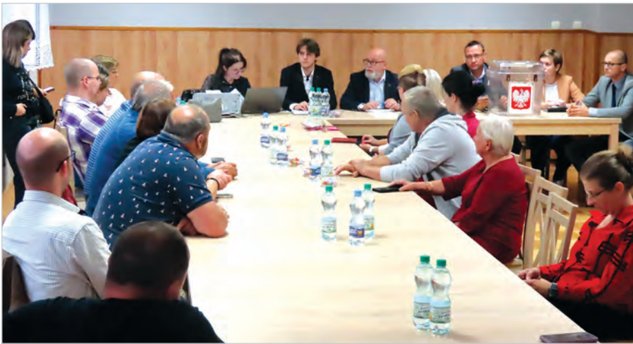
Mieszkańcy słuchali informacji o działaniach miasta na terenie Lipowca.