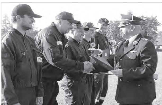
Nie taki dawny Ustroń, 2017 r.

Zapraszamy do zakupu cyfrowego wydania Gazety Ustrońskiej, które kosztuje 2 zł za numer. Czytelnicy, którzy zdecydowali się na tę formę lektury, znajdują kolejne numery w swojej skrzynce mailowej w czwartek z samego rana. E-gazeta może być też świetnym prezentem dla kogoś bliskiego, kto wyjechał za granicę np. do pracy. Aby kupić cyfrową Gazetę Ustrońską (10 numerów za 20 zł) wystarczy wysłać maila do redakcji: gazeta@ustron.pl