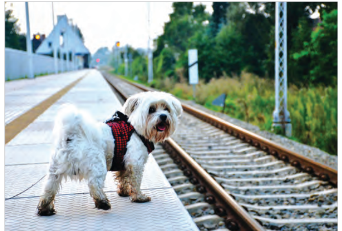
III miejsce Mateusz Lipowczan.