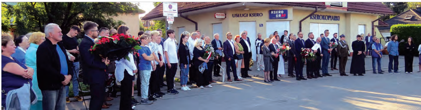
Od 10 lat uroczystość skupia przedstawicieli władz ogólnopolskich, wojewódzkich, powiatowych i lokalnych oraz społeczność Ustronia wraz z delegacjami młodzieży szkolnej.