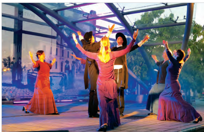
Żydowski zespół „Klezmer” z Cieszyna zawsze potrafi zauroczyć dynamiką i niezwykłą obrzędowością.