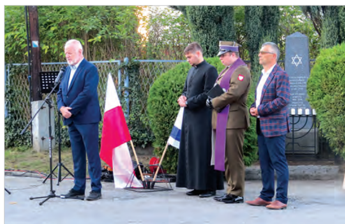
Stałym punktem programu są modlitwy ekumeniczne.