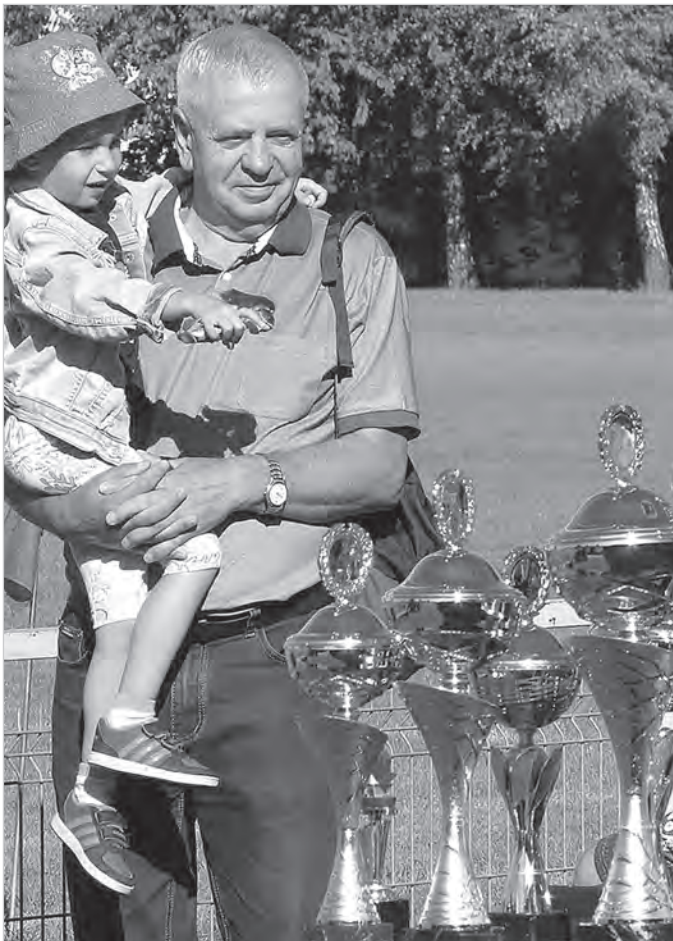
Może też taki zdobędę.