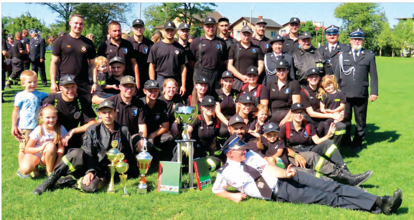
Puchary już się powoli nie mieszczą w strażnicy OSP Lipowiec. Po sobotnich zawodach staną w niej 4 nowe. Więcej na str. 9.

W numerze m.in.: Najważniejsze jest bezpieczeństwo dzieci - mówi wiceburmistrz Sitek, Kradzież zniszczy jest przestępstwem , Wspomnienie Franciszka Pasternego, Święto trąb w cieniu synagogi , Taaaka ryba, Laureaci konkursu „Zwierzki na wywczasie” .