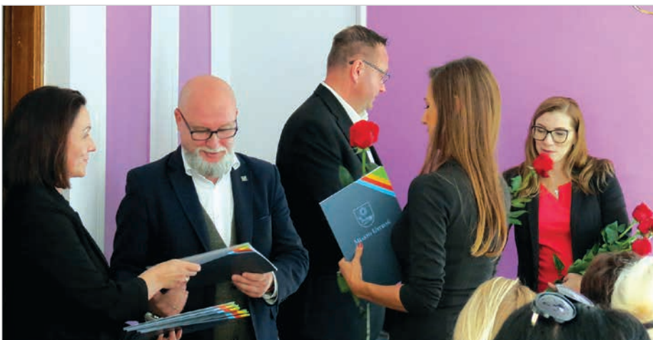
Gratulacje i wyróżnienia dla aktywnych zawodowo nauczycieli.