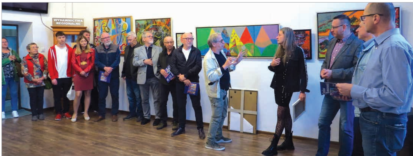
Obecność artysty na werniszażu, co w galerii „Rynek” jest regułą, zawsze ułatwia odbiór prezentowanej sztuki, bo autor obrazów często przedstawia swój malarski warsztat.