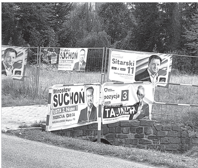
A teraz czas posprzątać.