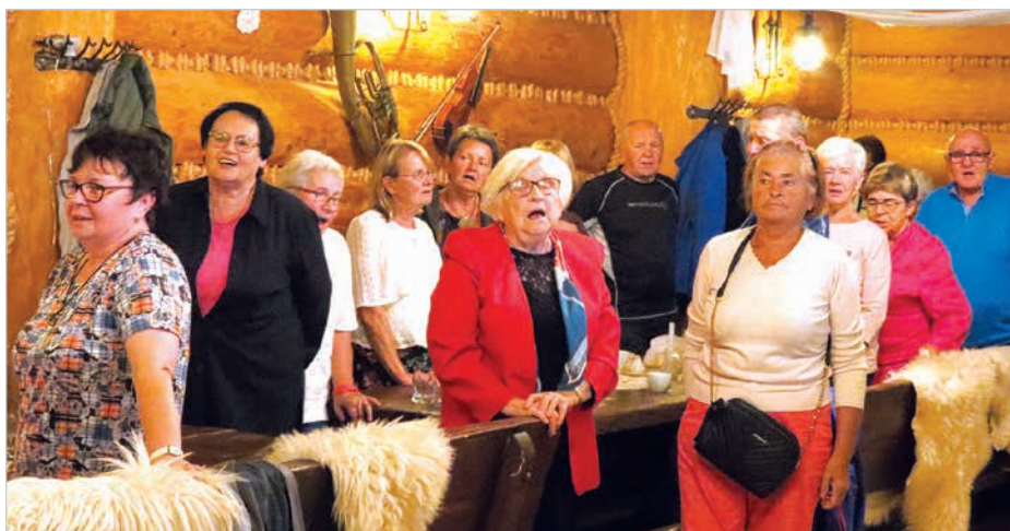
Seniorzy z Kalet wrócili do domu z miłymi wspomnieniami.