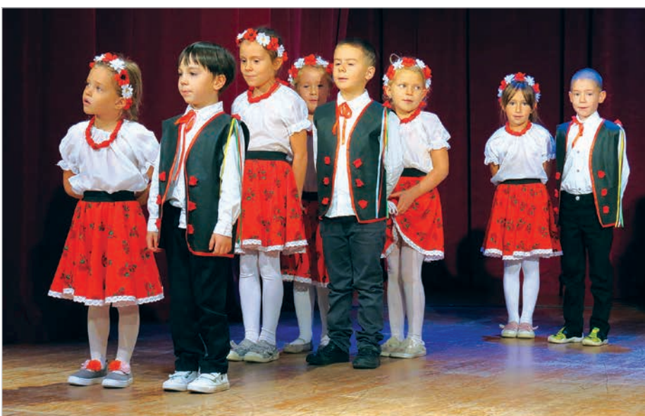
Dla zasłużonych nauczycieli wystąpiły przedszkolaki.