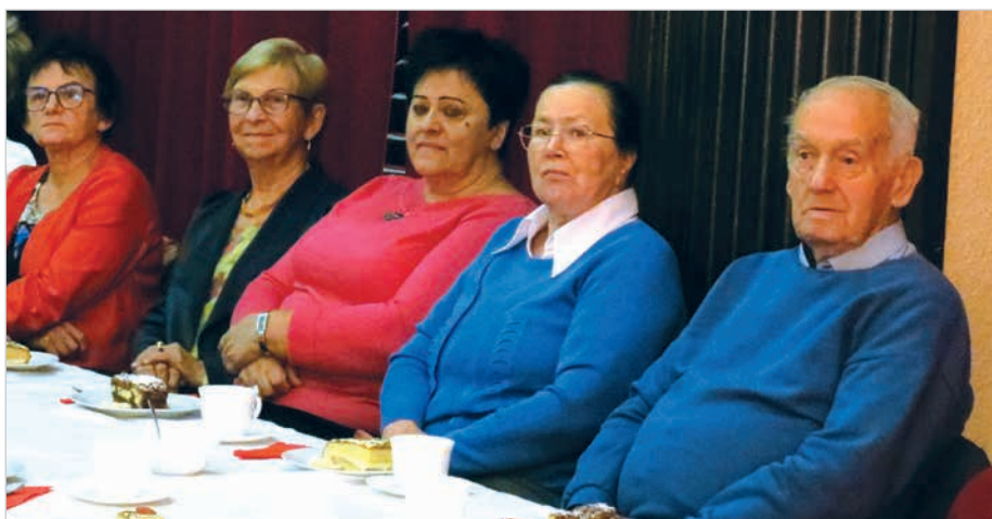
Na uroczystości w Prażakówce obecni byli emerytowani nauczyciele.