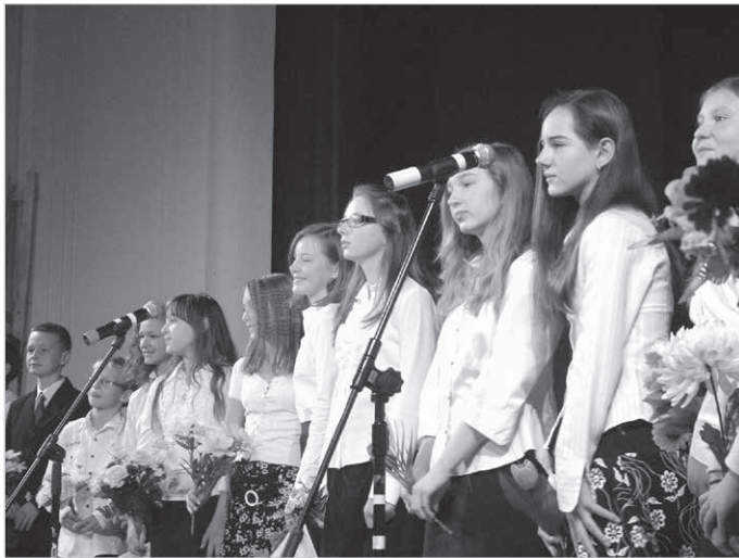
Nie taki dawny Ustroń, 2010 r.