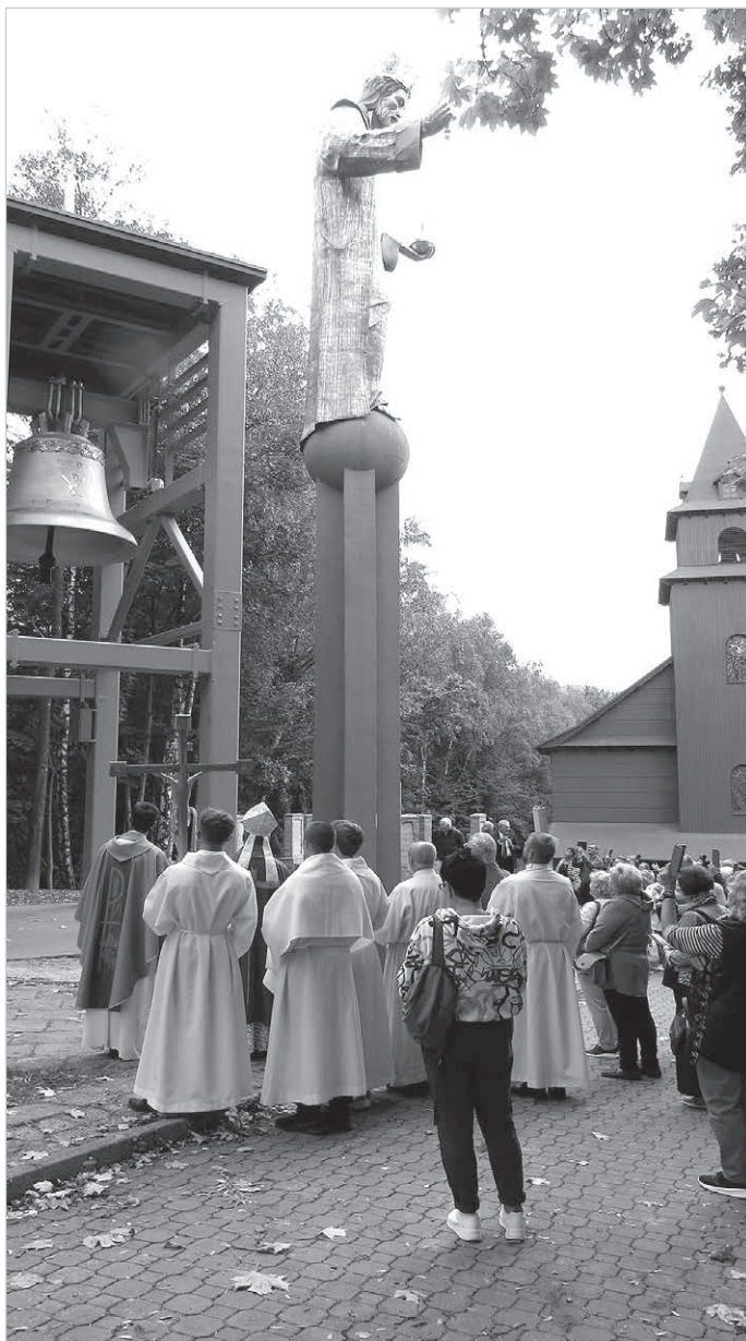
Wierni licznie uczestniczyli w uroczystości poświęcenia nowego dzwonu.