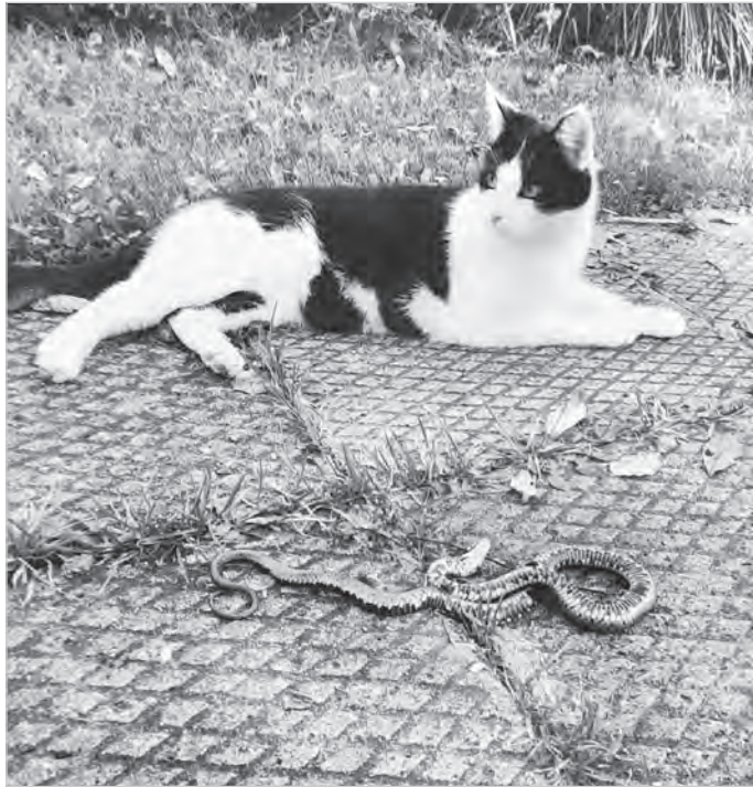
Oto wyjątkowy ustronński łowca, dumnie prezentuje swoją zdobycz.