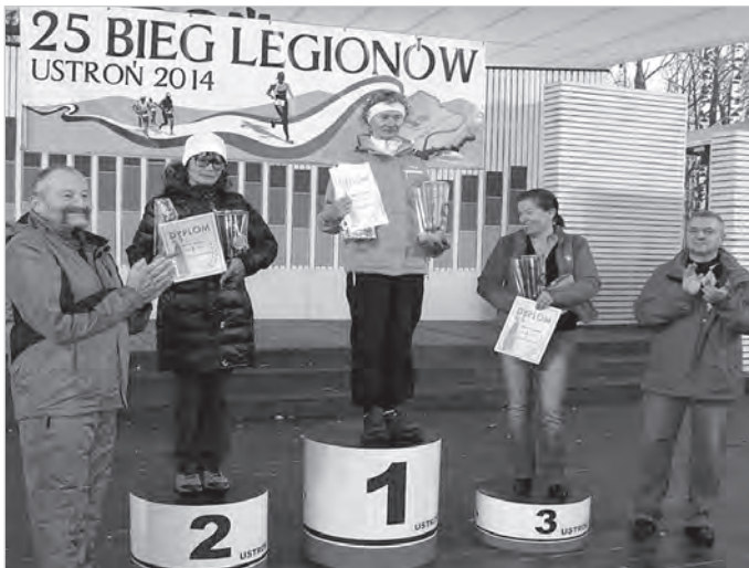
Nie taki dawny Ustroń, 2014 r.