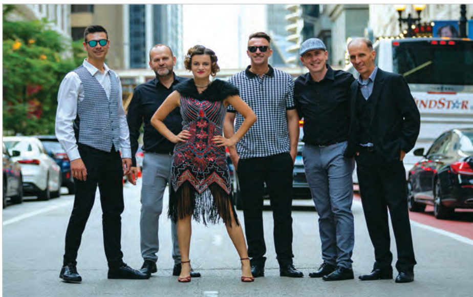
Na trasie koncertowej w Stanach Zjednoczonych z zespołem Holeviaters.