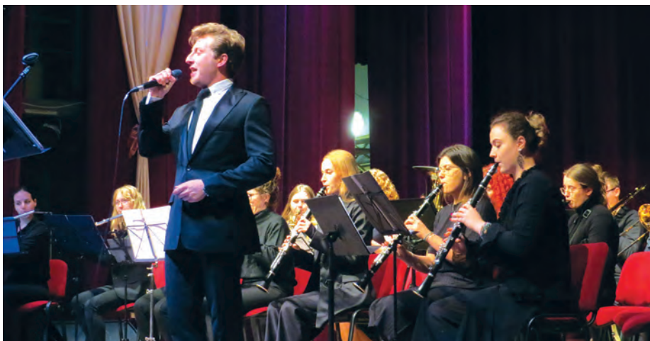
Orkiestra była znakomita, a soliści jeszcze bardziej urozmaicali koncert.

prezentował każdą kompozycję, co stanowiło kolejny atut tego pięknego koncertu.