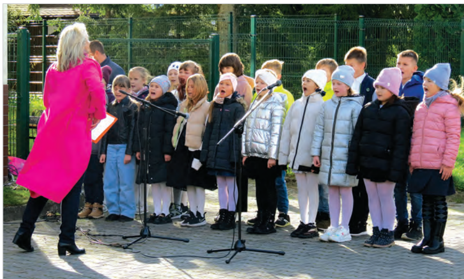
Uroczystość uświetnił śpiew uczniów szkoły nr 1.

Burmistrz powiedział przy tej okazji: – Spotykamy się tutaj, aby przypomnieć