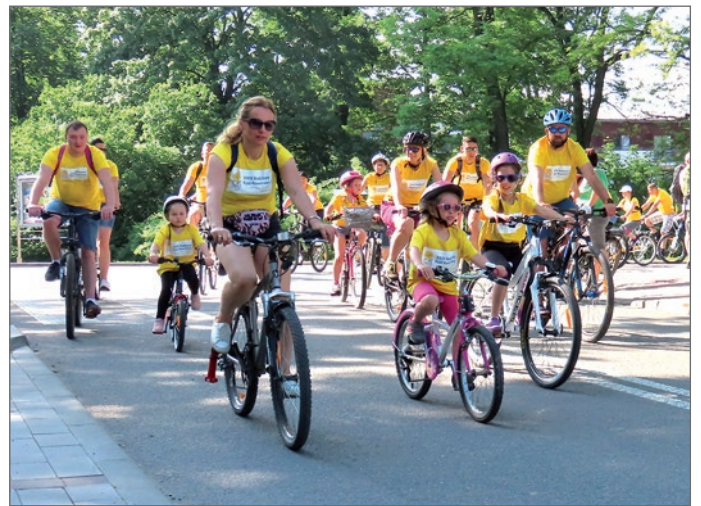
W Rajdzie biorą udział całe rodziny.