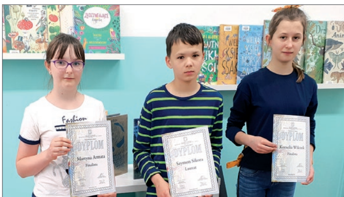
Uczniowie ze Szkoły Podstawowej nr 6 w Ustroniu.