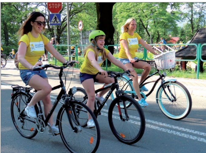
Najmłodzi mają zawsze najwięcej uciechy.