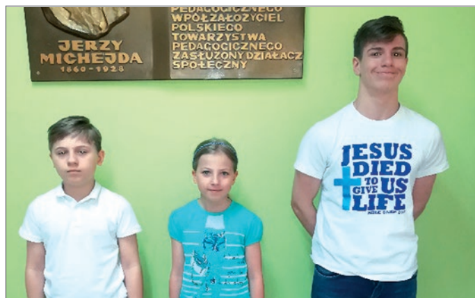
Uczniowie ze Szkoły Podstawowej nr 2 w Ustroniu.