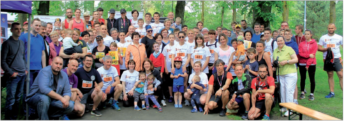
Po oficjalnym rozdaniu medali wszyscy zapozowali do wspólnego zdjęcia.