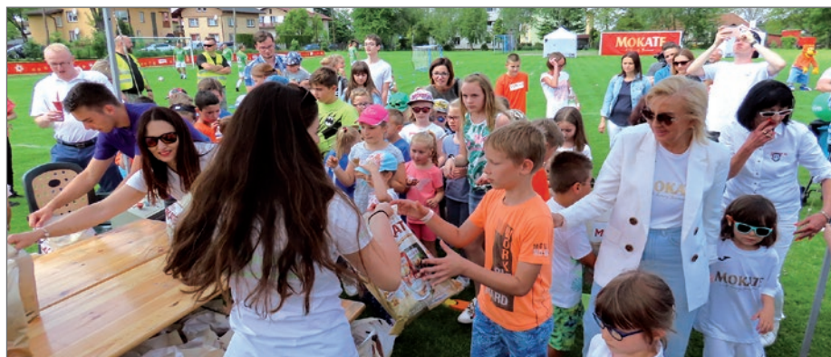
Dzieci wręczały mamom prezenty przygotowane przez firmę.

Zanim zabawa rozpoczęła się na dobre poproszono wszystkie dzieci, by wręczyły swoim mamom prezenty przygotowane przez firmę. Następnie rozpoczął się mecz młodych piłkarzy, a doping kibiców,