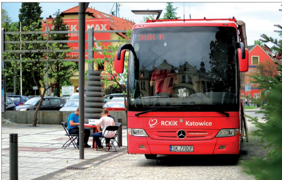
Placówka na kółkach nie tylko służy szczytnemu celowi, ale i pięknie się prezentuje.