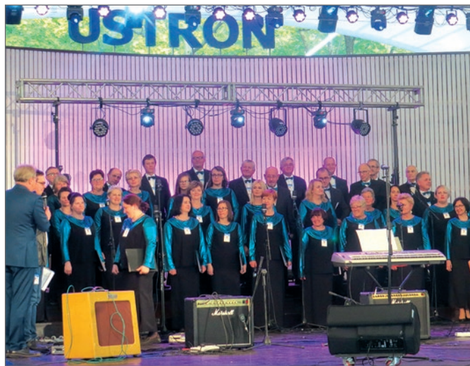
Hymn liturgiczny „Akatyst” wykonał chór „Canticum Novum”.