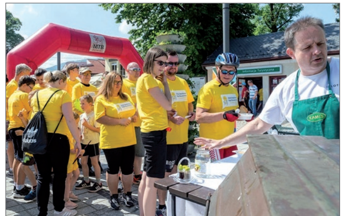
Posiłek regeneracyjny na mecie.