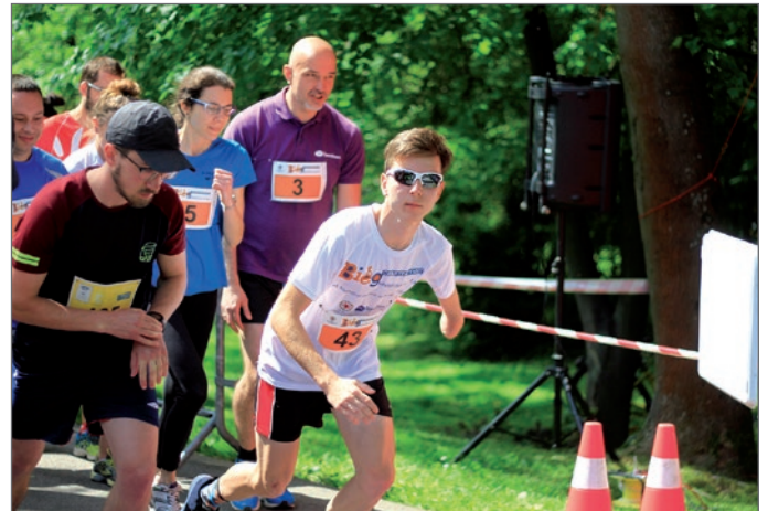
Uczestnicy biegu niezależnie od wieku i sprawności fizycznej wspierali szlachetny cel.