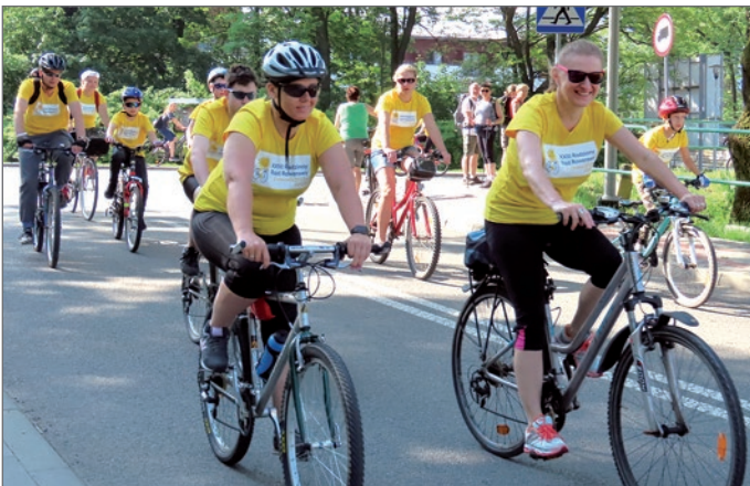
Wjazd z ul. Grażyńskiego na ul. Sportową.

Po przyjeździe na rynek rajdowcy dostali wodę i grochówkę. Odbyło się też tradycyjne losowanie akcesoriów rowerowych i roweru, który otrzymała mieszkanka Ustronia. Rodzinnemu Rajdowi Rowerowemu, organizowanemu przez Wydział Promocji, Kultury Sportu i Turystyki Urzędu Miasta Ustron towarzyszyła impreza „Jedź z głową”, podczas której sprawdzano znajomość zasad ruchu drogowego, umiejętności kolarskie. Atrakcją była możliwość doświadczenia, jak to jest podczas dachowania samochodu. Dzieci brały udział w wielu konkursach zręcznościowych i plastycznych, dla laureatów przygotowano nagrody. (mn)