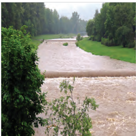
Wisła z mostu na ul. Grażyńskiego.

Trudna sytuacja była też na terenie powiatu cieszyńskiego, gdzie do godz. 14 zalanych zostało 175 budynków, 19 dróg, zatkanych 7 przepustów. Miały miejsce 42 inne zdarzenia takie jak zalane pola, pożar skrzynki na wieży ratusza, wypadki, kolizje, powalone drzewa, konary, itp. Główne działania związane z silnymi opadami deszczu były prowadzone w Skoczowie, Górkach, Ustroniu i Goleszowie. Po południu przestało padać. (mn)