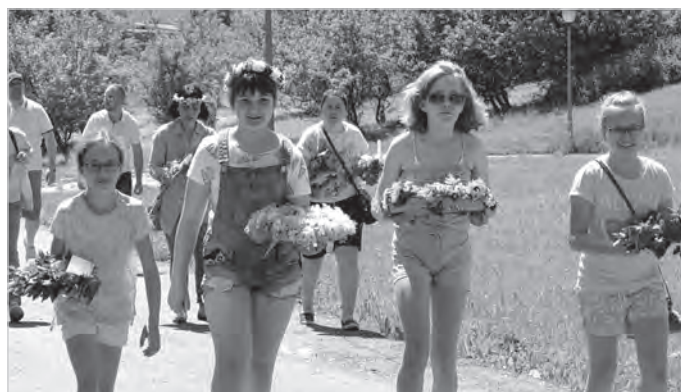
Nie taki dawny Ustroń, 2017 r.