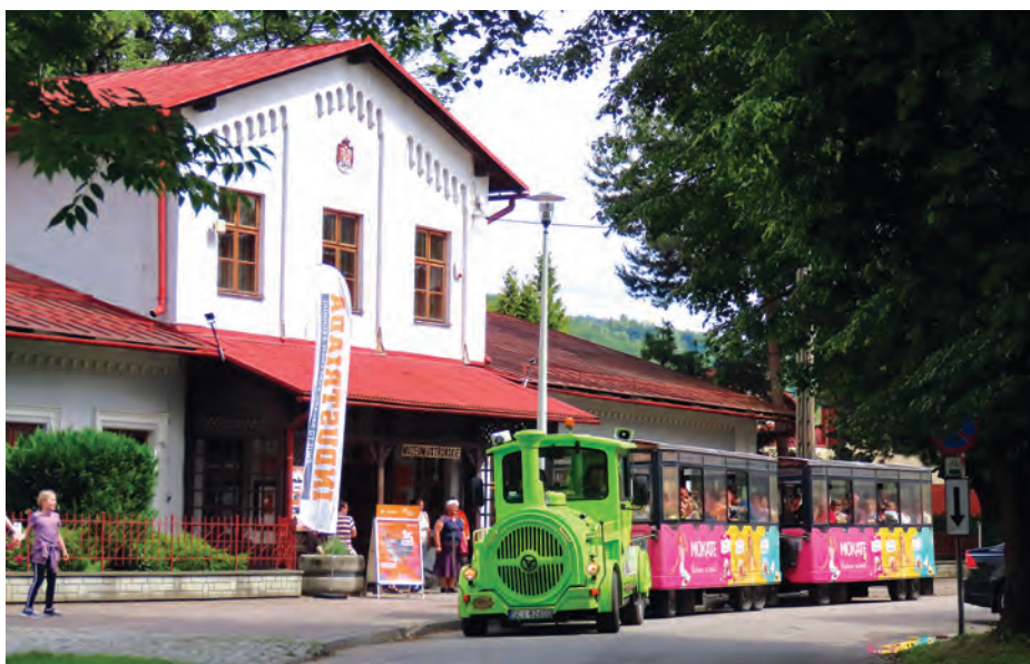
Największą atrakcją była historyczna wycieczka Ciuchcią.