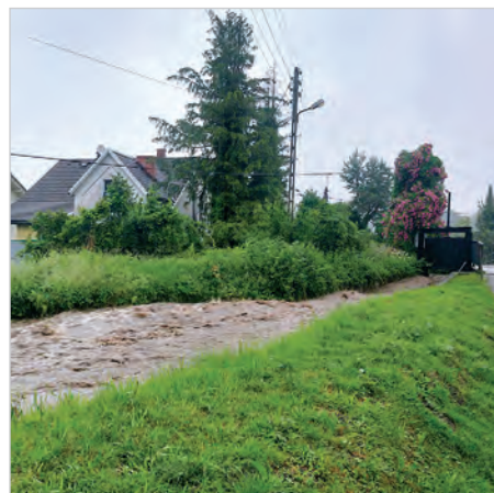
Młynówka przy ul. Polnej.