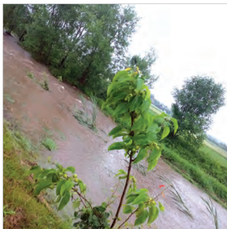
Bładnica przy ul. Bładnickiej