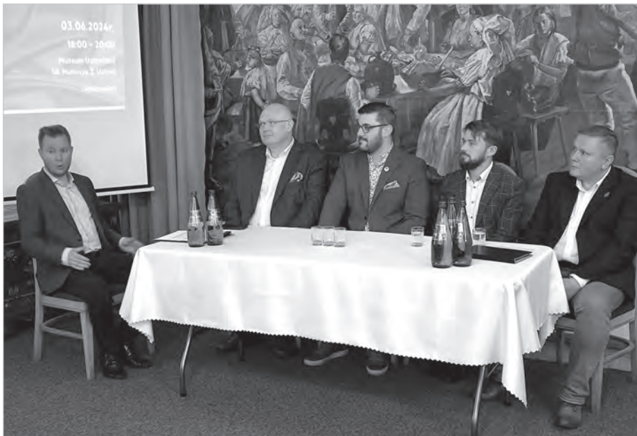
Spotkanie odbyło się w Muzeum Ustrońskim.