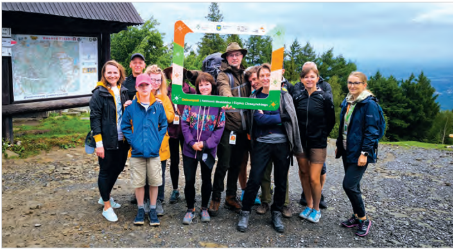
Pierwsi uczestnicy Festiwalu Dziewięciśli w drodze na leśną kąpiel.