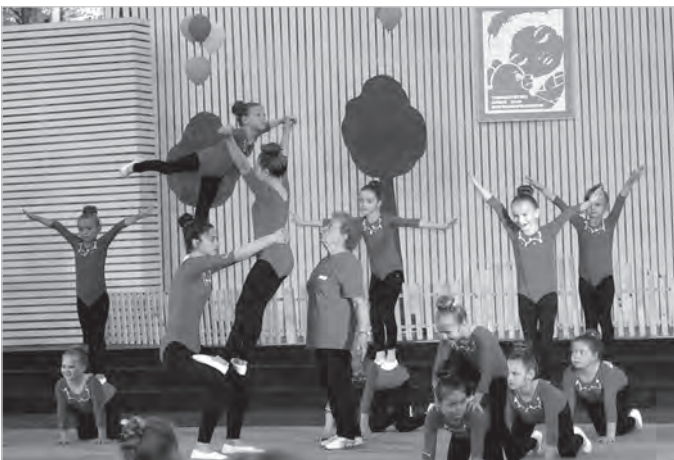
Nie taki dawny Ustróń, 2016 r.