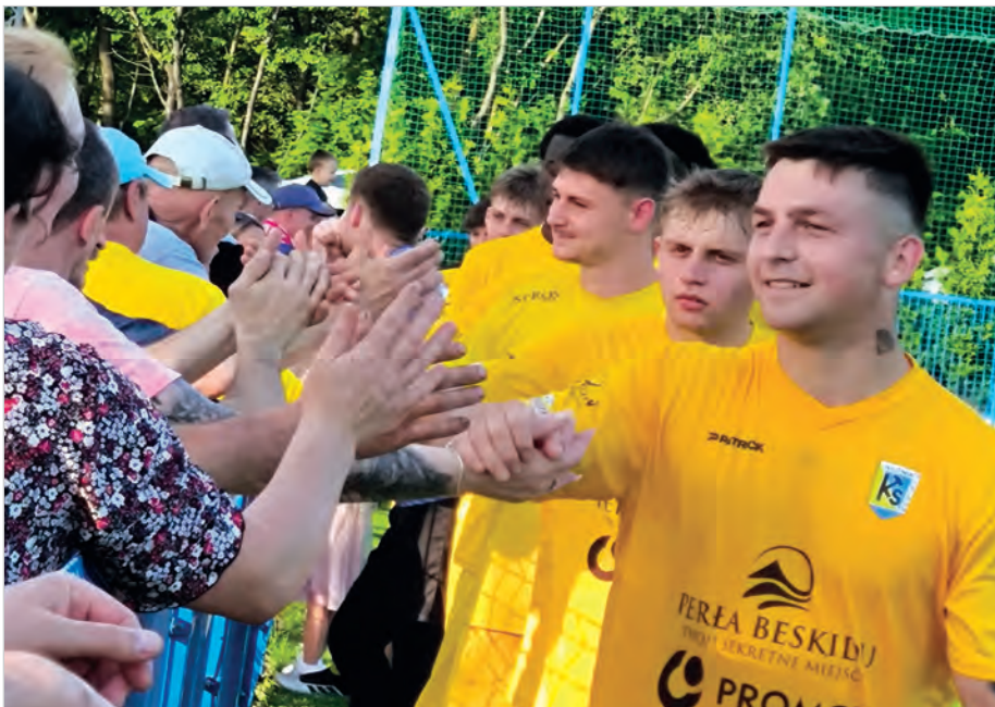
Piłkarze podziękowali za sezon kibicom.