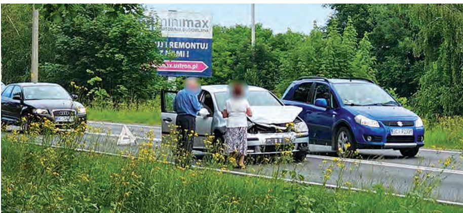
9 czerwca na DW941 na pasie w kierunku Wisły miało miejsce zderzenie dwóch pojazdów. Stało się to przed skrzyżowaniem z ul. Akacją.