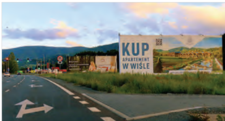
Reklamy przy dwupasmówce.