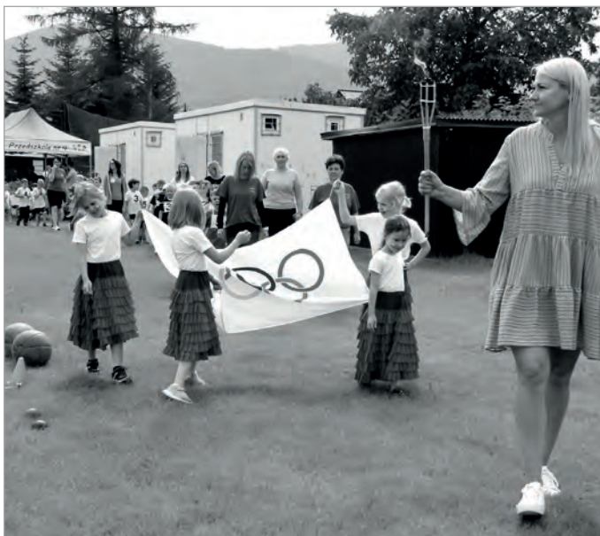
W Rzymie Mistrzostwa Europy, a w Hermanicach Olimpiada Przed- szkoli. Więcej zdjęć na Facebooku, a wyniki w następnym numerze Gazety Ustrońskiej.