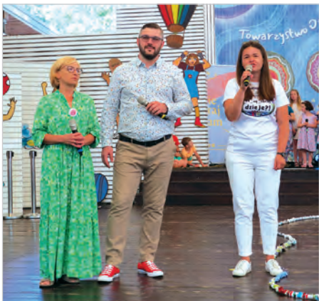
Dyrektor Prażakówki, burmistrz Ustronia i prezes TONN.