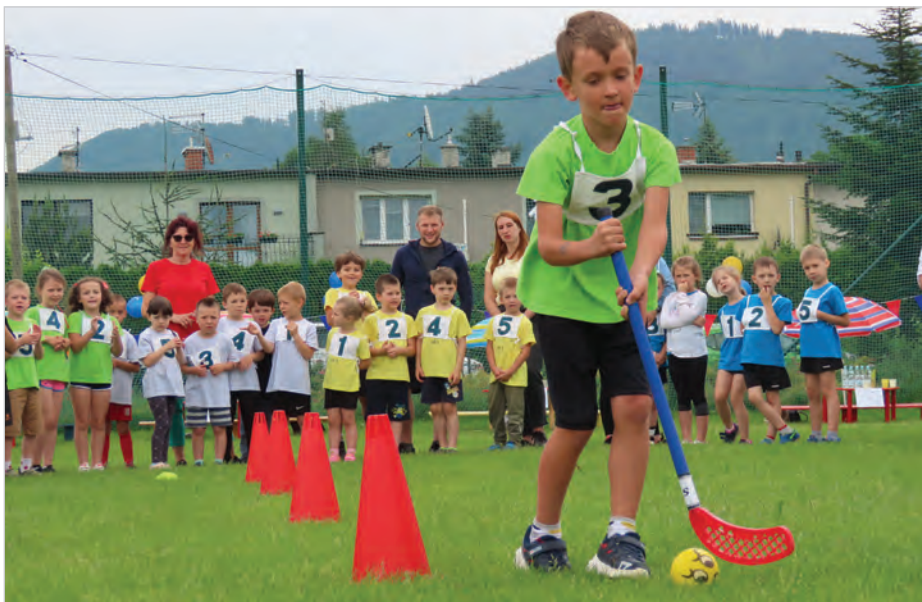
Kibicowano wszystkim, niezależnie z której drużyny.