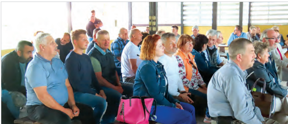
Mieszkańcy jak zawsze przybyli licznie.