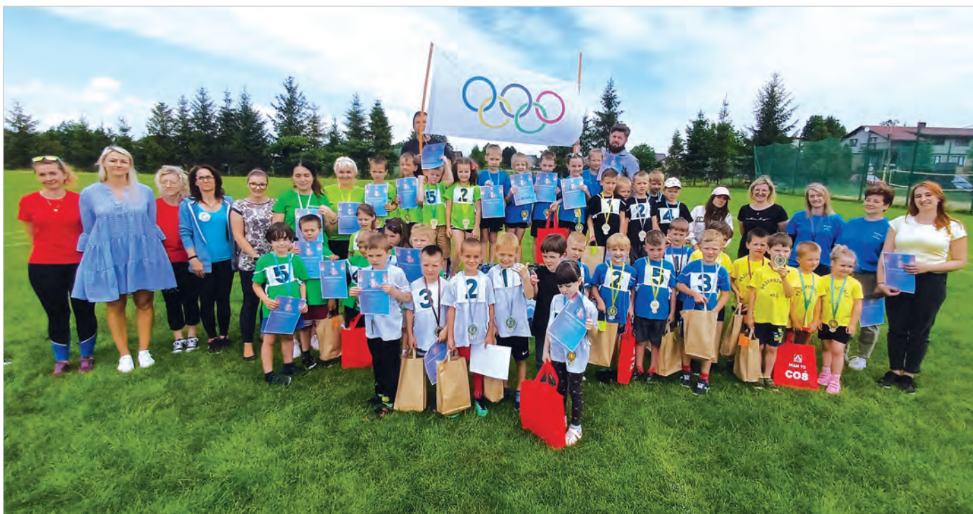
Uczestnicy Olimpiady Przedszkolnej na boisku w Hermanicach. Wyniki i informacje na str. 17.

W numerze m.in.: Absolwenci Roku 2023/2024 oraz Sportowcy i Sportsmenki Roku, Rzeźby z Parku Kuracyjnego dostaną drugie życie, Charytatywny Główny Szlak Beskidzki, Mieszkańcy o uchwale krajobrazowej , Mistrzostwa Europy na Rynku.