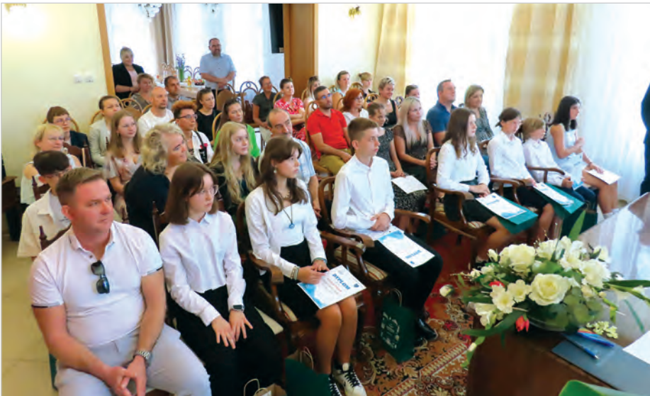
Uczniom towarzyszyli rodzice i dyrektorzy szkół.