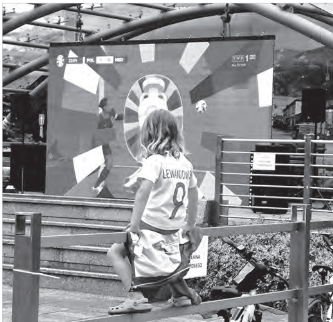
Lewandowski jest wszędzie.