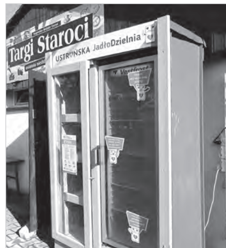
Ustronńska Jadalnia stanęła na targowisku.

króciutko zasady korzystania są proste: „Dziel się i częstuj”: przynosimy produkty, których mamy nadwyżkę np. planujemy wyjazd, lub po prostu nie możemy ich zagospodarować. Najważniejsze, że to produkty dobre i świeże w przypadku pieczywa czy owoców i warzyw, lub w nienaruszonych opakowaniach w przypadku towarów zamkniętych. W skrócie – to produkty, które sami byśmy zjedli. Surowe mięso, alkohol, czy produkty z niepasteryzowanego mleka NIE są akceptowane ze względów bezpieczeństwa. Jadalnia to inicjatywa Stowarzyszenia Ustroń – Nasz Dom, Nasze Miasto Informacje o jadalni pojawiają się w szkołach oraz na miejskich tablicach.