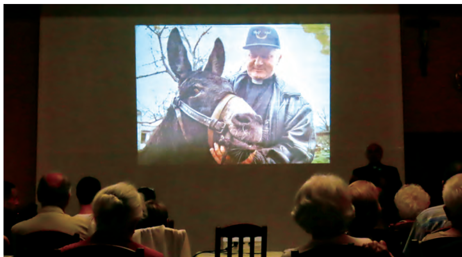
Na spotkaniu wspomniano również osiołka Pedro, o którym swego czasu zrobiło się głośno w mediach nie tylko lokalnych. Jest o nim też w książce, która powstała w wyjątkowym czasie. 11 kwietnia 2024 przypadłoby 50-lecie święceń kapłańskich Alojzego Wencepla, a 16 stycznia 2025 roku skończyłby 80 lat.