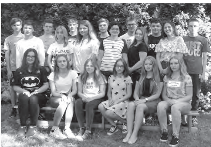
Nie taki dawny Ustroń, 2017 r.