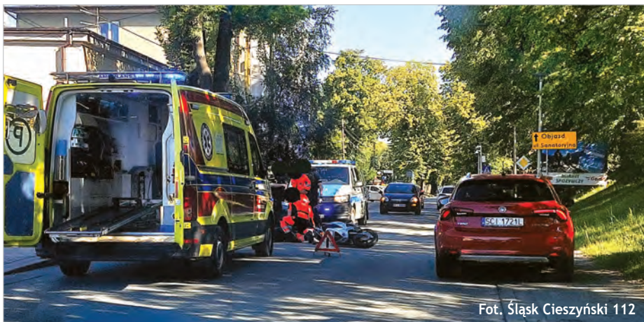
Fot. Śląsk Cieszyński 112

Zdecydowanie nie był trzeźwy mężczyzna zatrzymany przez policjantów na ul. Mickiewicza. W czwartkowe popołudnie policjanci z Ustronia otrzymali zgłoszenie dotyczące kierującego opłem, którego sposób prowadzenia pojazdu wskazywał,