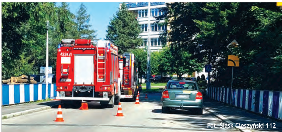
Fot. Śląsk Cieszyński 112