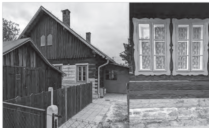
Odrestaurowane obiekty kolonii Stary Borek w Trzyńcu.