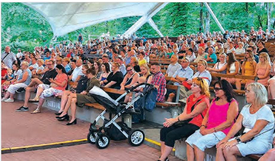
Na widowni zebrały się tłumy, które często dawały się porwać znanym sobie melodiom.