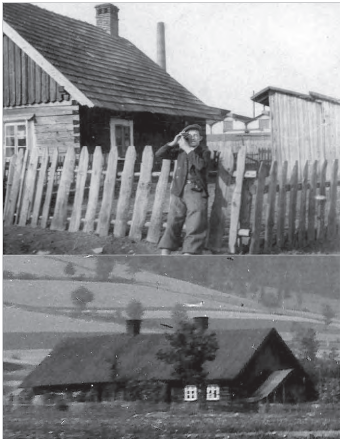
Nieistniejące już drewniane kolonie robotnicze w Ustroniu - u góry Frankreich, u dołu Poniwiec (fragmenty).