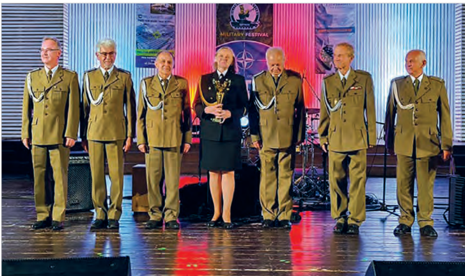
Grand Prix festiwalu zdobył zespół Przyptyw z Klubu 3 Flotyli Okrętów w Gdyni.

Po końcowych wynikach widać, że najwięcej muzycznych talentów znajduje się w tej chwili nad morzem. Dowódcy jednostek, z których pochodzą wygrani na pewno będą zadowoleni z sukcesów swoich żołnierzy. W przyszłym roku odbędzie się jubileuszowa 15. edycja, co zapowiedział już organizator tej świetnej tematycznej imprezy. Mateusz Bielez