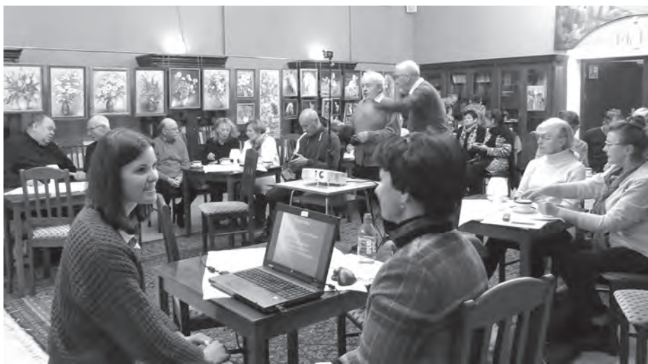
Prelegentki swoimi wykładami zainteresowały wszystkich uczestników.