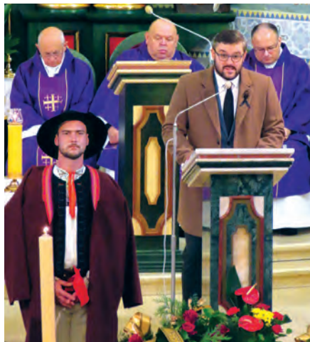
Przemówienie burmistrza Pawła Sztefka.