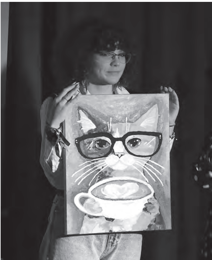
Kotek poszedł „pod młotek”.