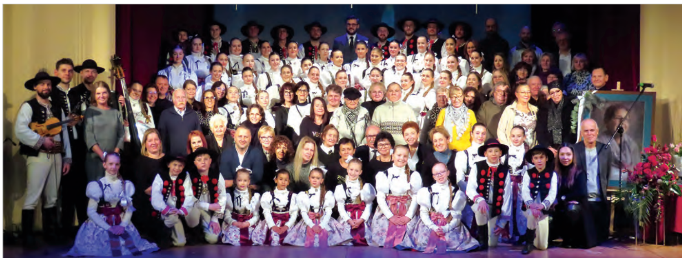
Uroczystość wspomnieniową zakończyło wspólne wykonanie pieśni „U stóp Czantorii” i pamiątkowe zdjęcie.