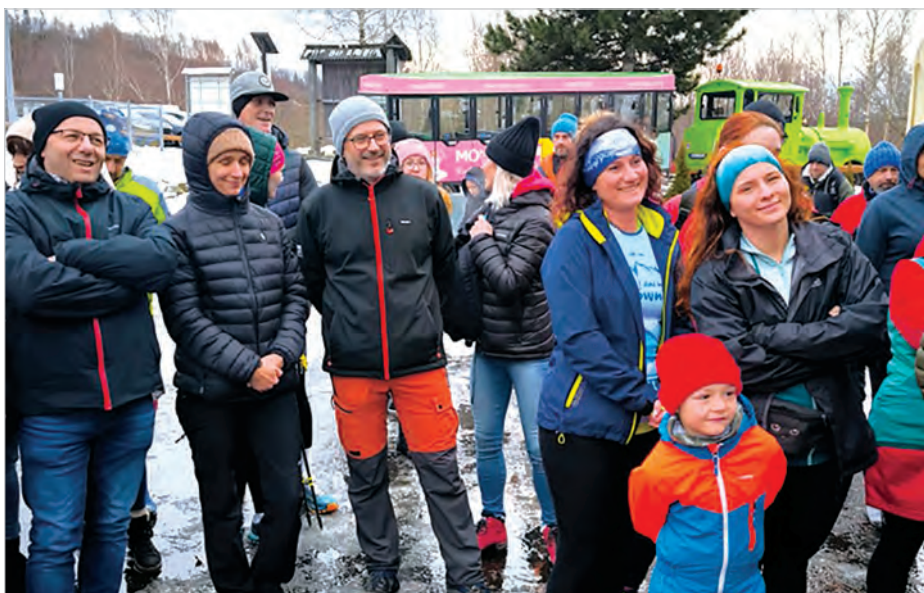
Mimo niesprzyjającej pogody, najaktywniejsi ponownie zjawili się pod Gościńcem Równica.