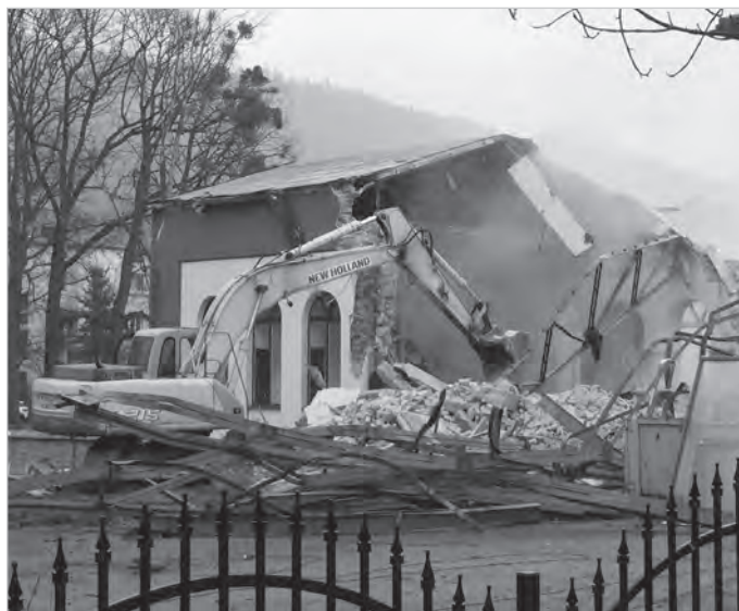
Prace wyburzeniowe Salonu Kuracyjnego, 10.12.2024 r.