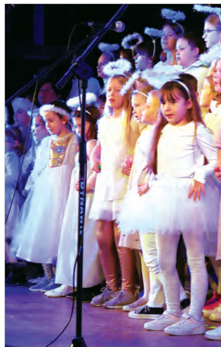
Wigilię Fundacji św. Antoniego uświetnił koncert zespołu „Bemolki” z SP-2.