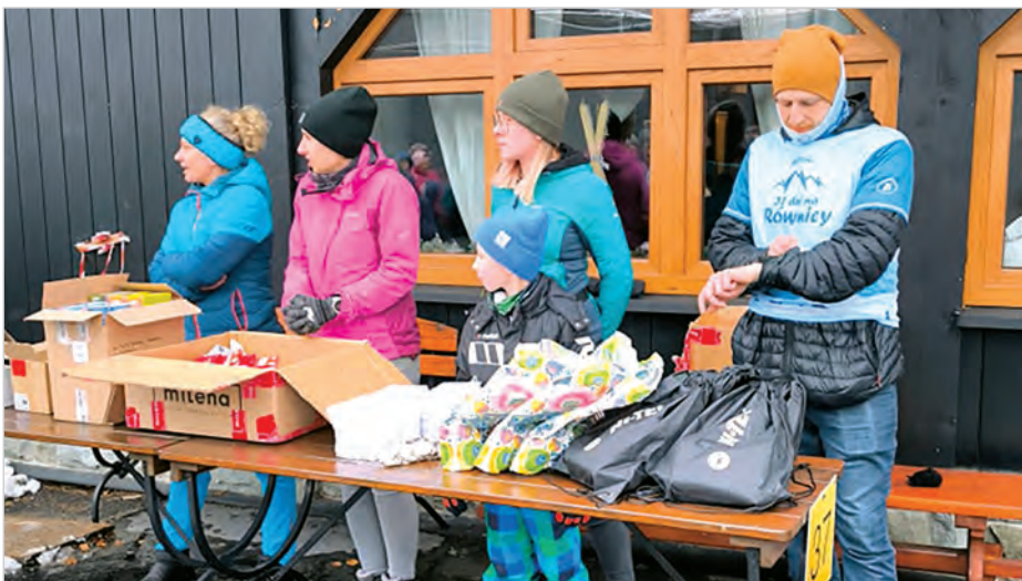
Odliczanie do rozpoczęcia uroczystego wręczenia nagród.

Wydarzenie z roku na rok zyskuje na popularności, promując zdrowy tryb życia i aktywność na świeżym powietrzu. Organizatorzy nie kryją radości z rosnącej frekwencji, a uczestnicy już nie mogą doczekać się kolejnej edycji. Można powiedzieć, że akcja „31 Dni na Równicy” stała się tradycją w kalendarzu górskich wyzwań. Mamy nadzieję, że kolejne edycje przyciągną jeszcze więcej pasjonatów! Gratulacje dla wszystkich uczestników i do zobaczenia na szlaku! Mateusz Bielez