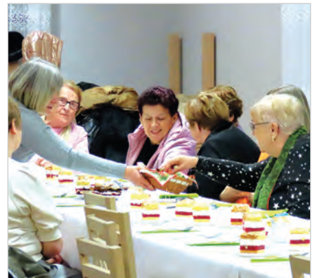
Urodzinowy poczęstunek.

Odpoczynek i rozrywki członkinie koła zapewniły sobie podczas wyjazdu do Rowów nad morzem, wycieczki na polskie Malediwy, na zamek Rabstyn i do Olkusza, podczas pobytu w Uście, biesiady w Pubie pod Beczką, wycieczki do Czech ze zwiedzaniem fabryki „Marlenka”, Frydka Mistka i parku etnograficznego.