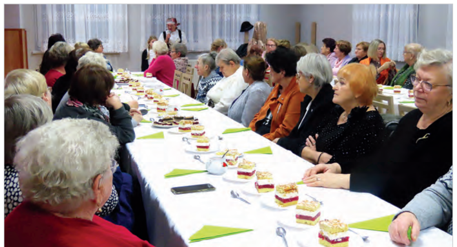
Na zebraniu panie wspominały wspólną pracę i zabawę.