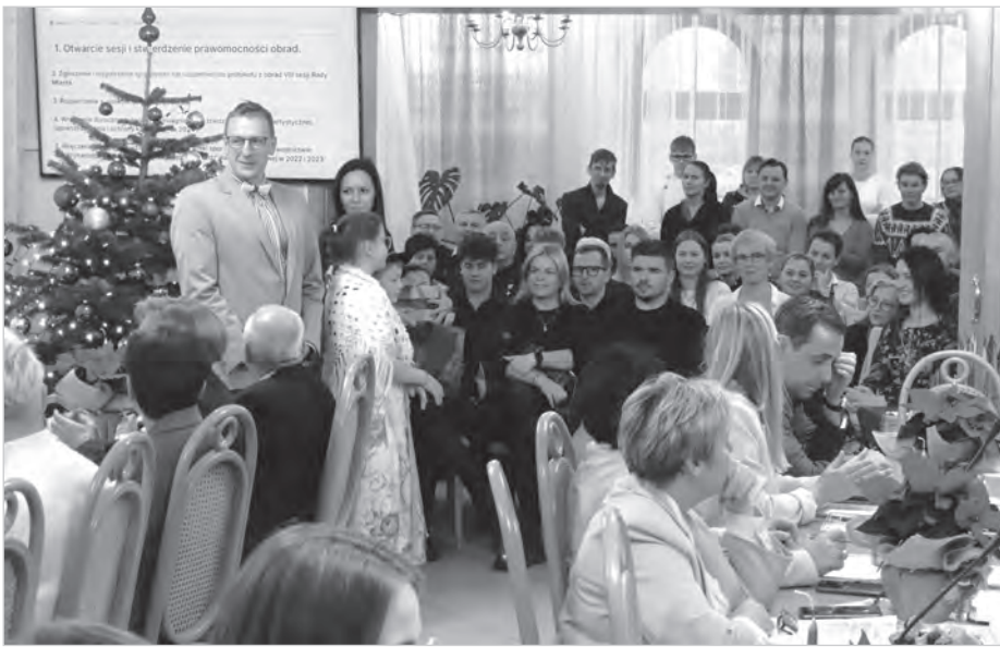
Na sesji było wielu gości, a wśród nich mistrzowie sportu i kultury.