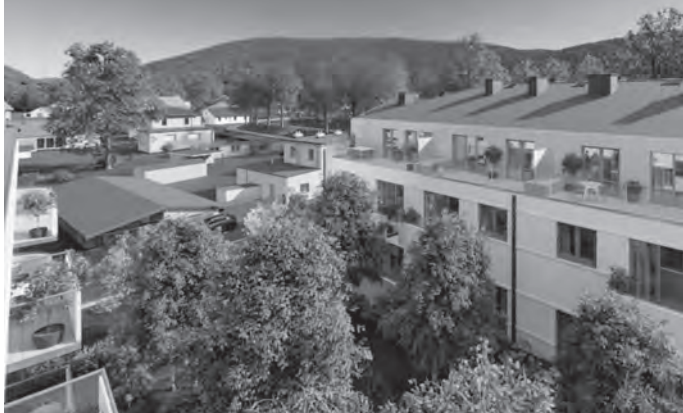
Widok na nową inwestycję od strony Parku Kuracyjnego - wizualizacja. Grafika z Facebooka inwestora