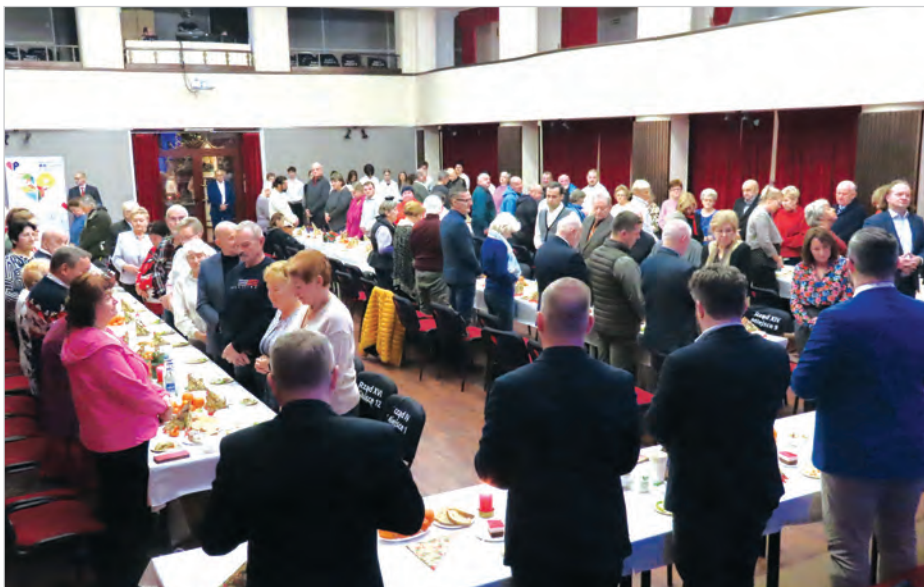
Przy wigilijnym stole zasiadali przedstawiciele duchowieństwa, samorządu i instytucji publicznych, darczyńcy oraz podopieczni Fundacji św. Antoniego.