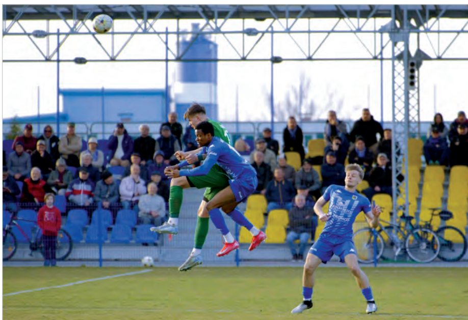
Rywalizacja o piłkę w zaciętym pojedynku główkowym.