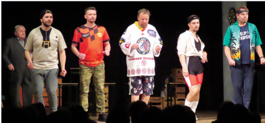
Czy ostatecznie panowie się rozbiorą? Nie zdradzamy puenty, bo spektakl „Kogut w rosole” będzie wystawiany na deskach Sceny Polskiej Teatru w Czeskim Cieszynie po zakończeniu remontu, który potrwa do końca roku, a także na gościnnych występach.