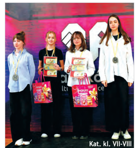
Kat. kl. VII-VIII