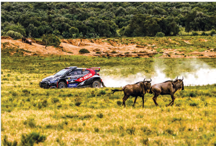
Rajdowe zmagania na łonie kenijskiej przyrody.