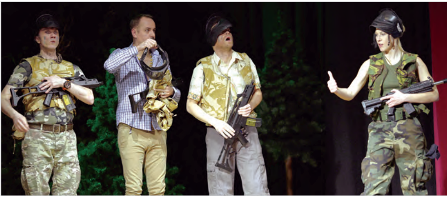
Spektakl pełen był błyskotliwych dialogów i dynamicznych zwrotów akcji.