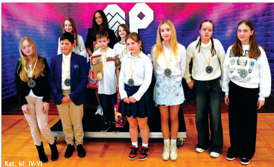
Kat. kl. IV-VI