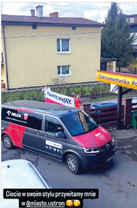
Ciocie w swoim stylu przywitamy mnie w @miasto.ustron 🥰🥰