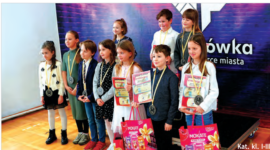
Kat. kl. I-III