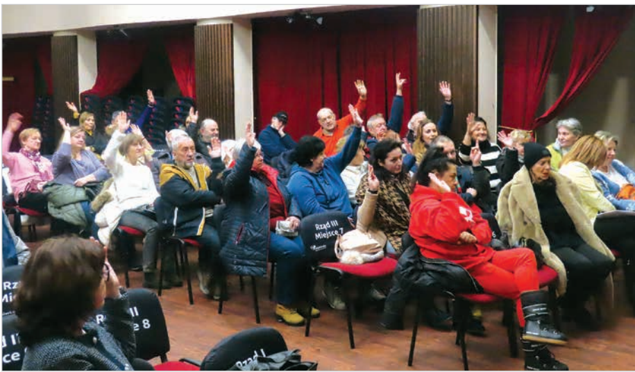
„Ręcznie” głosowano nad porządkiem obrad, a na kandydatów na kartach.