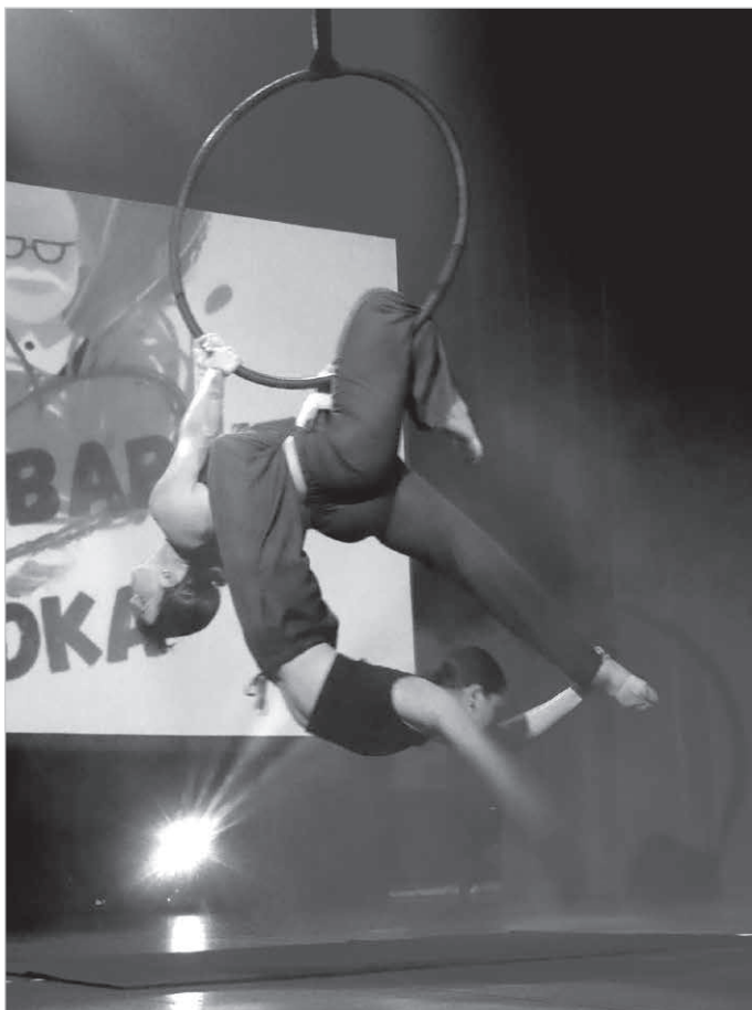
Niespodzianka dla babci i dziadka.