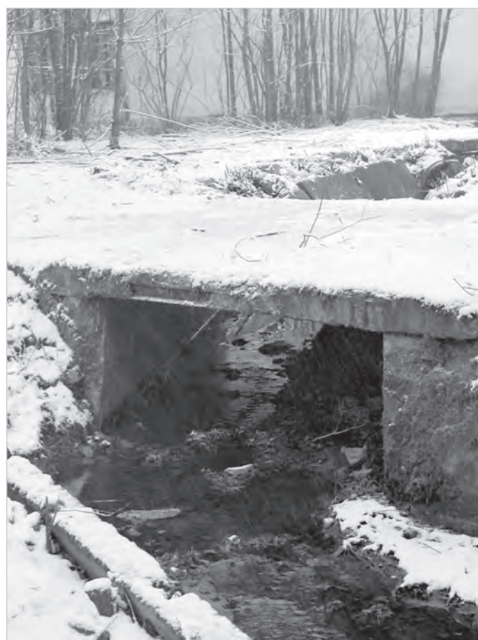
Betonowy mostek, wzmocniony stalowymi szynami, umożliwiający przed laty transport towarów z tartaku. To tutaj Adolf Löwy zainstalował bramę, uniemożliwiając skrót do dworca.

wprowadziło do Kuźni kolej wąskotorową, przecinającą drogę powiatową do Skoczowa, ale o tym już w następnym odcinku. Na końcu dodać należy, iż finalnie lokalni furmani i tak na budowie kolei skorzystali, wożąc ze stacji nie tylko towary, ale również licznie przybywających do domów wypoczynkowych kuracjuszy. Alicja Michalek, Muzeum Ustroniskie