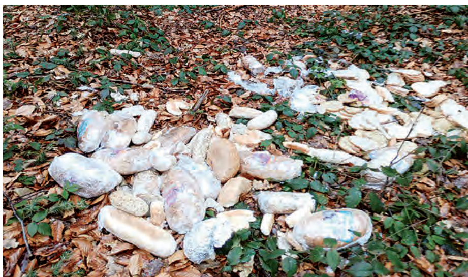
Chleb wyrzucony w lesie w Lipowcu. Osoba, która to zrobiła zostawiła pieczywo w folii.

tyczą też odpadów wielkogabarytowych, odbieranych w ramach bezpłatnej zbiórki organizowanej raz w roku w każdej dzielnicy. W przypadku „gabarytów” warto jednak dokładnie przeczytać, co się do nich zalicza. (mn)