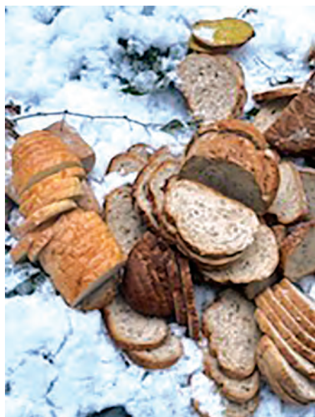
Chleb po rozpakowaniu został w lesie, ale powinien trafić do odpadów bio.