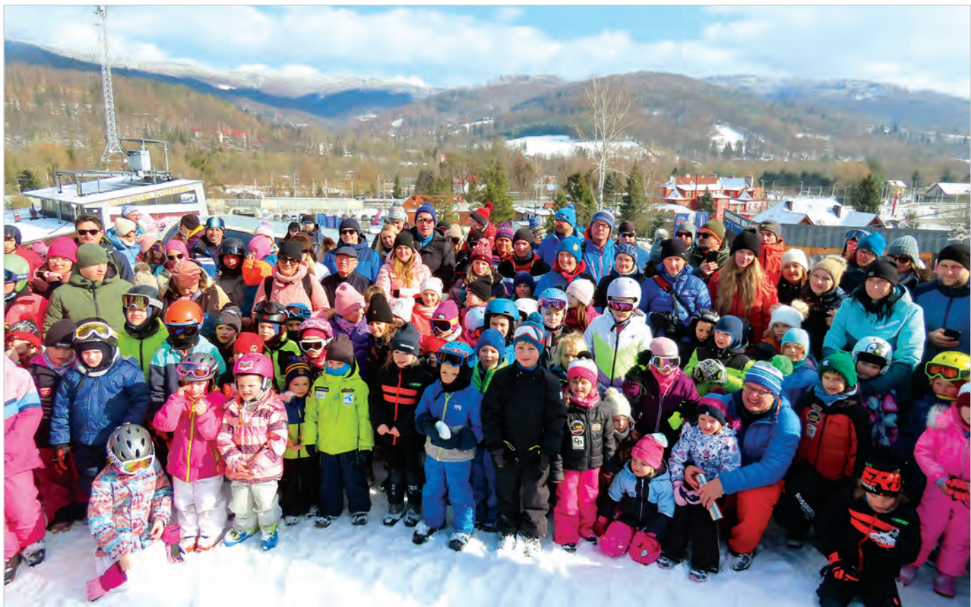
Rodzice z młodymi narciarzami w oczekiwaniu na dekorację. Wystartowały 43 dziewczynki i 44 chłopców.