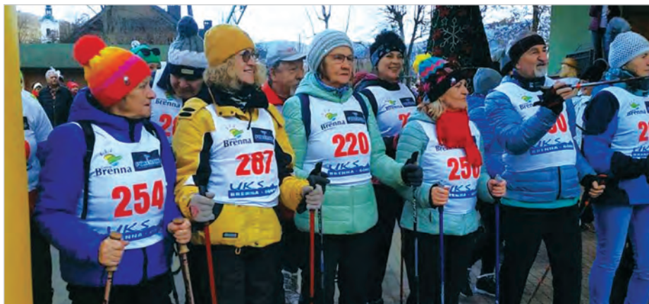
Nie zabrakło naszych reprezentantów w nordic walking.