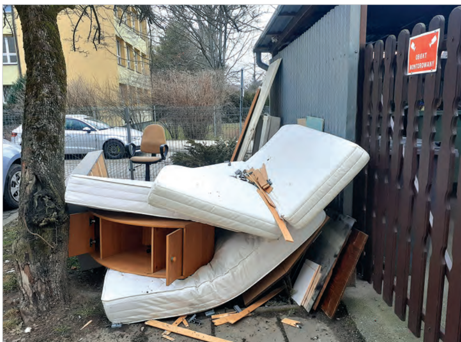
Śmietnik na os. Cieszyńskim. Te odpady powinny być wywiezione na PSZOK.

Limity dla nieruchomości zamieszkałych oraz nieruchomości mieszanych, czyli takich, na których w części zamieszkują mieszkańcy, a w części nie zamieszkują mieszkańcy, a prowadzona jest działalność gospodarcza wynoszą: odpady zielone – 500 kg na rok, odpady budowlane