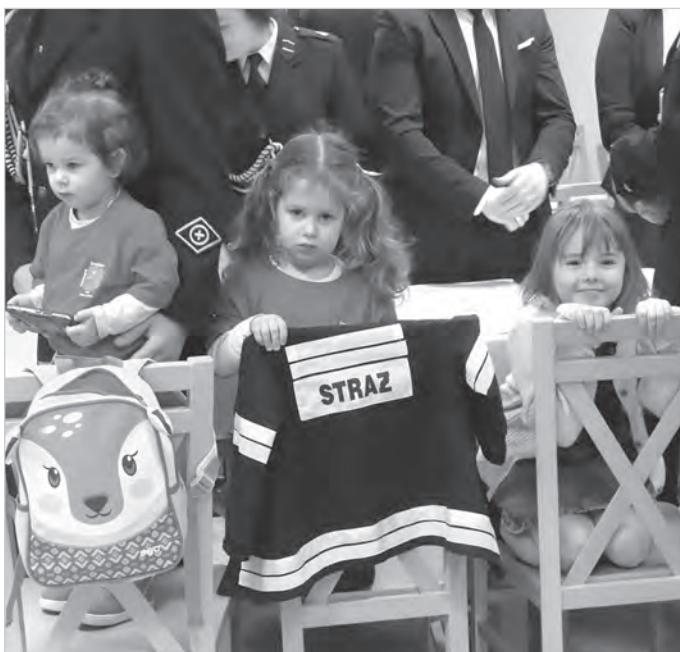
Przyszłość OSP Lipowiec pięknie się rysuje.