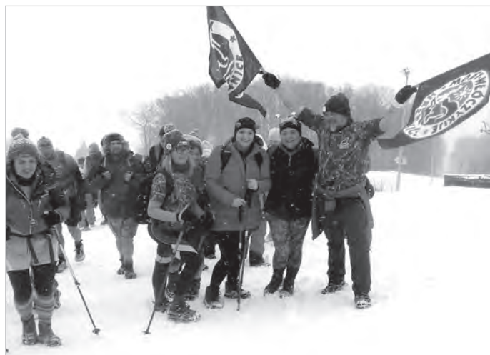
Zimowe aktywności zdrowo uprawiają członkowie Stowarzyszenia Morsy Włóczyki Hermanice. Ich reprezentacja oczywiście brała udział w tegorocznym VI Wejściu na Czantorię w krótkich gaciach.