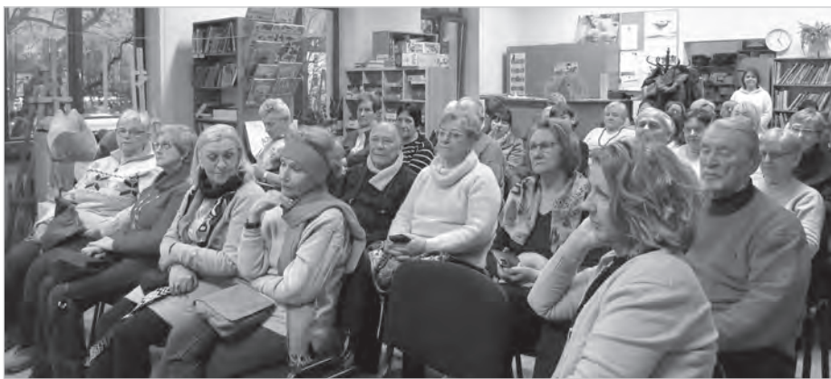
Tematem kolejnego spotkania Klubu Zdrowia były zdrowe stopy.