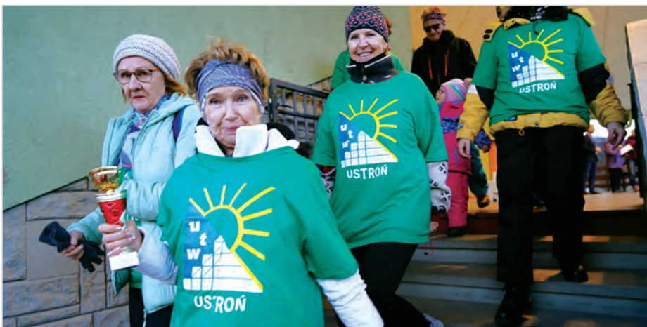
Reprezentacja UTW Ustroń w gustownych strojach.