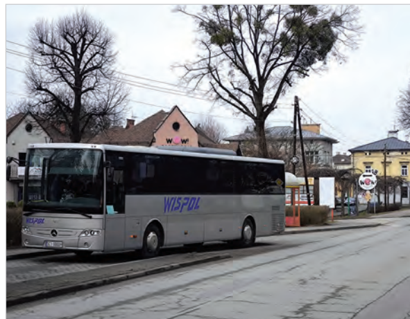
Przystanek Centrum 1 na ul. 3 Maja.