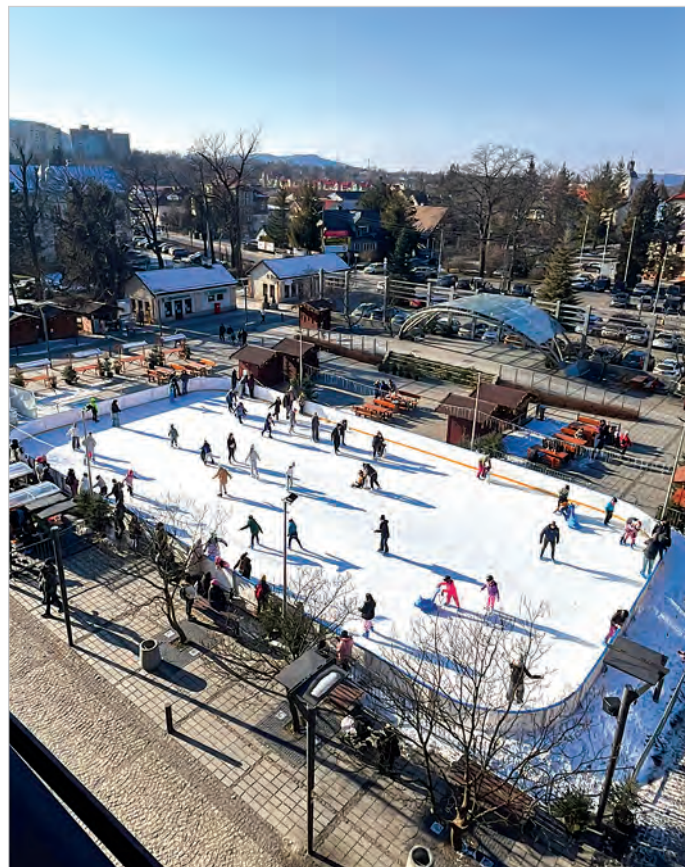
Lodowisko wpisało się w krajobraz ustronńskiego Rynku

Wspólnie zadbajmy o rozwój naszego miasta, o jego dobrą przyszłość!