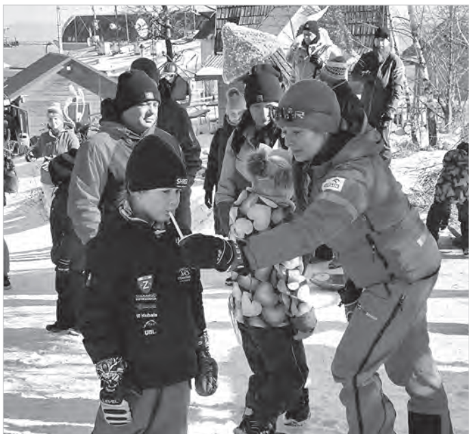
Suplementacja, a potem dekoracja.