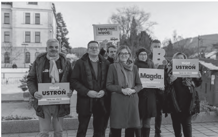
Na rynku odbyło się spotkanie wyborcze Magdaleny Biejat. W otoczeniu współpracowników i sympatyków zaprezentowała swoje hasła wyborcze.