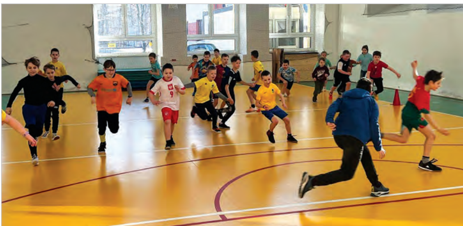
Młodzi podopieczni Klubu Sportowego Kuźnia Ustronь dokazują podczas zajęć na stacjonarnym obozie zimowym, a seniorzy szykują się do ligowych zmagania.

Kuźnia Ustronь rozegrała dziewięć meczów kontrolnych, notując kilka przekonujących zwycięstw. Pierwsze starcie zakończyło się wynikiem 6:2 z Odrą Wodzisław. Na listę strzelców wpisali się m.in. Szlufarski, Bujok i Borszewski. Następnie zespół pokonał LKS Tempo Puńców 2:0 po golach Sikorów, a także Pniówek Pawłowice 2:0. W starciu