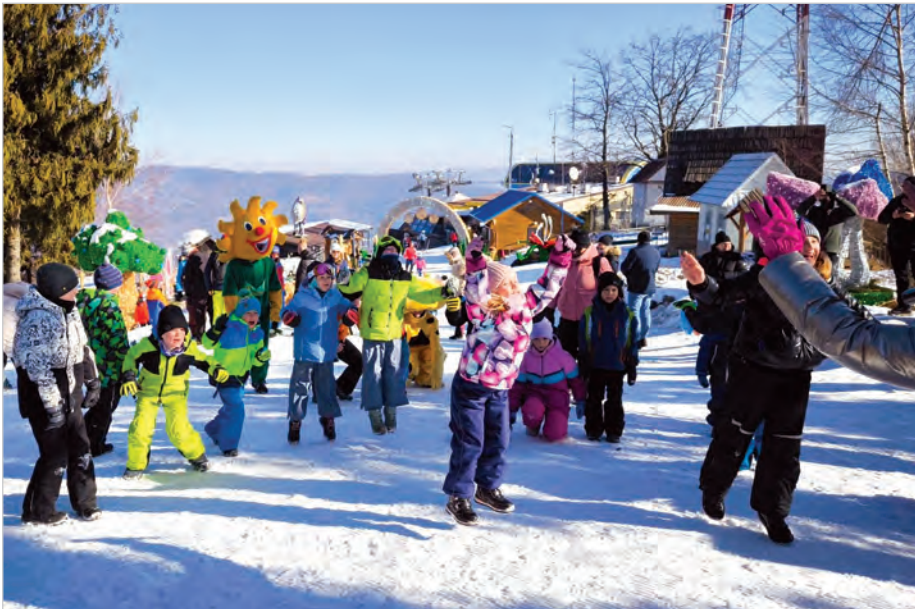
Słońce, śnieg, widoki, ruch to przepis na idealne ferie.