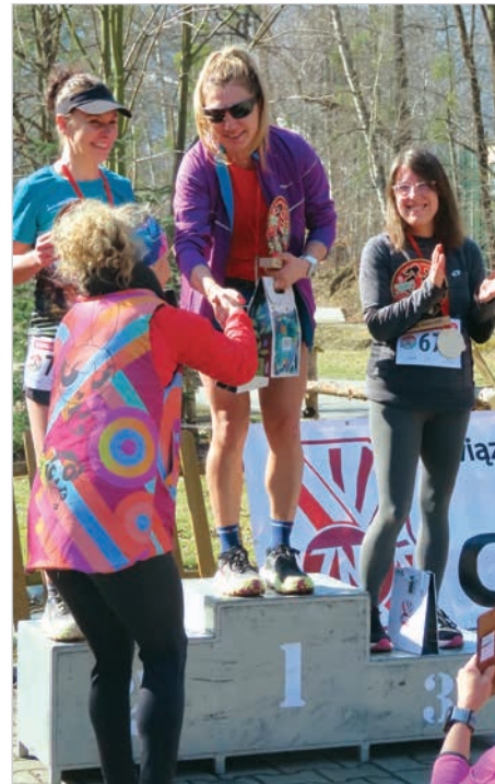
Kobiecie podium w kategorii ZNP.

Na starcie stanęło 45 biegaczy i 16 osób z kijami. Trasę liczącą 6,7 km najszybciej