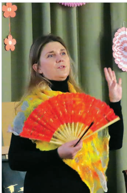
Autorka książki „Kossakowie. Wachlarz”.