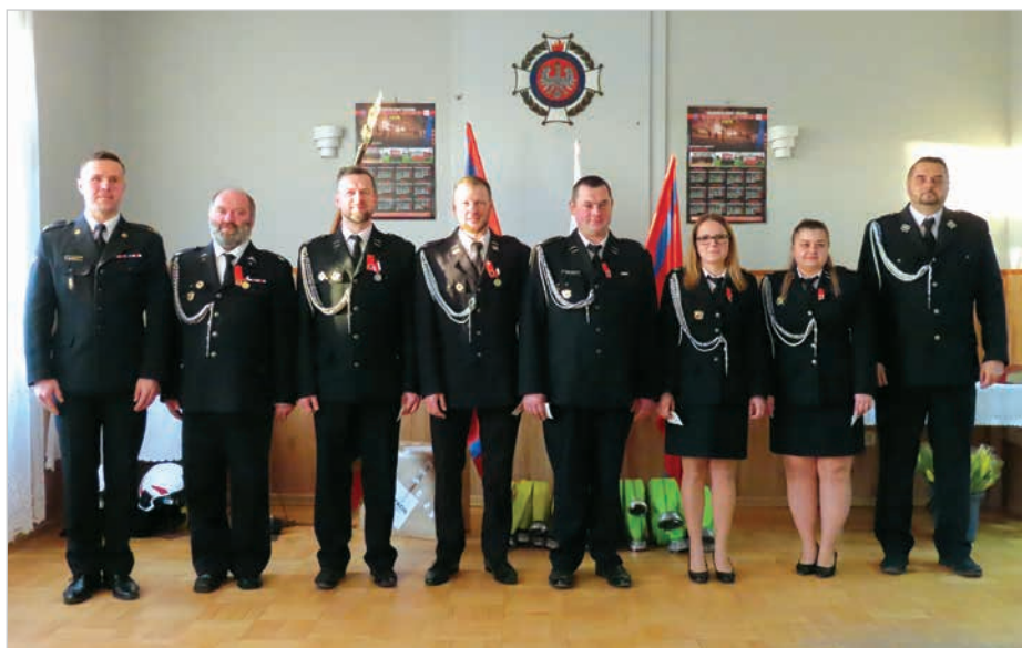
Druhnny i druhowie odznaczeni za wysługę 10 lat.