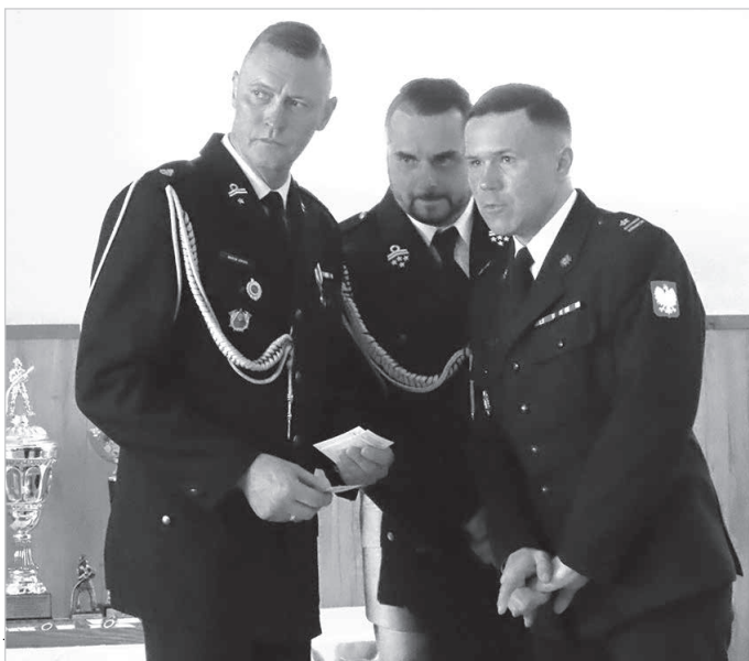
A te kwiaty to już teraz?