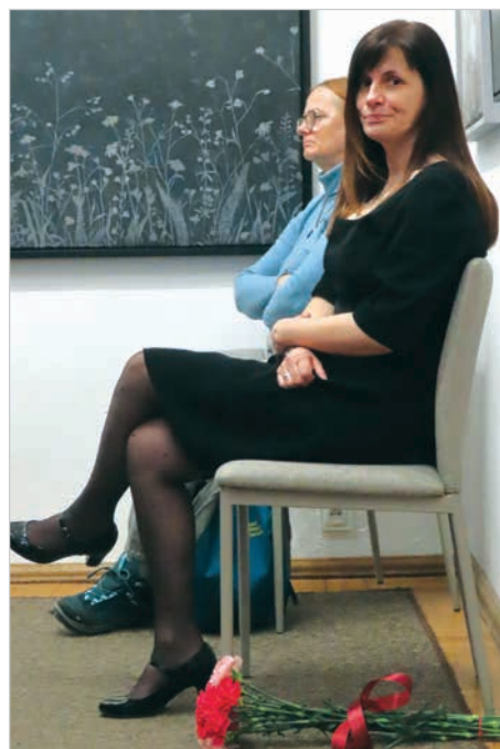
Dyrektorka Muzeum na jubileuszowym krześle.