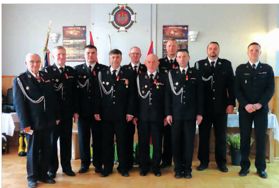
Druhowie z wysługą 25, 30, 35, 45 i 55 lat. Pierwszy z lewej Karol Małysz.