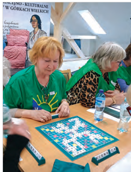
Jedną z konkurencji były Scrabble.