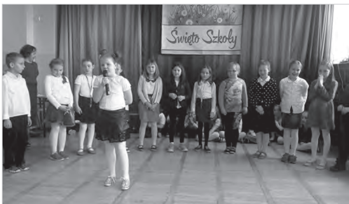
5 marca w SP-5 w Lipowcu odbyło się Święto Szkoły połączone z Dniem Otwartym dla przedszkolaków i ich rodziców.