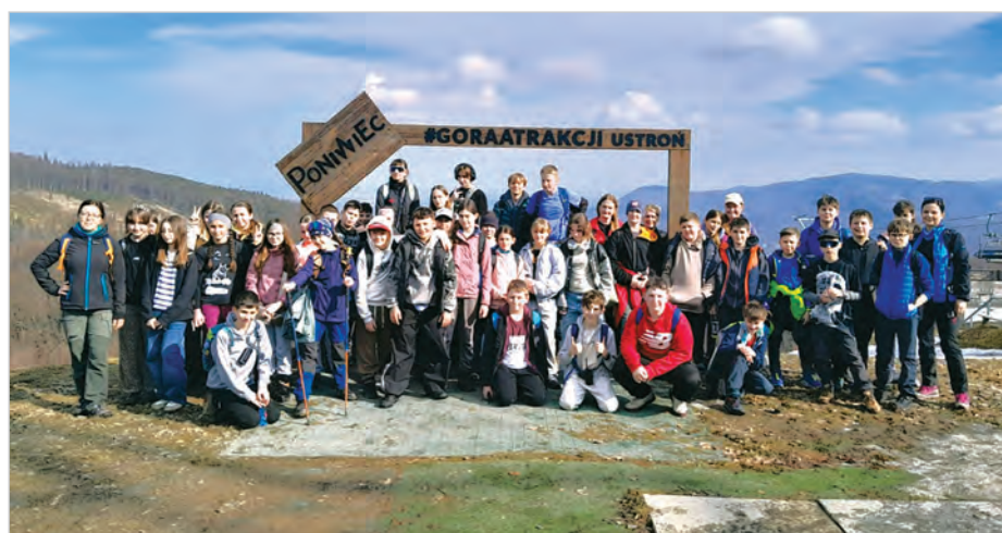
Dzień wolny? Dla nich to idealny moment na działanie! 14 marca 30 uczniów Klimatycznej Szkoły Podstawowej nr 2 wzięło udział w wyjątkowym wejściu na Czantorię w ramach akcji „31 dni na Czantorii”. Dopisała piękna pogoda, świetne humory i fantastyczna atmosfera na szlaku! Było aktywnie, integracyjnie i bardzo pozytywnie.