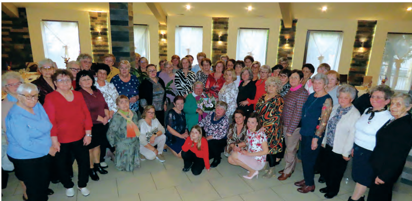
Członkinie Koła Gospodyń Wiejskich 10 marca świętowały Dzień Kobiet. Więcej na str. 10.

W numerze m.in.: Aktywni seniorzy , Pieniądze na Folwarczną i chodnik na Manhatanie , Plan ogólny - terminarz konsultacji , Czujne oko monitoringu , Och, och sieję groch , Efektowna inauguracja rundy wiosennej Kuźni