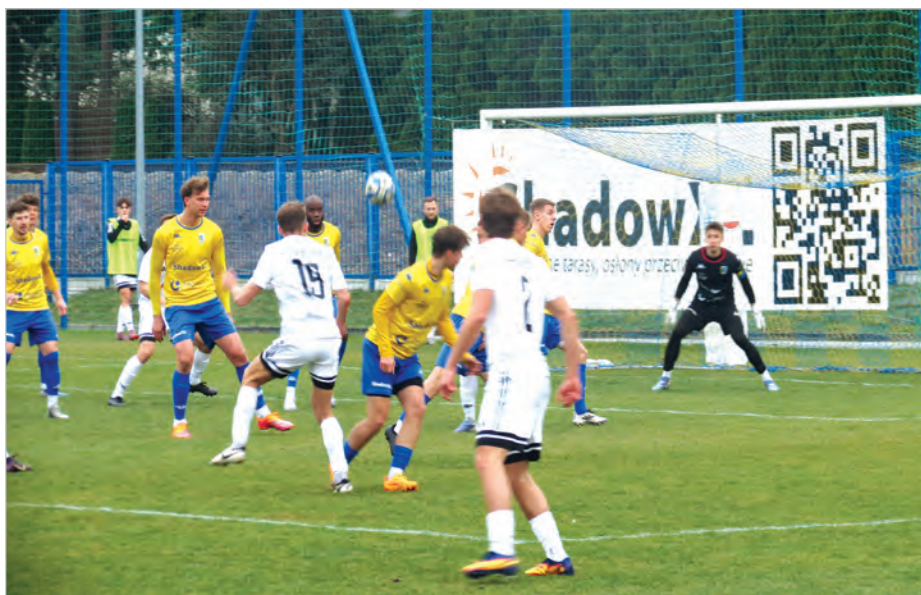
Jeden z nielicznych ataków zawodników Szombierek Bytom na bramkę Kuźni Ustroń.

Kuźnia Ustroń wystąpiła w składzie: w bramce Florek, Adamczyk (Tomczyk 68'), Bui, Pasazhin, Przydacz, Toure (James 65'), Sikora (Szulfarski 58'), Gancarczyk, Surowiec (Wojciechowski 38'), Ligocki, Sajdak. Kamila Paradowska