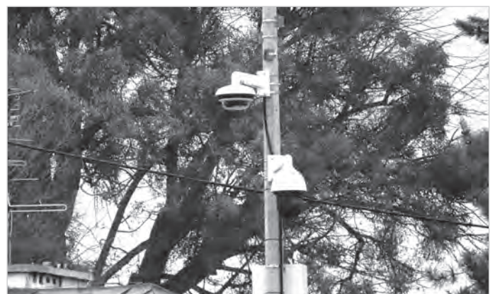
Kamera nad Rondem Miast Partnerskich.