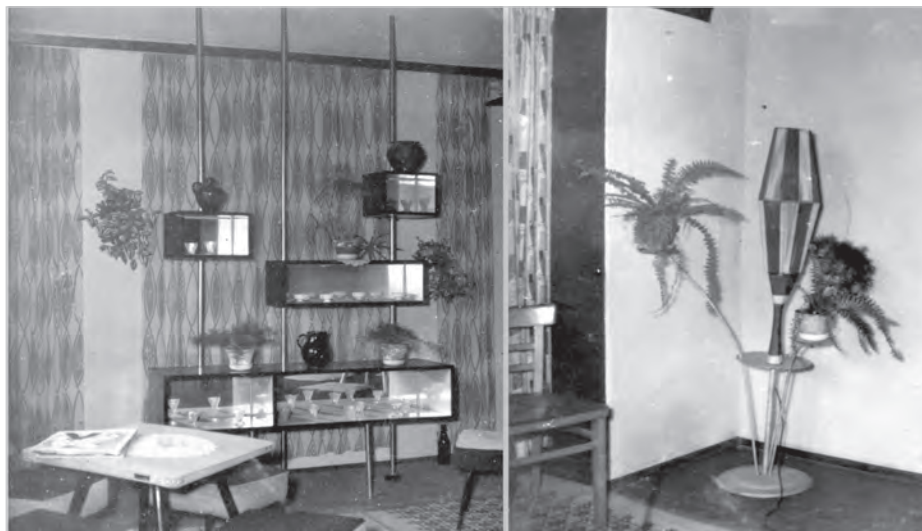
Stylowe wnętrze klubokawiarni POM-u, lata 60. XX w.