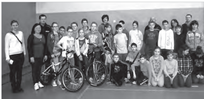
7 marca w SP-2 w Ustroniu odbyły się miejskie eliminacje Ogólnopolskiego Turnieju Bezpieczeństwa w Ruchu Drogowym.

Pierwszy dzień marca 2016 roku został w całym kraju określony mianem Dnia Żołnierzy Wyklętych. W całej Polsce odbywały się uroczystości upamiętniające tych żołnierzy niezłomnych, którzy w okresie sowieckiego reżimu walczyli w obronie najważniejszych wartości, pomimo nierządnych szykan i represji ze strony ówczesnych władz. Owych żołnierzy i bohaterów upamiętniono również na ustronim Rynku podczas uroczystego apelu, w którym wzięli udział przedstawiciele władz Ustronia oraz dzieci i młodzież z ustronich szkół wraz z opiekunami. W czasie uroczystości uczczono pamięć żołnierzy minutą ciszy, po czym delegacje uczniów złożyły kwiaty przy tablicy pamiątkowej. Obchody, które zakończono złożeniem ostatniego bukietu kwiatów, pomogły uświadomić młodemu pokoleniu, jak ważnym jest krzewienie pamięci o tych rodakach, którzy pomimo różnych zawirowań geopolitycznych oraz braku akceptacji ze strony ówczesnego systemu, potrafili w sposób niezłomny i konsekwentny stawać w obronie Ojczyzny i jej obywateli. (Is)