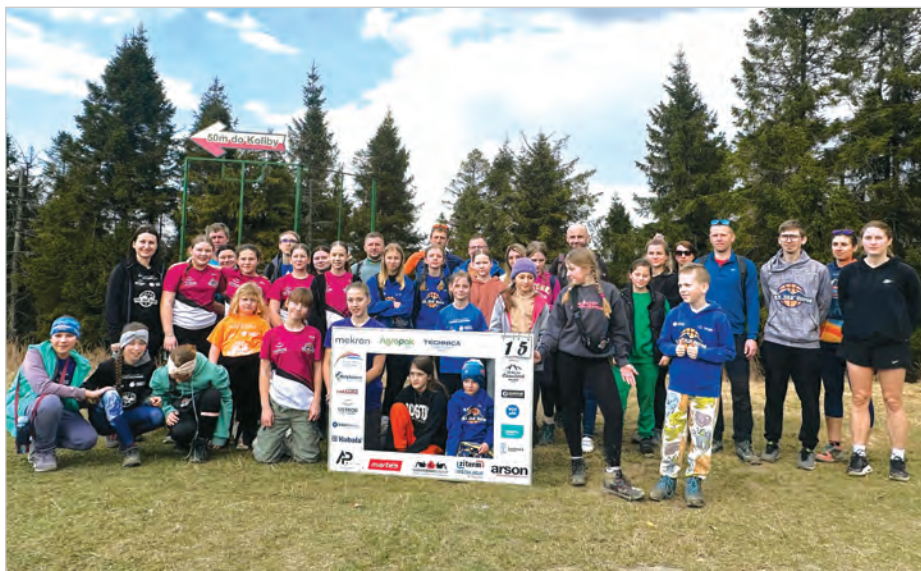
Koszykarska rodzina na Czantorii! W ramach akcji 31 dni na Czantorii 15 marca na górę wybrały się wspólnie koszykarki TRS „Siła” Ustron. Było rodzinnie i sportowo razem z trenerami i rodzicami. Koszykówka to nie tylko treningi i mecze, ale także wspólnota i pomaganie innym.

Można też wpłacać pieniądze: BLIK: 889 342 879, nr konta: 86 1020 1390 0000 6002 0834 6241 (PKO BP), tytuł: Darowizna na cele statutowe. Zbiórka odbywa się też na stronie Fundacji Siepomaga pt.: „Gang Leosia walczy – dołącz i pomóż w walce o jego nóżkę!”. Monika Niemiec