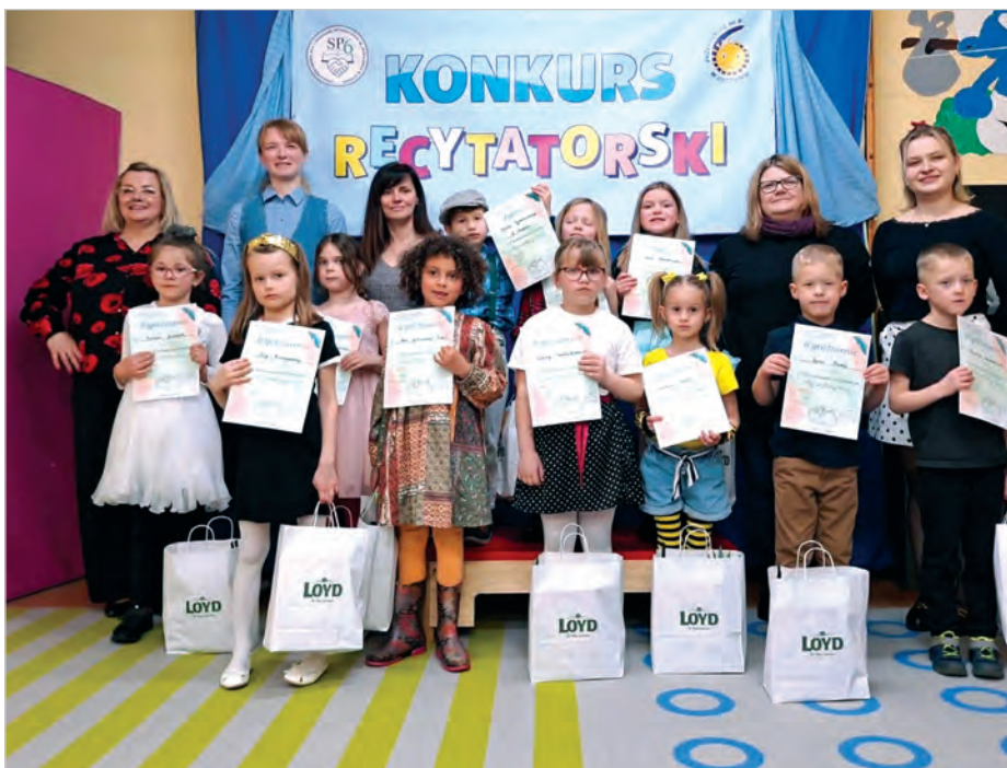
Uczestnicy konkursu wraz z komisją i organizatorkami.