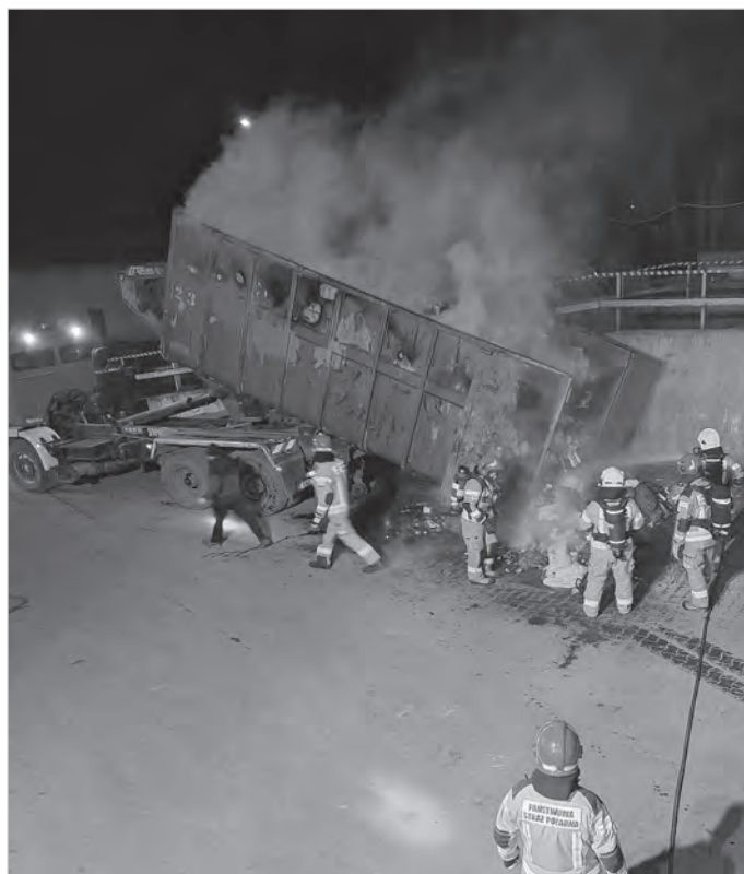
21 marca na ul. Krzywej doszło do pożaru kontenera na śmieci.