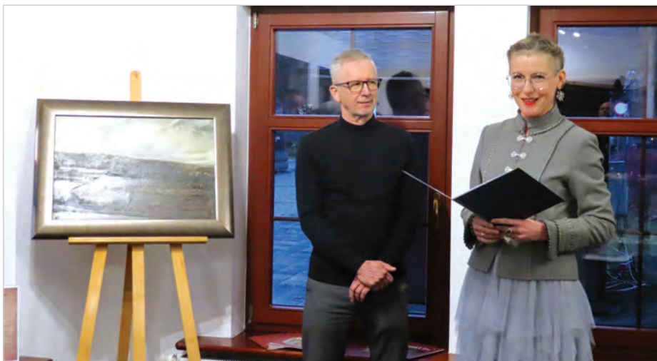
Malarz, dyrektorka „Prażakówki” i to jedno dzieło.