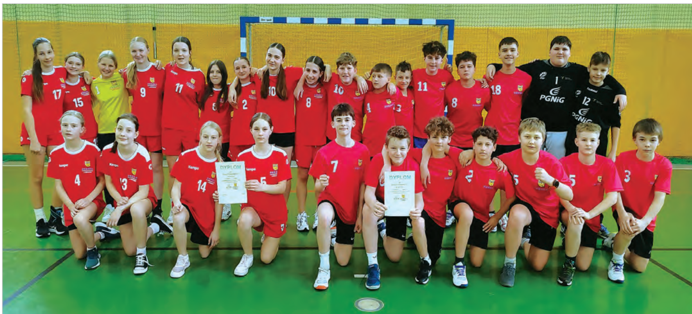
Drużyny dziewcząt i chłopców młodszych w kategorii Igrzysk Dzieci z dyplomami za zwycięstwo.