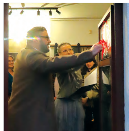
Przecięcie wstęgi i otwarcie Galerii Jednego Dzieła w Informacji Turystycznej.