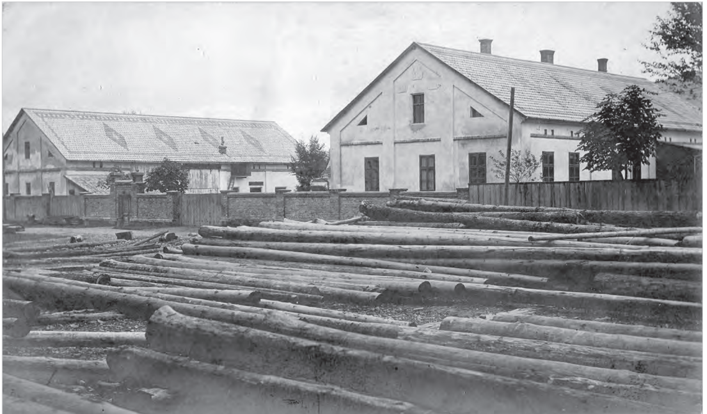
Unikatowa fotografia dawnych zabudowań Kowalów. Z lewej stodoła, z prawej dom mieszkalny, wniesione w 1906 r.