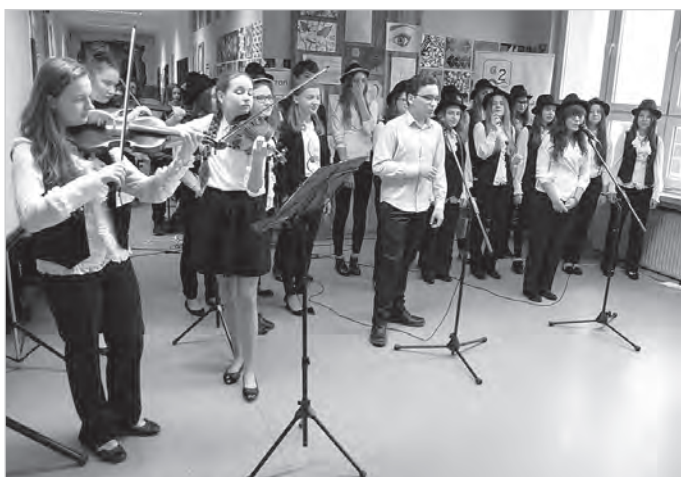
Wysoki poziom kształcenia artystycznego zaprezentowali uczniowie podczas dnia otwartego w Gimnazjum nr 2.