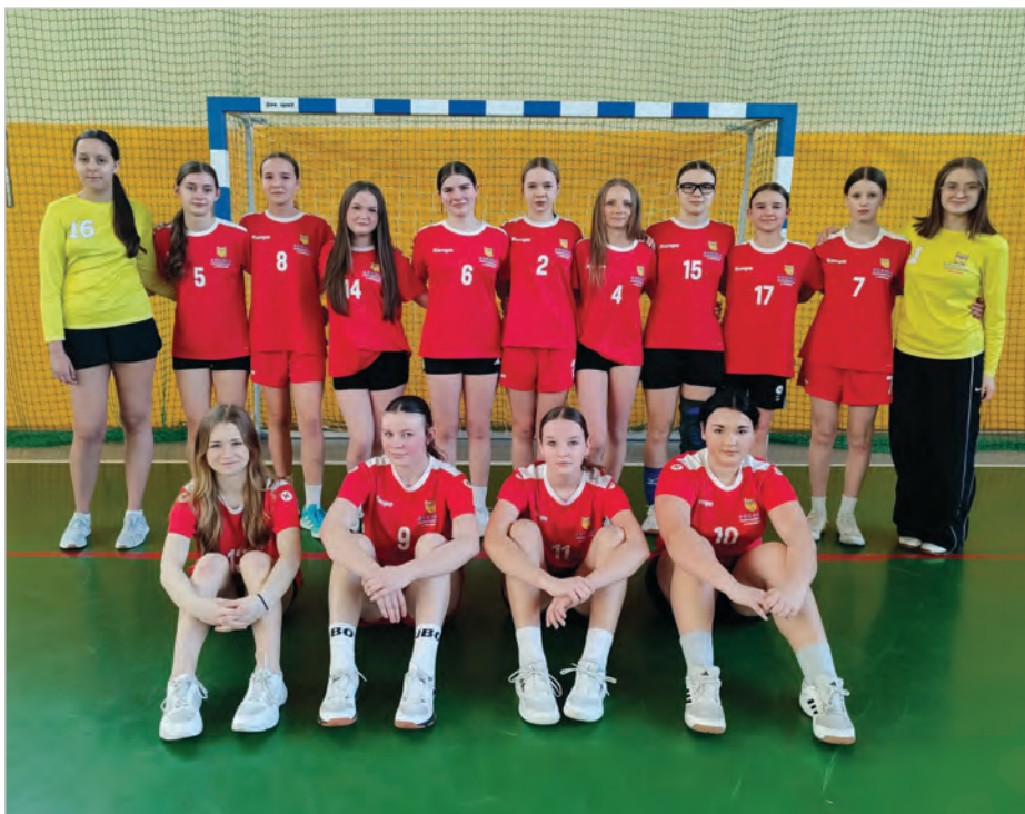
Drużyna dziewcząt w kategorii Igrzysk Młodzieży.

Gratulujemy młodym sportowcom ambitnej postawy i życzymy dalszych sukcesów. (kp)