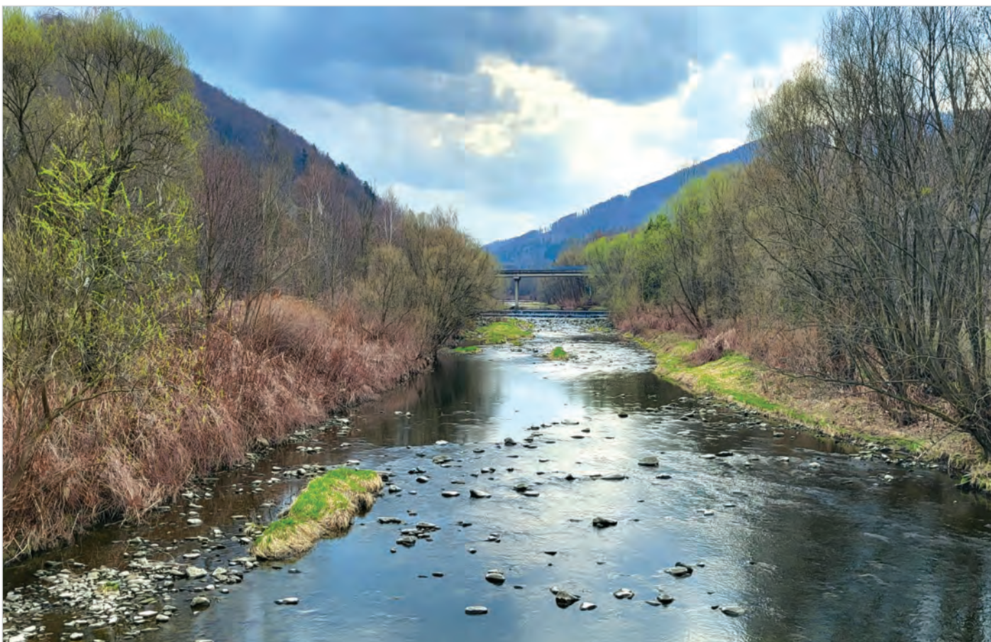
To już wiosna.

W numerze m.in.: Zostaw 1,5% w Ustroniu – wykaz organizacji pożytku publicznego , Ustroń wzmocnił ochronę przeciwpowodziową , Kowalówka w Nierodzimiu , Mała szkoła wielkie możliwości - wizytówka SP-3 , Karatecy z medalami , Zwycięstwa młodych szczypiornistów.