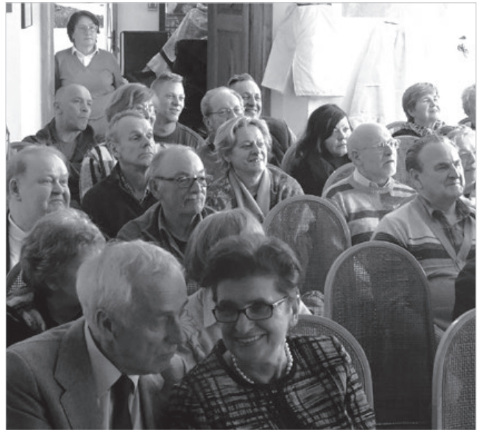
Żywo komentowano dawne widoki Ustronia w zestawieniu z dzisiejszymi.

W piątek 1 kwietnia w sali Szkoły Podstawowej nr 1 odbył się mecz III ligi w piłce ręcznej. MKS podejmował Grunwald. Początek fatalny w wykonaniu naszej drużyny. Grunwald wygrywa nawet pięcioma bramkami. Potem sytuacja się wyrównuje, a następnie MKSE zdobywa zdecydowaną przewagę. Druga połowa dobra w początkowej fazie, potem kilkuminutowy przestój i przegrywamy. Grały dwie najlepsze drużyny w lidze i było to dobre spotkanie. Walka od pierwszej do ostatniej minuty. (Is)