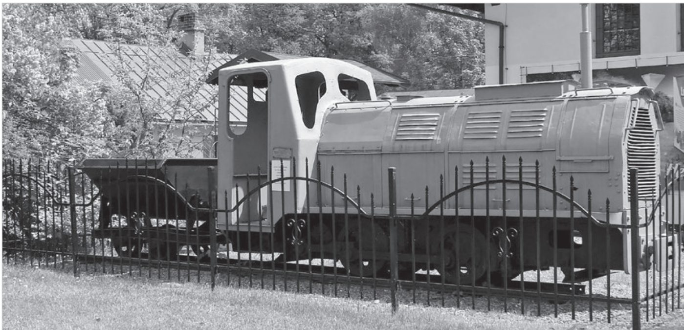
Lokomotywa spalinowa dwuosiowa WLS50 z wagonem i fragmentem torów znalazła swe miejsce w skansenie przy Muzeum Ustrońskim.

Cegielnia działała do 1991 r., jej tereny nabyła firma Mokate, a na terenach pierwotnego wyrobiska gliny znajduje się dziś łowisko wędkarskie przy ul. Żwirowej. W drodze, tuż przed dawnym zakładem, można dostrzec wtopione w asfalt fragmenty szyn. Cenną pamiątką po nim jest również lokomotywa spalinowa dwuosiowa WLS50, wyprodukowana w 1970 r. w poznańskich Zakładach Naprawczych Taboru Kolejowego, która, odrestaurowana i uzupełniona o wagon – kolebę oraz fragment torów, jest dziś częścią skansenu przy naszym Muzeum. Dodać należy, iż nierodzimska cegielnia po upaństwowieniu po II wojnie światowej należała do Krakowskiego Przedsiębiorstwa Ceramiki Budowlanej z siedzibą w Kętach. I na koniec jeszcze mały fragment lokalnej historii – otóż wyrobisko gliny w Lipowcu znajdowało się na terenie XVIII-wiecznego stawu rybnego, przynależnego do dawnego folwarku na Bernatce. Prezentuję unikatowe zdjęcia nierodzimskich wąskich torów oraz mostu kolejowego.