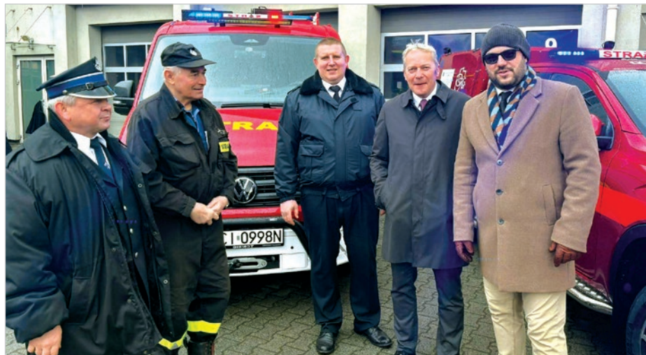
Wspólnie z marszałkiem województwa śląskiego Wojciechem Saługą.