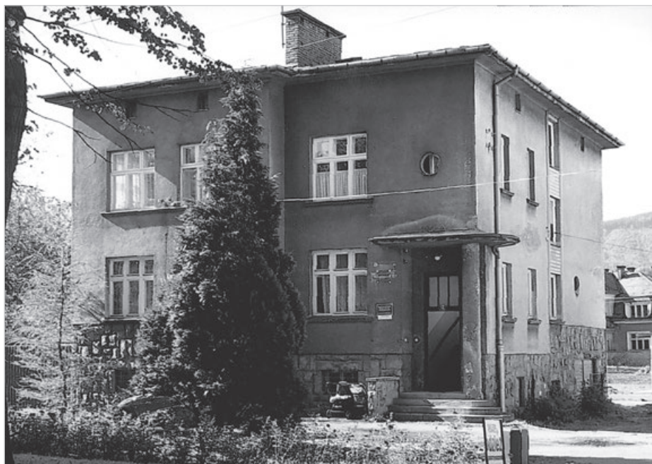
Poradnia Dziecięca - 2001 r.