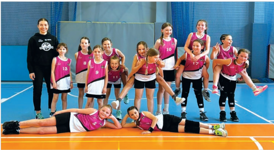
Zawodniczki TRS „Siła” Ustroń U10 K.