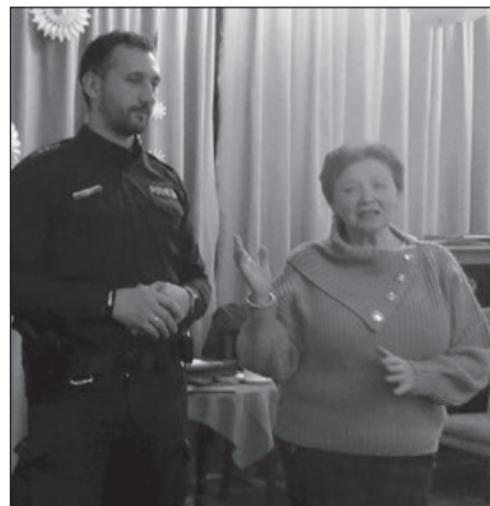
Powitanie prelegenta przez organizatorkę spotkania.