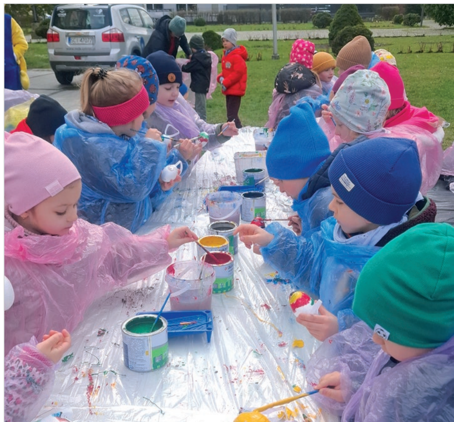
W przedświąteczny czwartek ustronński rynek zapełnił się kolorowymi farbami, białymi jajkami i roześmianymi dziećmi z ustronńskich przedszkoli, które na zaproszenie MDK Prażakówka wzięły udział w corocznej akcji pt. „Malujemy rynek z jajkami”. Było kolorowo, radośnie i tak bardzo kreatywnie, że do warsztatów przyłączały się także dzieci wraz z rodzicami, którzy przechadzali się wśród świątecznych, ustronńskich ozdób. Gotowe prace można podziwiać na drzewkach koło amfiteatru. Sponsorem akcji był PSB Mrówka Kosta Ustronń.