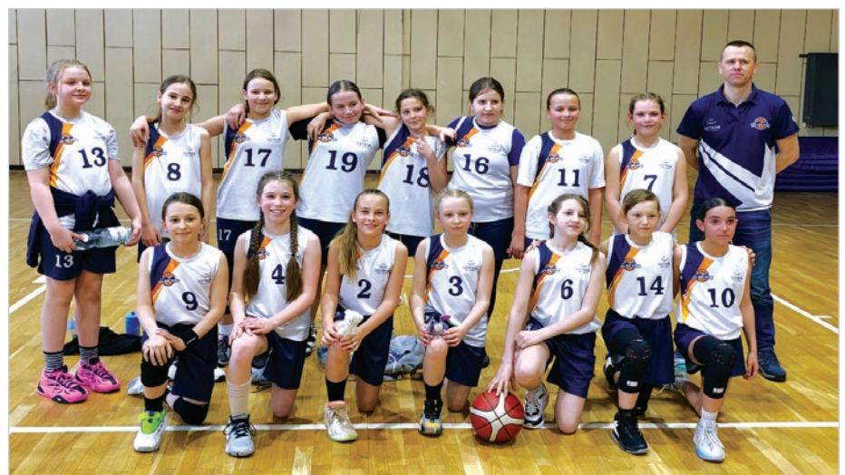
Zawodniczki TRS „Siła” Ustroń U11 K.