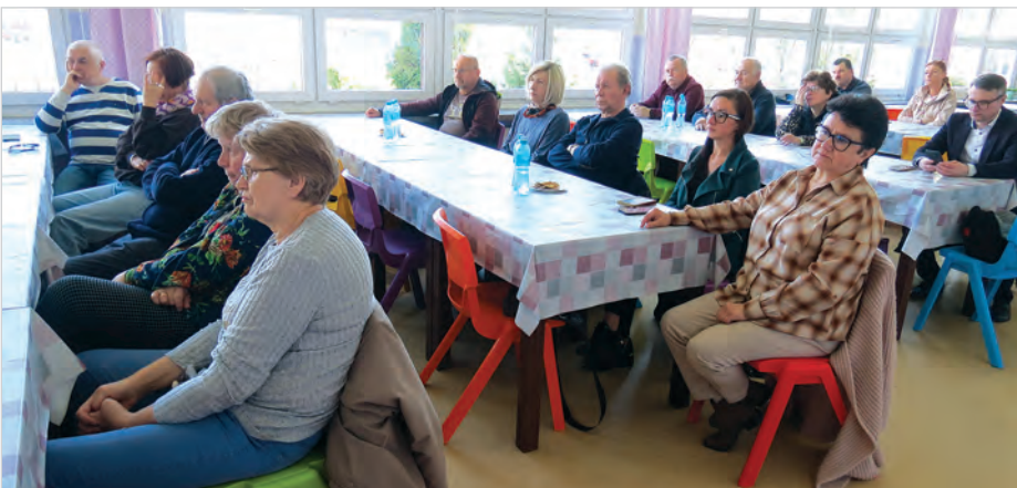
Mieszkańcy Ustronia Górnego.

Na zakończenie spotkania przewodniczący zaprosił wszystkich mieszkańców na 24 maja na spotkanie integracyjne, które odbędzie się na Kempie u Jońka.