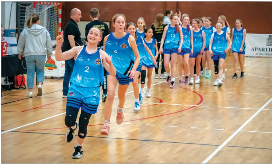
Radość po pierwszym meczu. One jeszcze nie wiedzą, że wygrają wszystko.