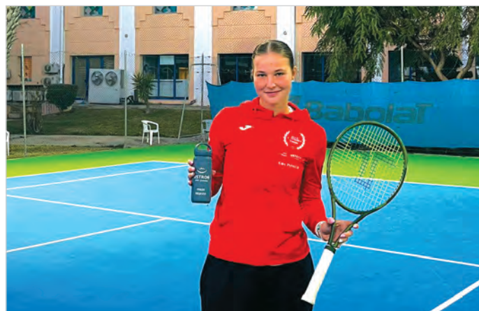
Z bidonem z logo Miasta Ustron w Tunezji.

Ponad rok temu miałam ze stresem, długo z tym walczyłam, ale odblokowałam się i czuję większą swobodę. To się przekłada na jakość gry. Pozwala lepiej obserwować, co gra przeciwnik, z czym