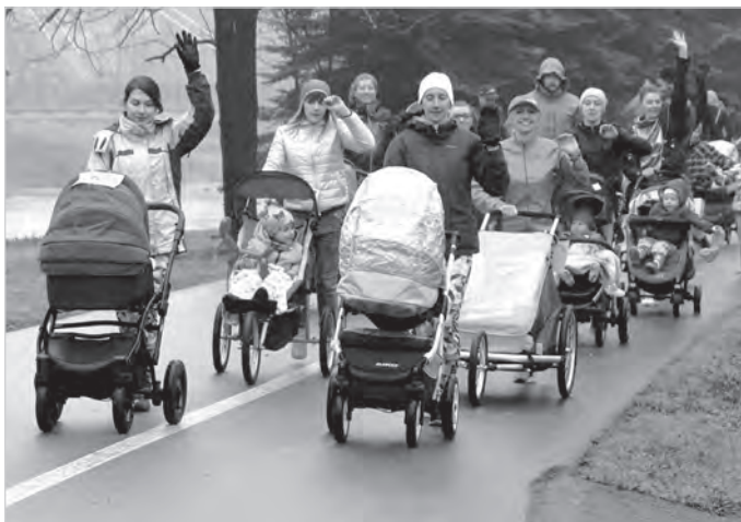
Mimo deszczu wyścigi z wózkami w mocnej obsadzie.