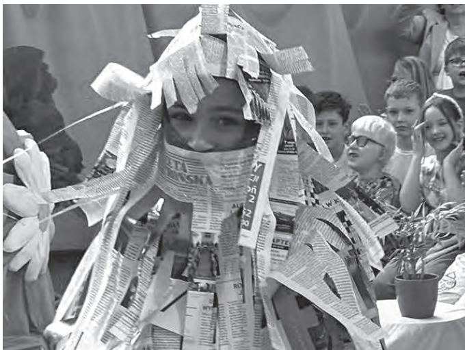
Gazeta Ustrońska pełni wiele funkcji.