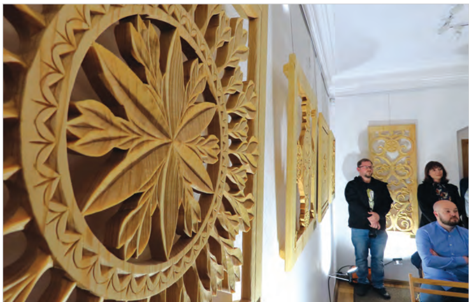
Rzeźba „Pacierz” na cześć Równicy.