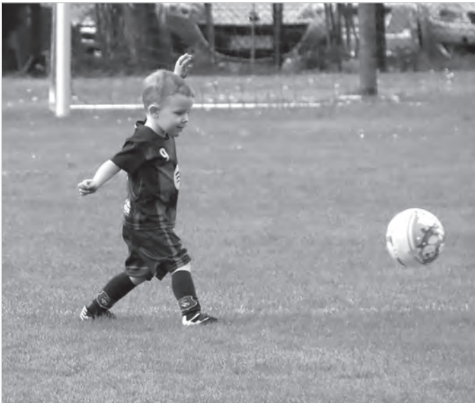
Kariera w Nierodzimiu czy w Barcelonie?