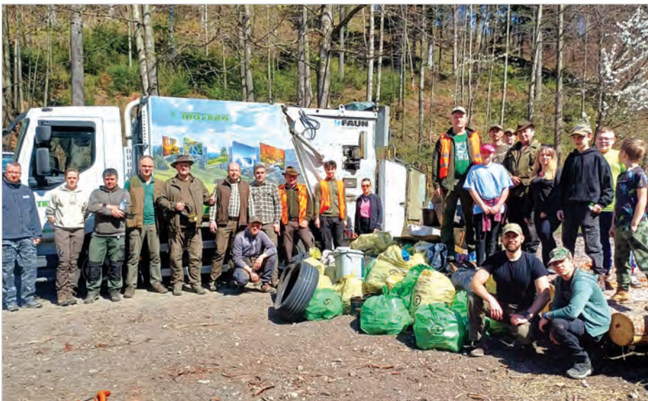
Członkowie Kł Jelenica w Ustroniu wspólnie z rodzinami w dniu 18 kwietnia po raz szósty spotkali się, żeby polować na śmieci w lesie. W akcji sprzątnięcia łowiska wzięło udział 25 osób, w tym dzieci. Nazbierano 380 kg śmieci. Dziękujemy Firmie Troseko za dostarczenie i odbiór worków ze śmieci. Akcja przynosi efekty i jest godna, aby ją naśladować przez inne Koła Łowieckie i ludność lokalną. Z myśliwskim pozdrowieniem DARZ BÓR. MYŚLIWI SPRZĄTAJĄ LASY I POLA