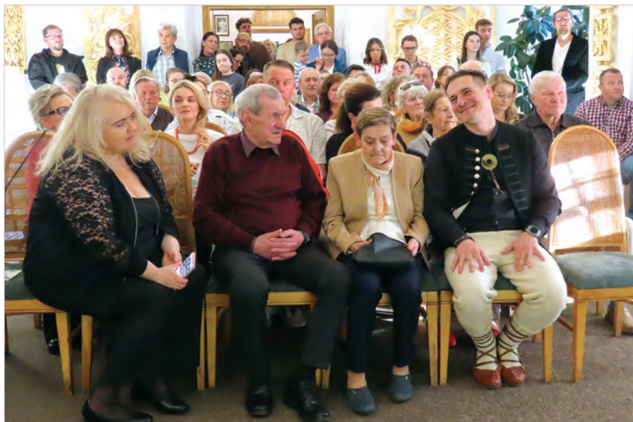
Na wernisaż i koncert przyszło wielu Ustroniaków i gości z regionu.