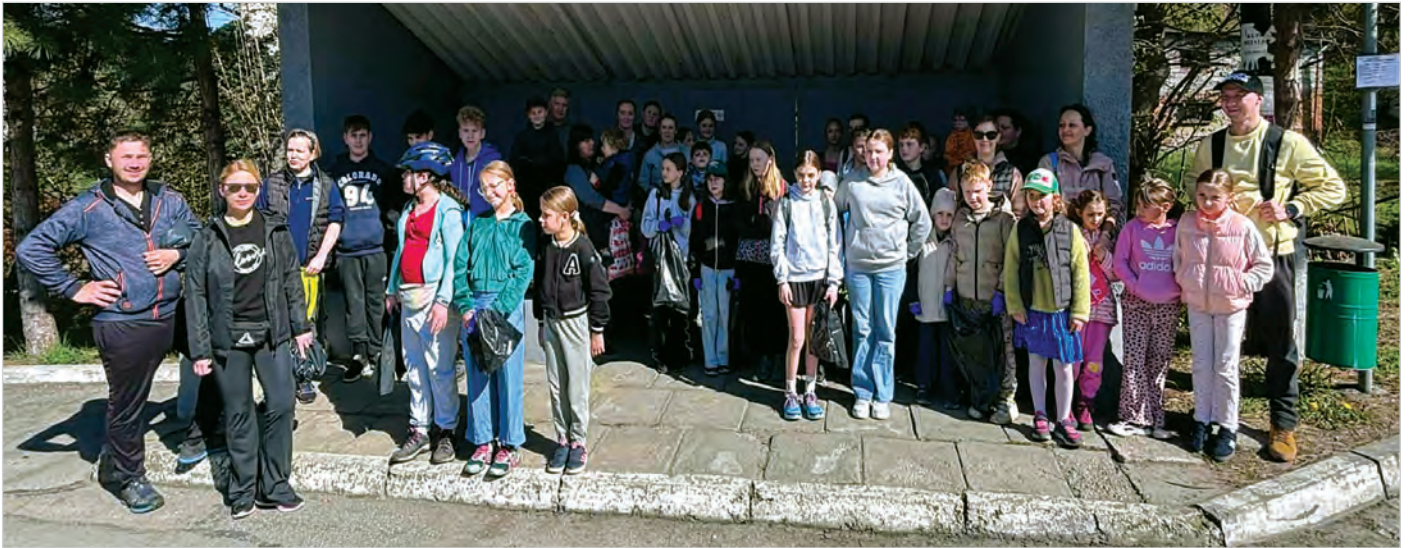
18 kwietnia odbyło się sprzątnięcie dzielnicy Lipowiec zorganizowane przez Zespół Szkolno-Przedszkolny nr 4 w Ustroniu, Koło Wolontariatu „Otwarta Dłoń” oraz Zarząd Osiedla Lipowiec. Pogoda dopisała, a organizatorzy dziękują wszystkim przybyłym za udział w sprzątnięciu oraz osobom które upiekły ciasto i w szczególności Restauracji Dolce Vita za smaczny finał sprzątnięcia, czyli ognisko, gorącą czekoladę i ciasto.