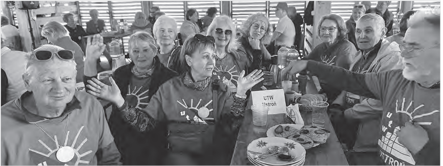
18 kwietnia członkowie Uniwersytetu Trzeciego Wieku w Ustroniu wzięli udział w rajdzie „Powitanie wiosny” zorganizowanym przez UTW Cieszyn. Uczestnicy przemierzali dwie trasy, a potem bawili się wspólnie przy bogatym poczęstunku zaserwowanym przez gospodarzy i wspólnych zabawach i grach. Jak zwykle była pyszna zabawa.