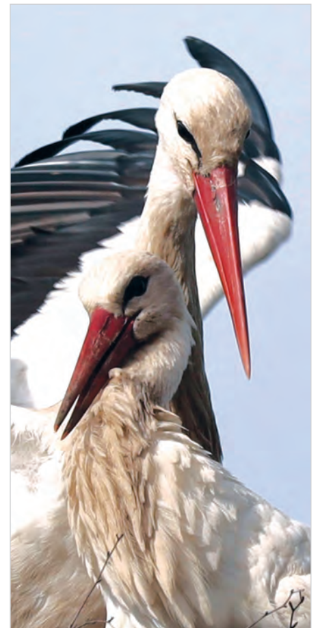
Ustronie bociany można śledzić na żywo na oficjalnej stronie projektu bocianyustron.pl. W sezonie 2026 przy ul. Daszyńskiego gniazdują: samica Czantorka oraz samiec Beskidek (przydomek Ligocki), obrączkowany jako pisklę w 2011 roku, w Ustroniu przebywa każdy sezon od 2017 roku. Po pięciu dniach razem 13 kwietnia Czantorka zniosła pierwsze jajo, które pokazała o godz. 22.02. 21 kwietnia w dniu zamknięcia numeru w gnieździe znajdują się 4 jajka.