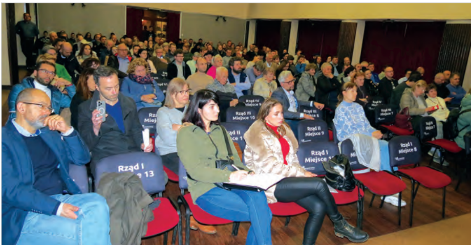
Sala widowiskowa w Prażakówce wypełniona po brzegi.