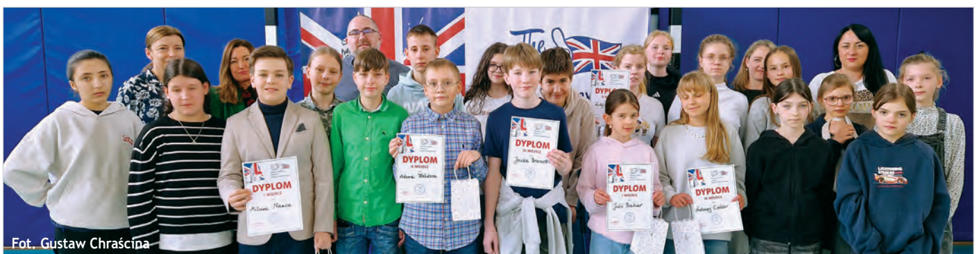
Fot. Gustaw Chraścina