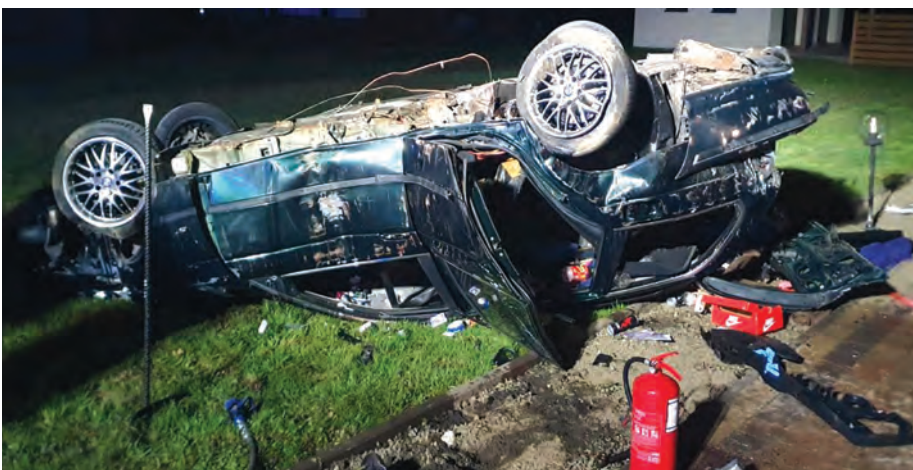
19 kwietnia na ul. Skoczowskiej doszło do wypadku.