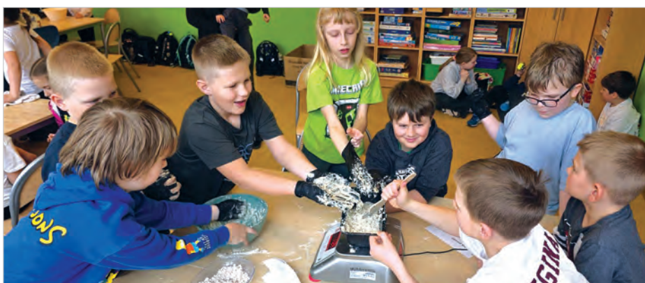
Robienie chleba z zaczynu od pani kurator.