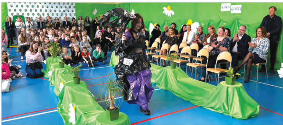
Pokaz mody ekologicznej był głównym punktem obchodów Dnia Ziemi.