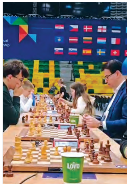
... i bierze w nim udział.