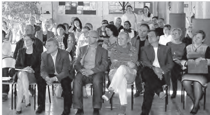
Na zebraniu Lipowca oglądano prezentacje.