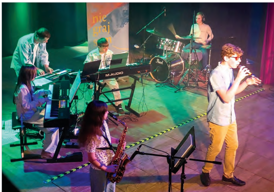
Zgodnie z mottem Zespołowni „Nie graj sam” na scenie wystąpiły zespoły.

Każdy – i dziecko, i dorosły, może zostać częścią „Zespołowni”, uczyć się gry na instrumentach i śpiewu, w zespole poszukiwać harmonii i wspólnie cieszyć się tworzeniem muzyki. To coś więcej niż lekcje, teoria i nuty. Monika Niemiec