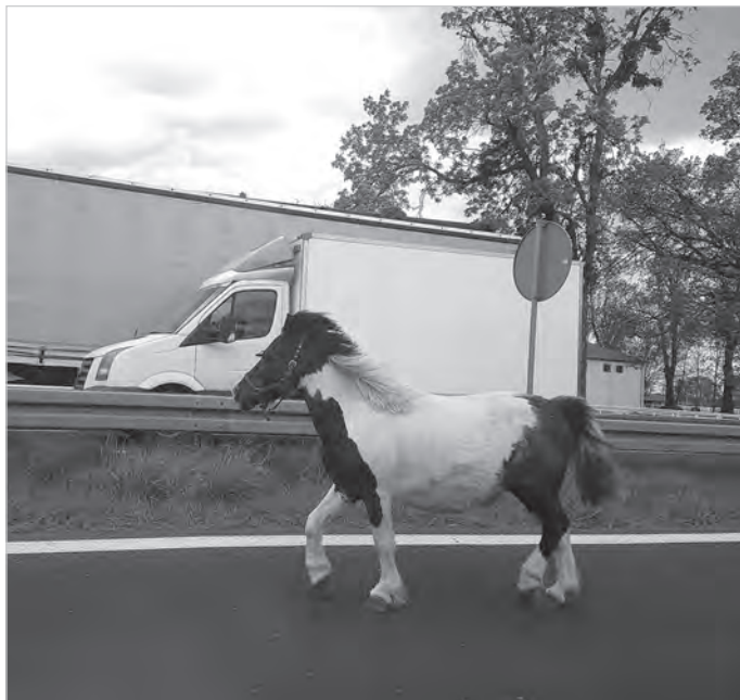
Wszyscy pędzą wojewódzką do Ustronia.