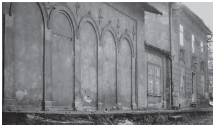
Tak wyglądał dawny Salon Kuracyjny w 1957 r. Obiekt, pomimo intensywnego użytkowania przez WOP, po rozformowaniu batalionu nie zatracił swych pięknych cech stylowych. Tę część zabytkowego gmachu zburzono 10 grudnia 2024 r. w związku z inwestycją deweloperską.