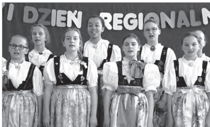
Po raz 16. w SP-3 odbył się Dzień Regionalny.