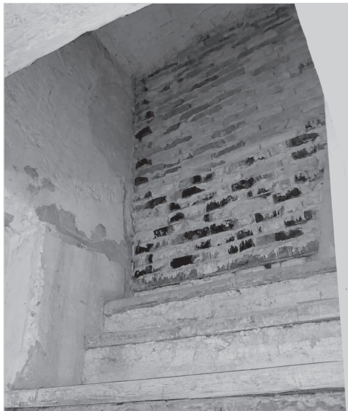
W południowej części muzealnej piwnicy zachowała się obszerne wnęka oraz fragment schodów. Jest to pamiątka po dawnym, zamurowanym wejściu.