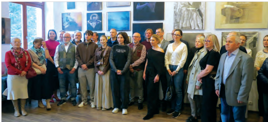
Pamiątkowa fotografia uczestników wernisażu w Galerii Rynek.