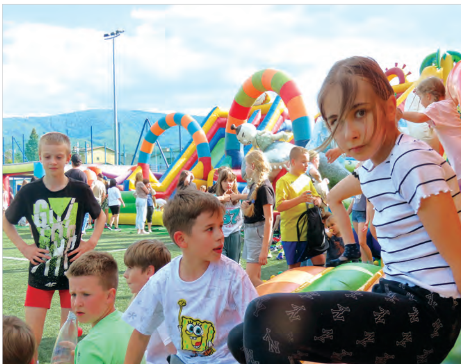
Podczas festynu z okazji Dnia Dziecka na stadionie Kuźni bawili się całe rodziny. Więcej na str. 8.

Nr 22 (1774) • 3 czerwca 2026 r. • 3,00 zł (w tym 5% Vat) • ISSN 1231-9651