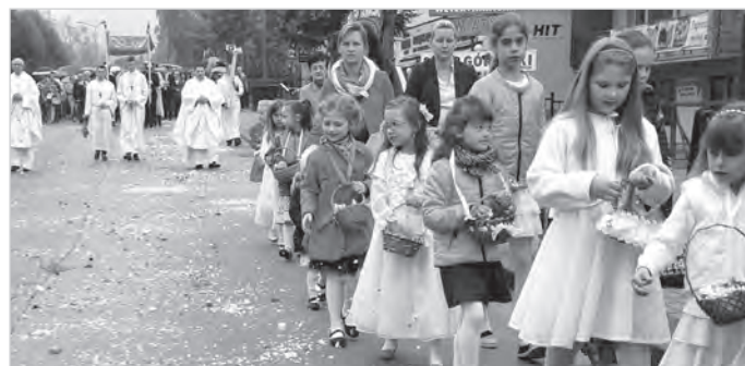
W dniu święta Bożego Ciała po pierwszej mszy w kościele pw. św. Klemensa wierni przeszli procesją przez ulice Ustronia. Procesja na ul. Grażyńskiego.

Przed tym meczem Góral jeszcze miał mgliste szanse na awans, a przede wszystkim na zbliżenie się do lidera. Po pierwszej połowie, gdy to Góral z Kuźnią wygrywa, a Skoczów przegrywa z Zebrzydowicami, szanse nabierają realności, tym bardziej, że Góral ma jeszcze mecz zaległy. Kuźnia dwie bramki traci po dobitkach i tu na pewno zawiodła asekuracja naszej obrony. Gdy w 7 min. strzał z rzutu karnego odbija Joachim Mikler, przy piłce pierwszy jest zawodnik Górala. Drugą bramkę Góral też zdobywa z dobitki, tym razem po rzucie wolnym. Trzecią, ponownie z karnego za niepotrzebny faul w narożniku pola karnego. (Is)