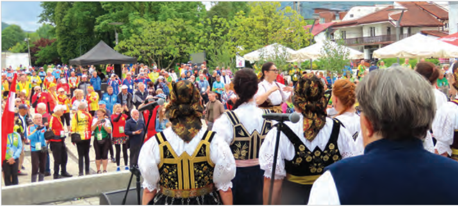
Czantoria zachwycała przodowników z całej Polski.