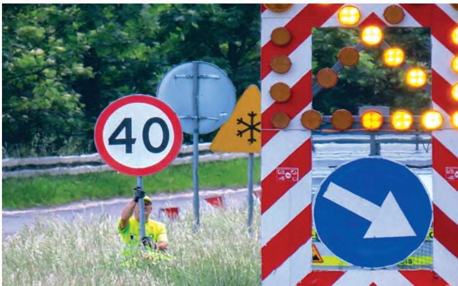
Na drodze wojewódzkiej trwają prace remontowe i pielęgnacyjne.