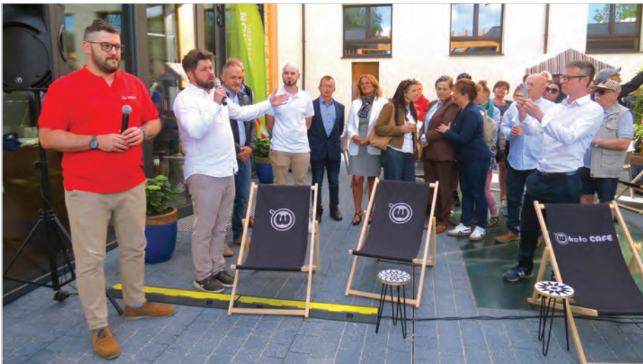
Oficjalne otwarcie Stawu Kajakowego.

Baza Zlotu znajduje się w Ustroniu w domu wczasowym Globus, część przodowników mieszkać będzie u nas, serwis rowerowy również świadczyć będą ustronscy fachowcy. Aż do piątku na naszych ulicach mamy szansę spotkać delegatów z 83 klubów z całej Polski, a także z Białorusi, Ukrainy i nawet ze Szkocji. Zarejestrowało się 547 uczestników, którzy zwiedzają muzea i ciekawe miejsca na całym Śląsku Cieszyńskim i na Zaolziu. To wyjątkowe wydarzenie i wyjątkowi ludzie, jak można się było przekonać podczas inauguracji. Zakończenie w piątek, 5 czerwca o godz. 18.00 w Amfiteatrze. (mn)