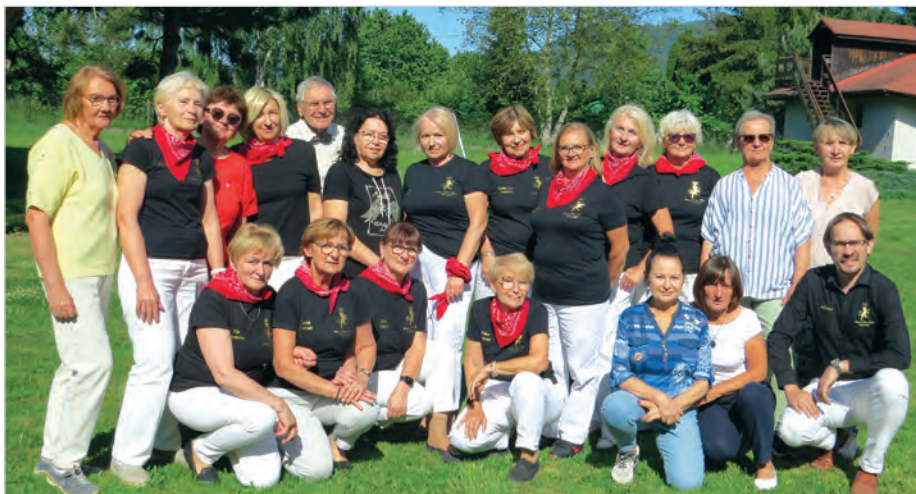
Zespół tańca liniowego i przyjaciele.