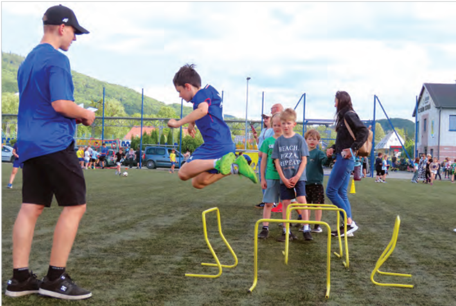
Dzieci zaliczają różne konkurencje i zbierają za to punkty.