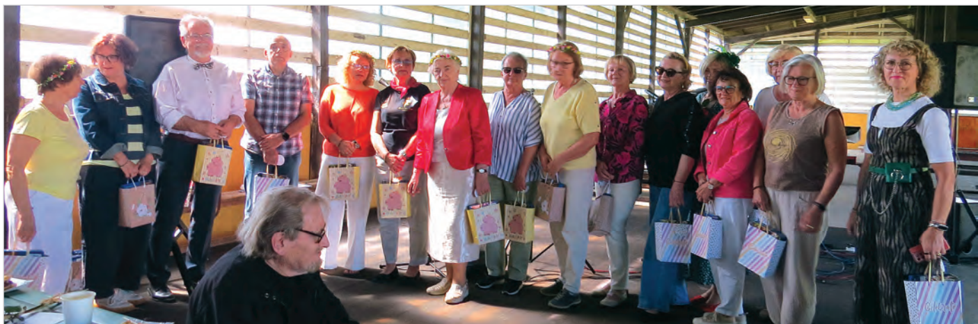
Podziękowanie dla liderów grup. Na pierwszym planie Mistrz Adam Makowicz.