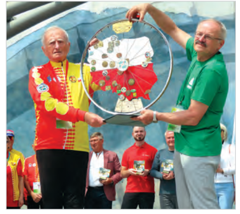
Oficjalne przekazanie koła organizatorów Cieszyniakom.