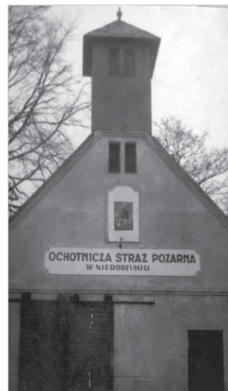
Remiza strażacka w Nierodzimiu, istniejąca w latach 1930-1972.