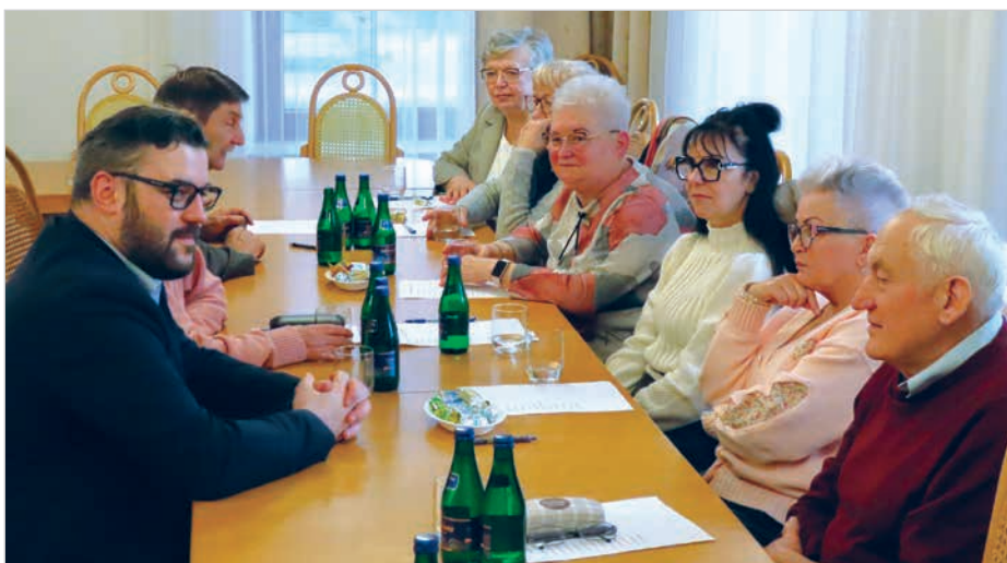
Owocne rozmowy podczas wyborów do Rady Seniorów Miasta Ustroń.