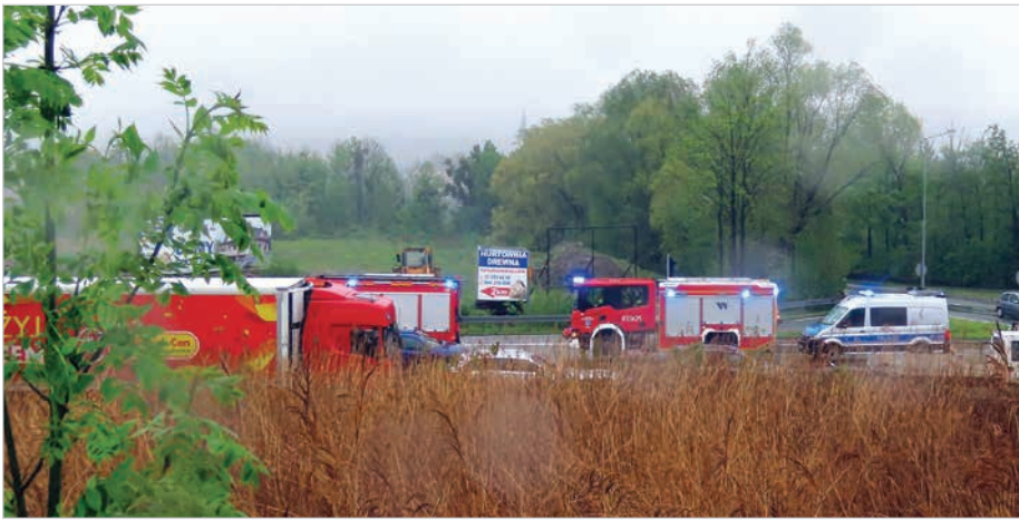
Straż pożarna, pogotowie, policja to bardzo częsty widok na DW941.