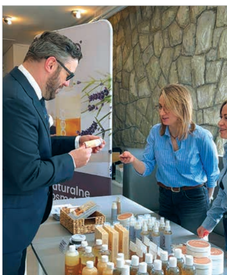
XVII Forum Seniora na Zawodziu.