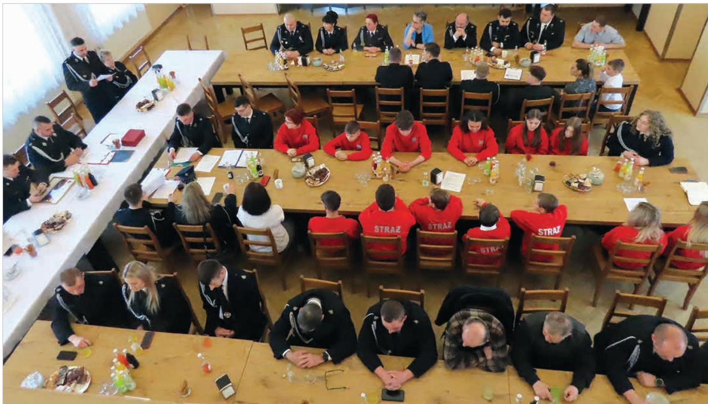
Tylko w strażnicy w Polanie, z balkonu nad salą można zrobić takie zdjęcie.